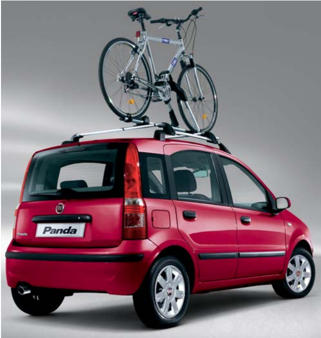
Barras portaobjetos Bicycle.

Algunas propuestas de personalización disponibles en el nuevo Panda.