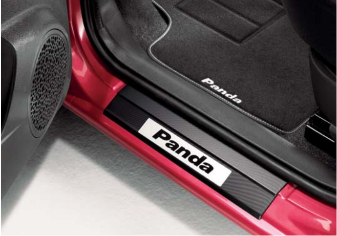
Alfombrillas y cantonera.