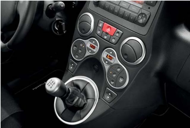
Molduras de color aluminio.