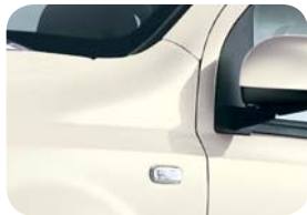
268 Blanco Bossa Nova Sólido