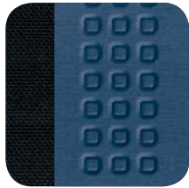
638 Vision Gris/Azul