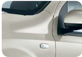
612 Gris Breakbeat Metalizado