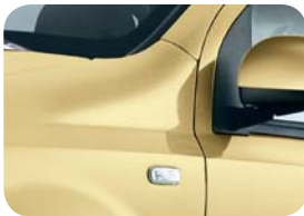
541 Amarillo Mambo Sólido