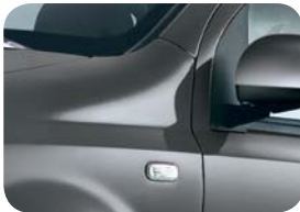
695 Gris Electroclash Metalizado