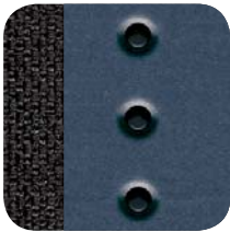
094 Jeans Gris/Azul