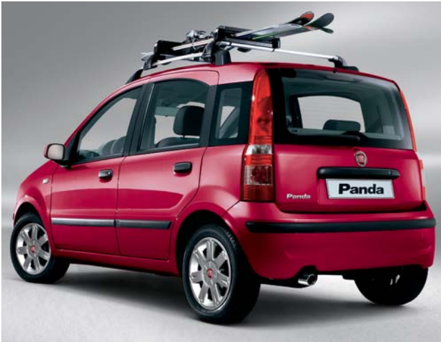
Barras portaobjetos Free Carver.