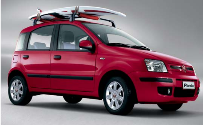
Barras portaobjetos Surf Rider.