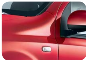
111 Rojo Pasodoble Pastel extraserie