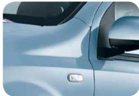
792 Azul Surf Metalizado