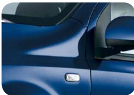
475 Azul Goth-Metal Pastel extraserie