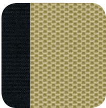
238 Sail Arena/Negro