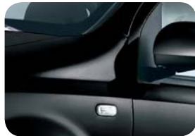
876 Negro Crossover Metalizado