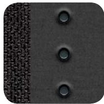
100 Jeans Gris/Negro