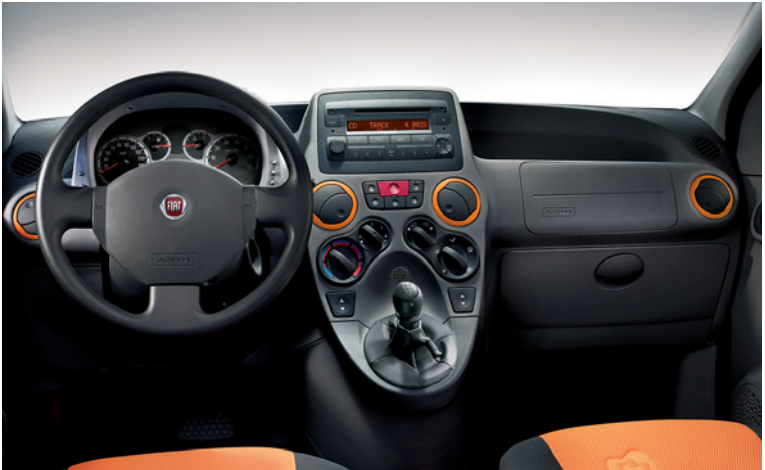
Tejido lavable para asientos y paneles. Toberas de salida de aire pintadas.