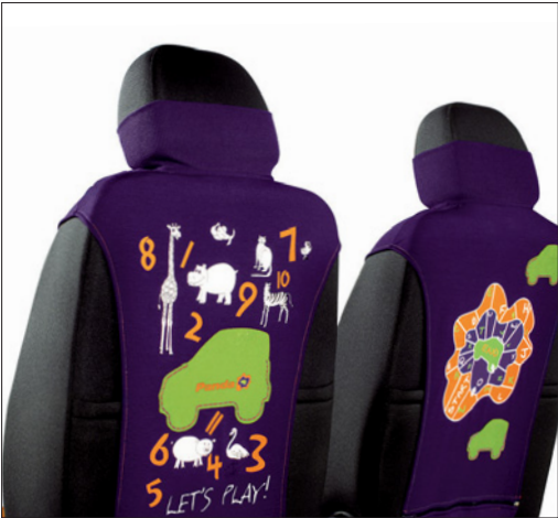
Fundas multifunción para los asientos delanteros.

Imagina un Panda que sea como una madre para tus hijos. Como el Panda Mamy. Un coche atento a las necesidades de los más pequeños y que a la vez te mimas a ti con ideas inteligentes. Su tamaño compacto y su posición de conducción alta que domina la calle lo convierten en un coche práctico y agradable de conducir. Está lleno de ideas dedicadas a tus pequeños, como un espejo para vigilarles, anclajes para las bolsas en el maletero e incluso fundas coloreadas multifunción y asientos lavables a prueba de meriendas. Ya era hora de que alguien pensara en eso.