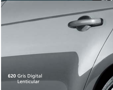
620 Gris Digital Lenticular