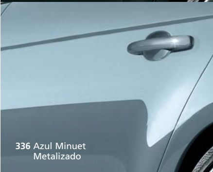
336 Azul Minuet Metalizado