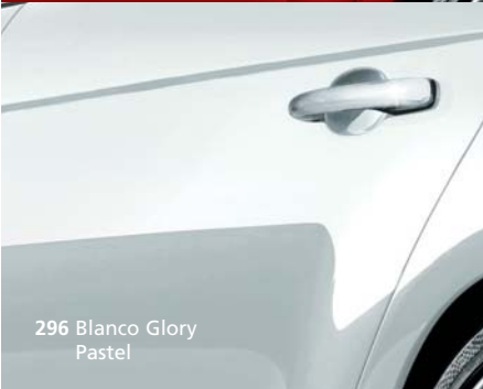
296 Blanco Glory Pastel