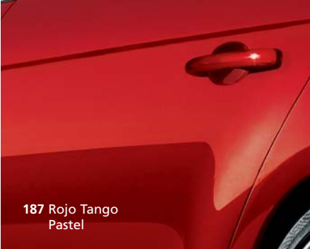
187 Rojo Tango Pastel

Las combinaciones cromáticas del Bravo responden a un ideal de belleza hecho de armonía y vivacidad, de dinamicidad y elegancia.