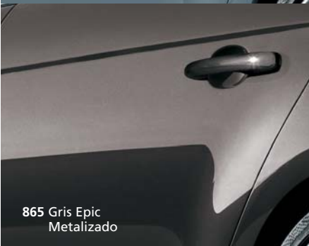
865 Gris Epic Metalizado