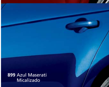
899 Azul Maserati Micalizado