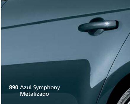
890 Azul Symphony Metalizado