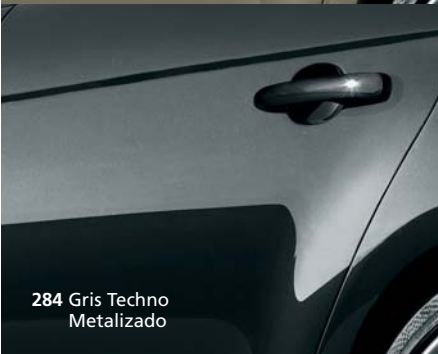
284 Gris Techno Metalizado