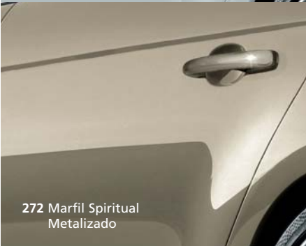
272 Marfil Spiritual Metalizado