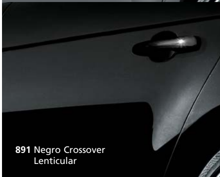
891 Negro Crossover Lenticular