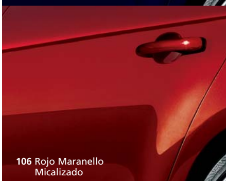
106 Rojo Maranello Micalizado