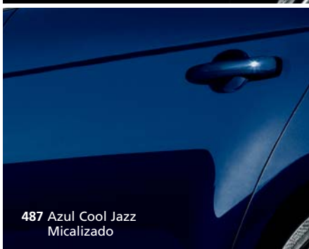
487 Azul Cool Jazz Micalizado