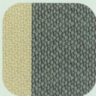
293 Tessuto Squash Grigio / Avorio (600 Active; 600 50 th Anniversary)