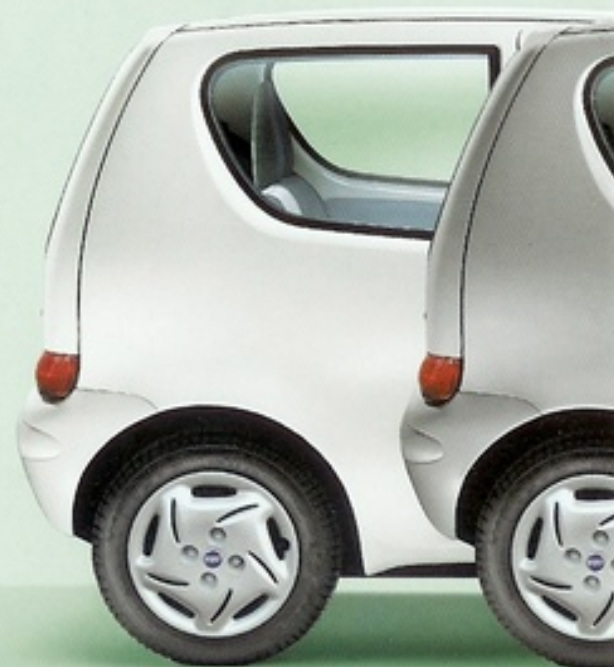
268 Bianco Bianco Pastello