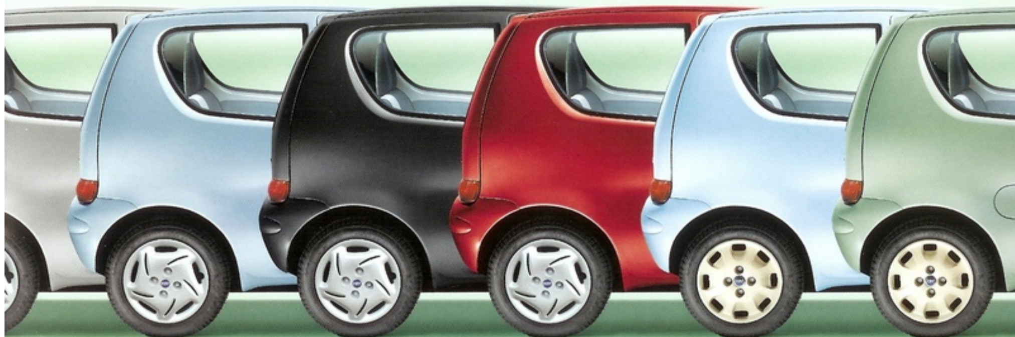
792 Azzurro Settimo Cielo Metallizzato

(Coppe ruota color avorio solo su 600 50 th Anniversary)