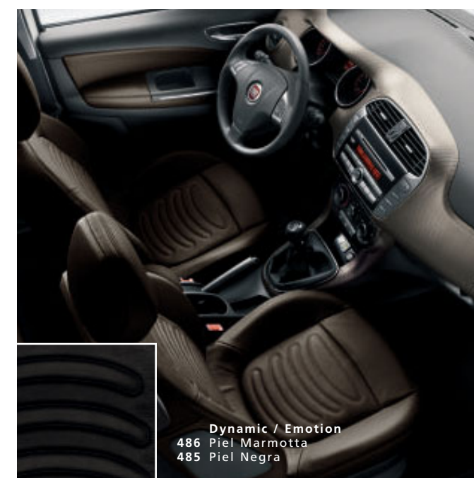
Dynamic / Emotion 486 Piel Marmotta 485 Piel Negra