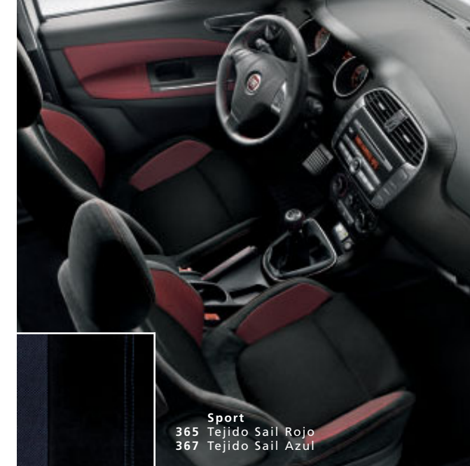
Sport 365 Tejido Sail Rojo 367 Tejido Sail Azul