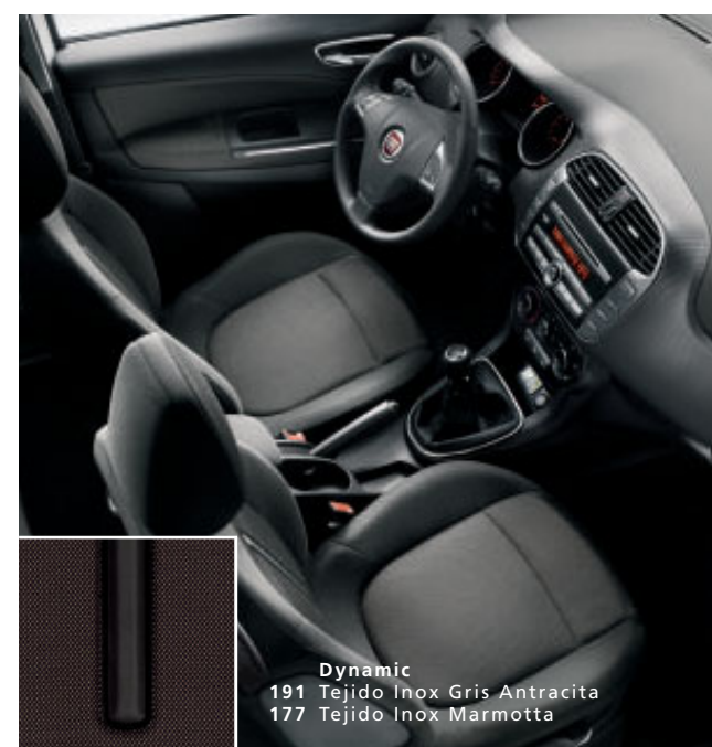
Dynamic 191 Tejido Inox Gris Antracita 177 Tejido Inox Marmotta