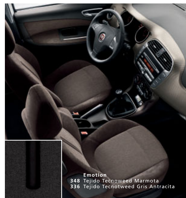
Emotion 348 Tejido Tecnoweed Marmota 336 Tejido Tecnoweed Gris Antracita