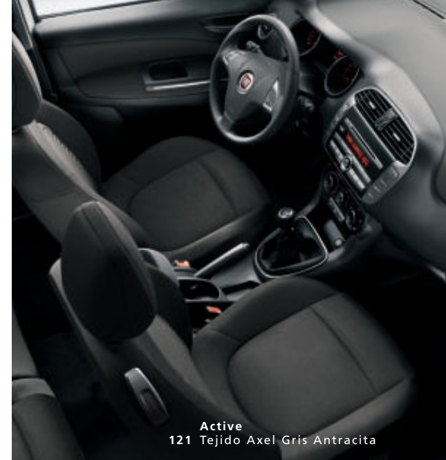
Active 121 Tejido Axel Gris Antracita