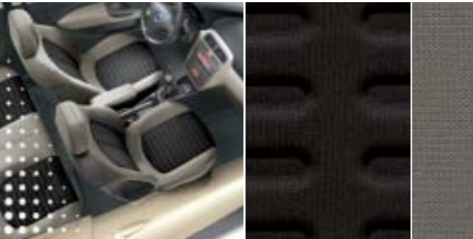
353 Denim Schwarz