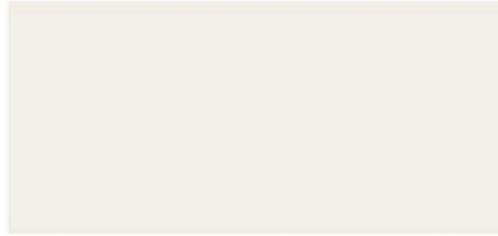
249 Ambient Weiß