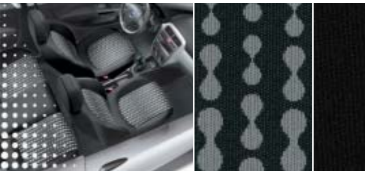
233 Drop Grau