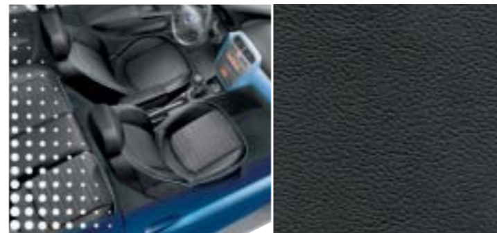
211 Leder Elegant