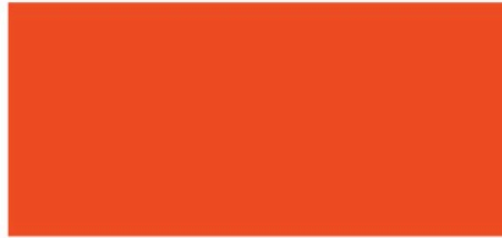
551 Caribbean Orange