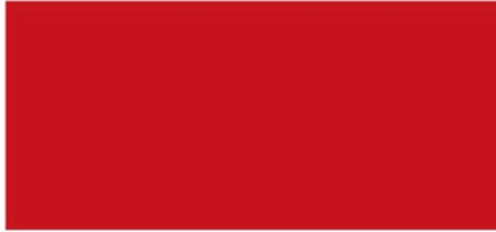
176 Exotica Rot