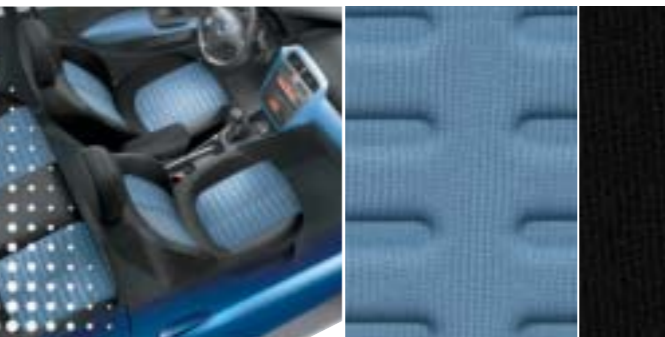
356 Denim Blau