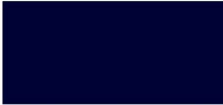
475 Rock'n'roll Blau