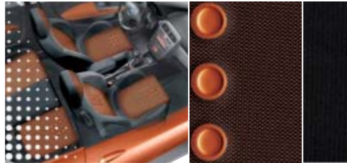
625 Inox Orange