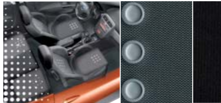
626 Inox Grau