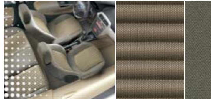
516 Tweed Gold-Sand