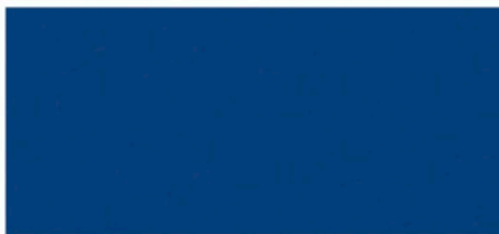
599 New Orleans Blau