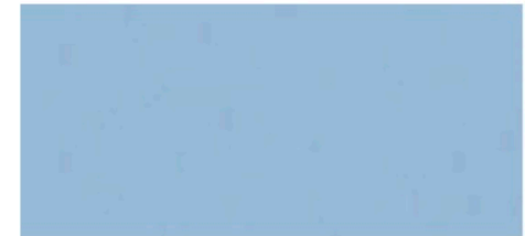
457 Psychedelic Blau