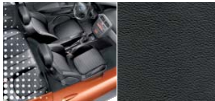
212 Leder Sport