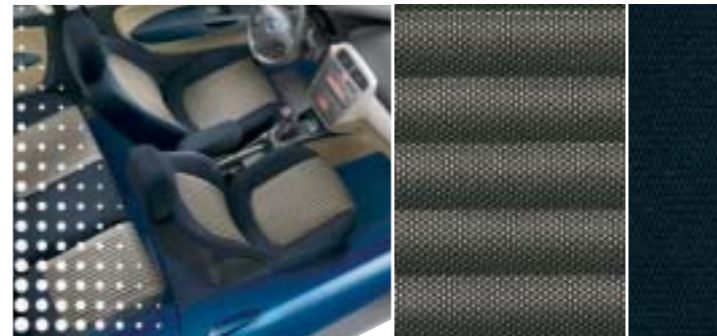
517 Tweed Blau-Sand