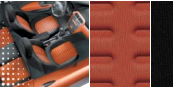
354 Denim Orange