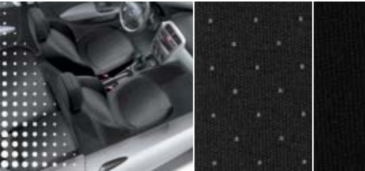
230 Drop Schwarz