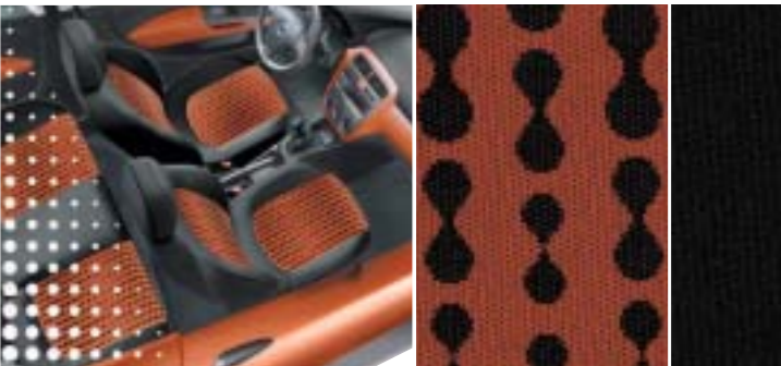
232 Drop Orange