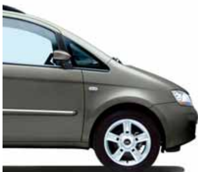
690 Digital Grau Metallic