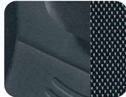
204 Stoff Inox Schwarz/Blau