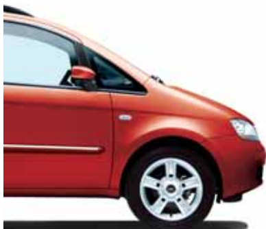
199 Rumba Rot Pastell