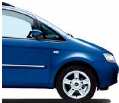
599 Electro Blau Metallic