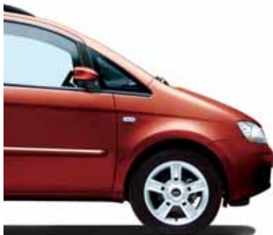
163 Bolera Rot Metallic