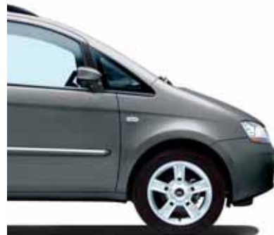
600 Garage Grau Metallic