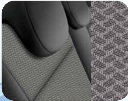
111 Stoff Iris Grau