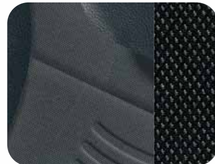
319 Stoff Inox Schwarz/Acciao