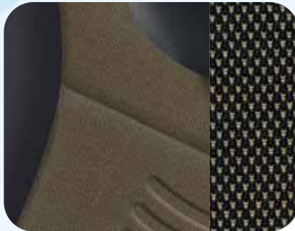
200 Stoff Inox Schwarz/Bronze