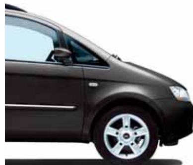
601 Darkwave Schwarz Pastell