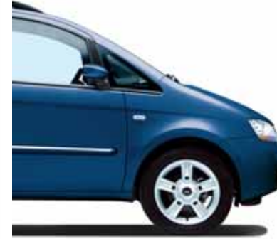
845 Chorus Blau Metallic