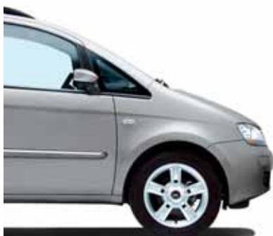
612 Minimal Grau Metallic