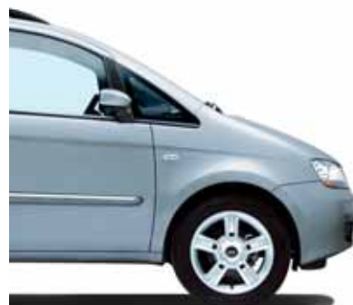
792 Surf Blau Metallic