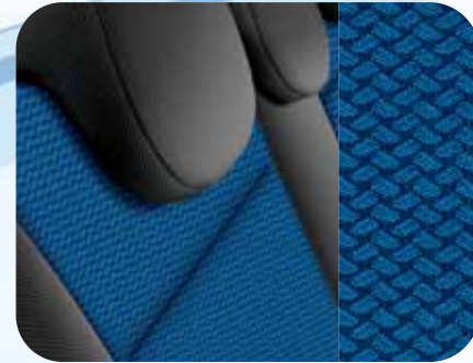
141 Iris Blau