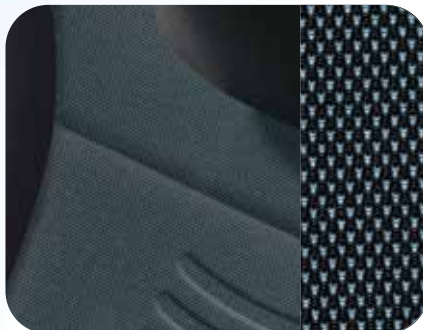
317 Stoff Inox Schwarz/Blau