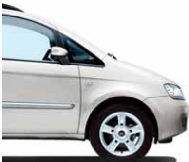
249 Ambient Weiß Pastell