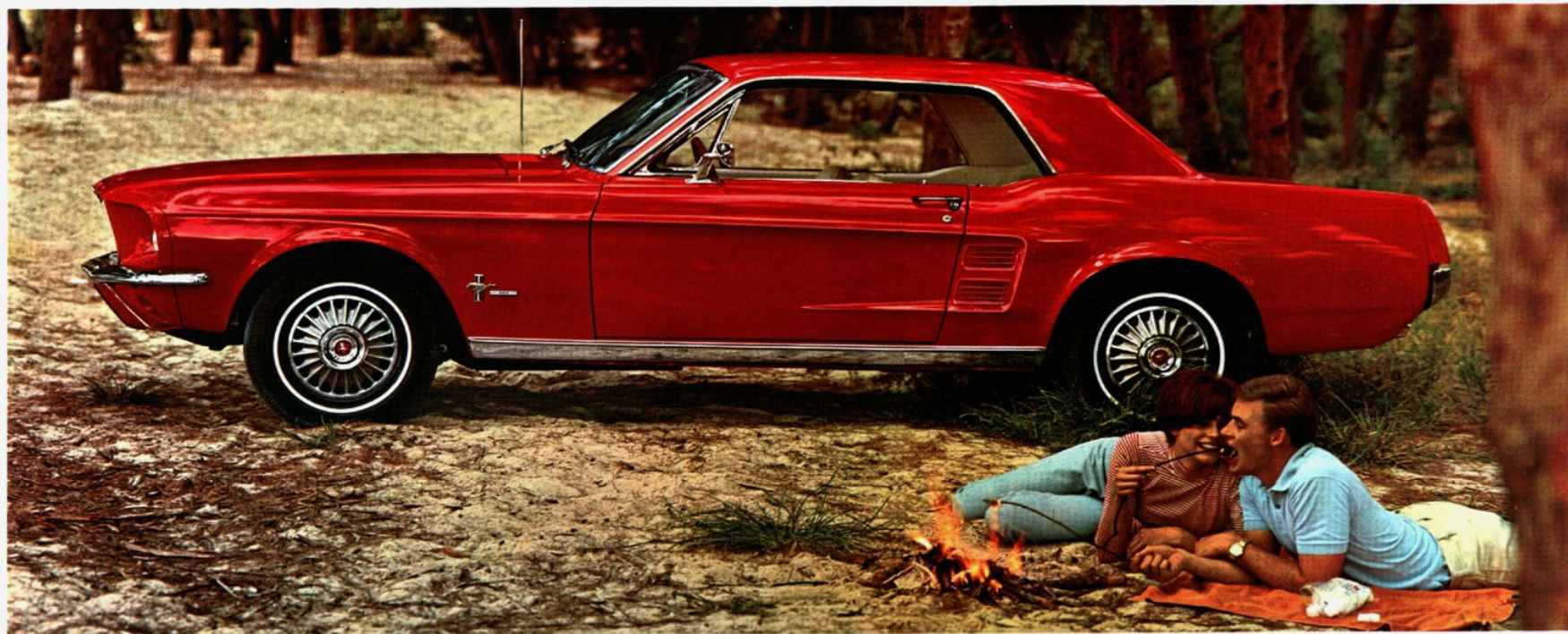
Der T5 Hardtop

Es ist seine Linie, diese Verschmelzung von Sportlichkeit und Eleganz, die diesen Wagen so ungewöhnlich macht. Und so ungewöhnlich erfolgreich.