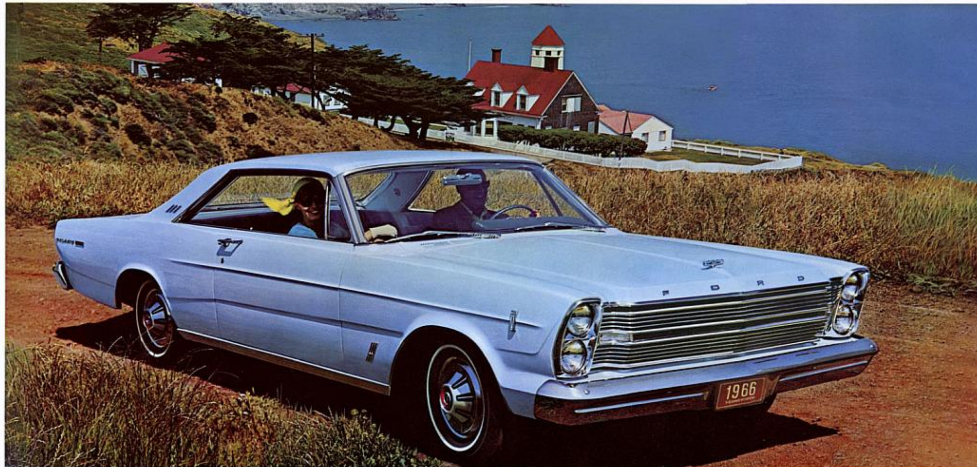
Hardtop 2 portes Galaxie 500