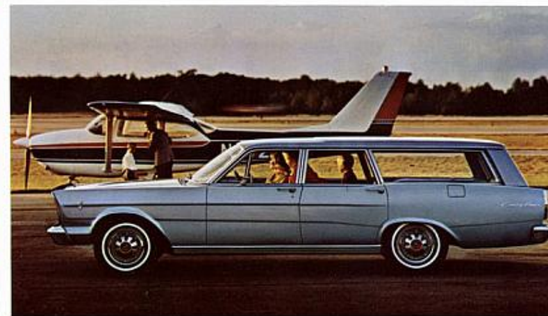
LA COUNTRY SEDAN, UNE DES QUATRE WAGONNETTES FORD.

*Option †Facultatif sur tous les autres modèles Ford '66 **Facultatif sur les 7-Litres.