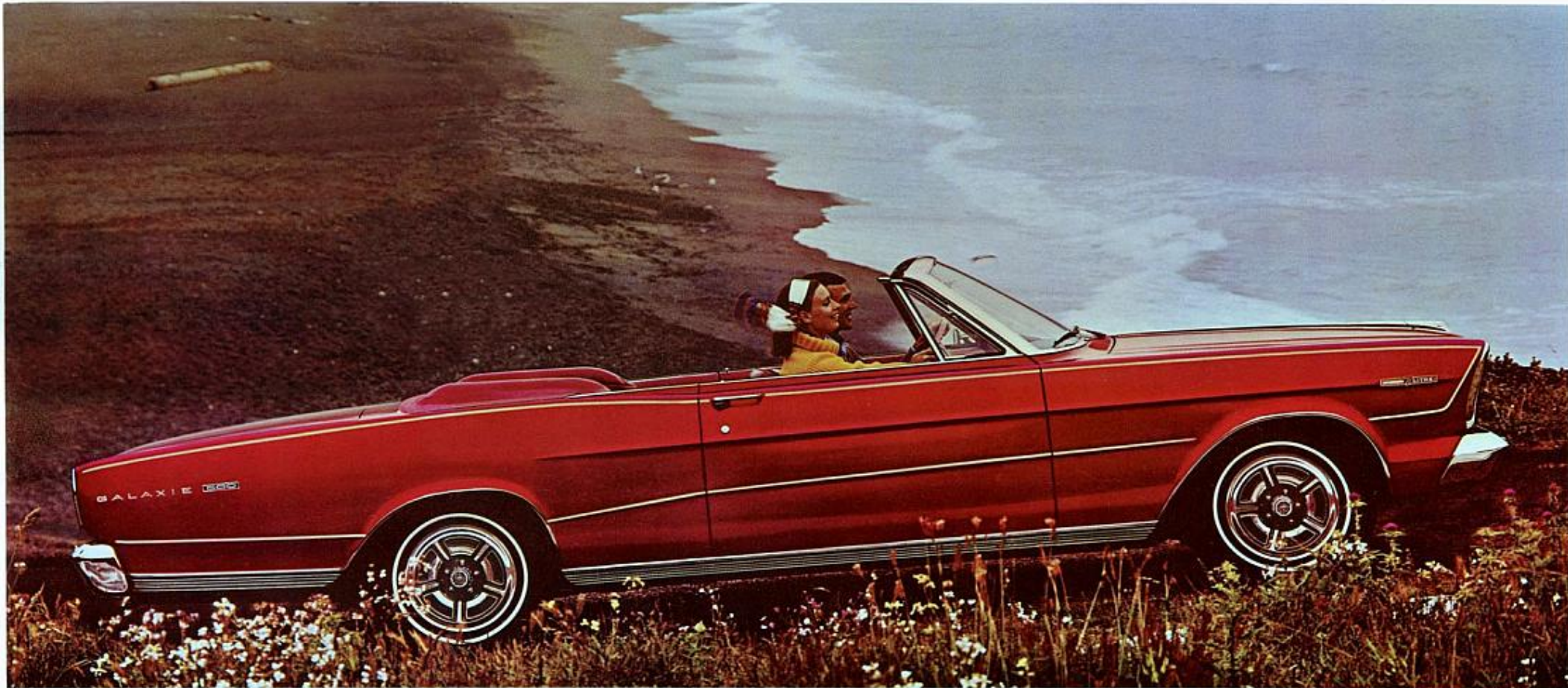
Décapotable Galaxie 500 7-Litres.

Ford. Sièges baquet rembourrés mousse à l'avant (voir page 6). Console de commande entre les sièges. Revêtement complet de vinyle souple. Ceintures de sécurité avant et arrière. Tableau de bord et pare-soleil rembourrés. Glace arrière de verre dans la décapotable... et ce n'est là que le début. Avec les options 7-Litres, vous pouvez allier performances et confort luxueux !