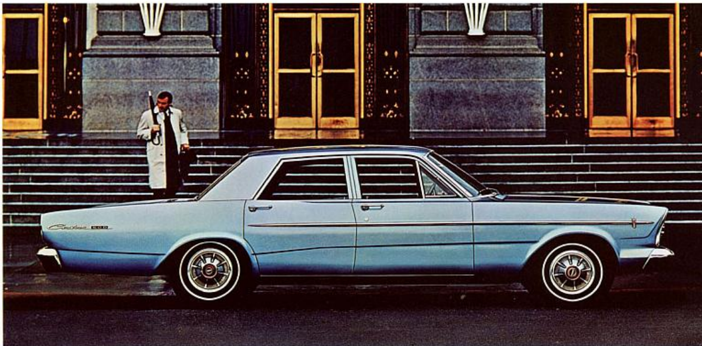
Sedan 4 portes Custom 500