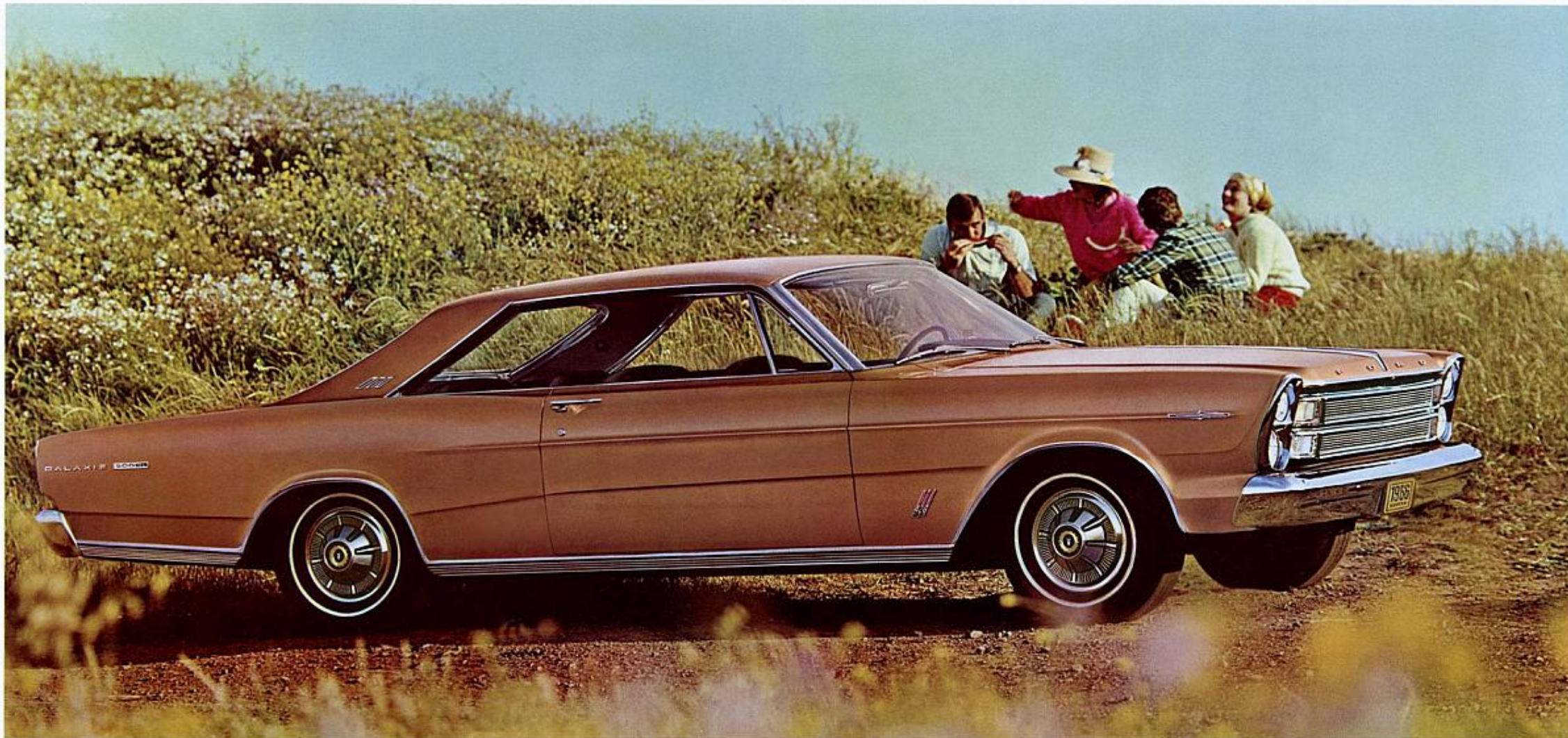
Hardtop 2 portes Galaxie 500/XL

Ajoutez un appareil Stereo-sonic à bandes sonores d'une musicalité encore inconnue et la commodité d'un siège à commande électrique à six voies. Choisissez l'un des cinq V8 Ford (jusqu'à 425 cv) pour connaître une nouvelle mesure d'excellence générale et réalisez votre propre XL, comme vous l'entendez—rien ne peut vous arrêter!