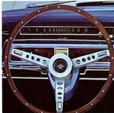
Volant type sport à garniture simili noyer.