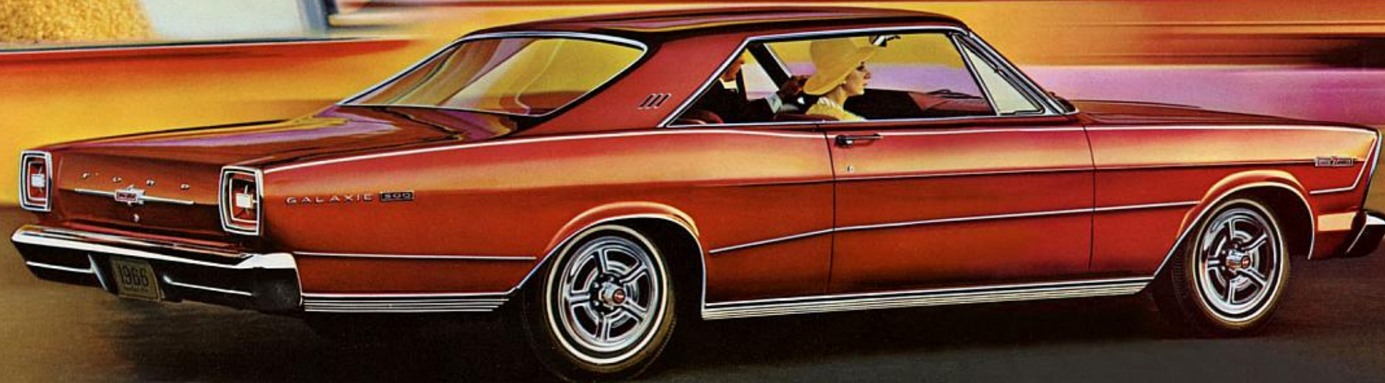
LA HARDTOP 2 PORTES GALAXIE 500 7-LITRES, UN DES 17 MODÈLES FORD.

Dans la Ford '66, le silence reflète la qualité... une qualité totale, particulièrement apparente dans la tenue de route. Souple, douce, stabilisée sans dureté... merveilleusement silencieuse. Les perfectionnements mécaniques de la suspension Ford (voir page 4) la feront certainement remarquer cette année.