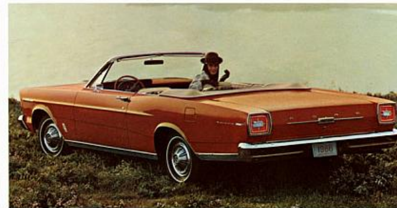
LA DÉCAPOTABLE GALAXIE 500/XL, UNE DES TROIS DÉCAPOTABLES FORD.