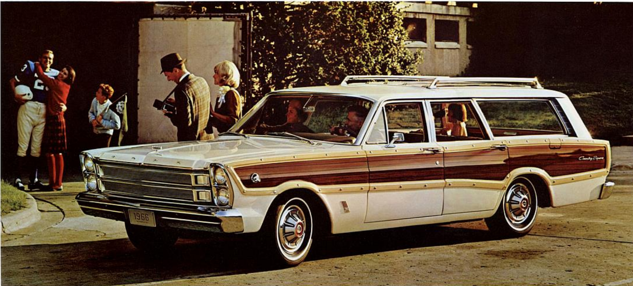
La Country Squire Ford... une des quatre grandes wagonnettes '66 (Country Sedan illustré page 2)