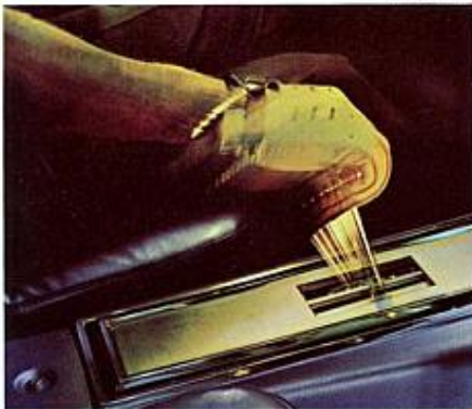
Cruise-O-Matic à 3 vitesses standard à levier monté sur la console.