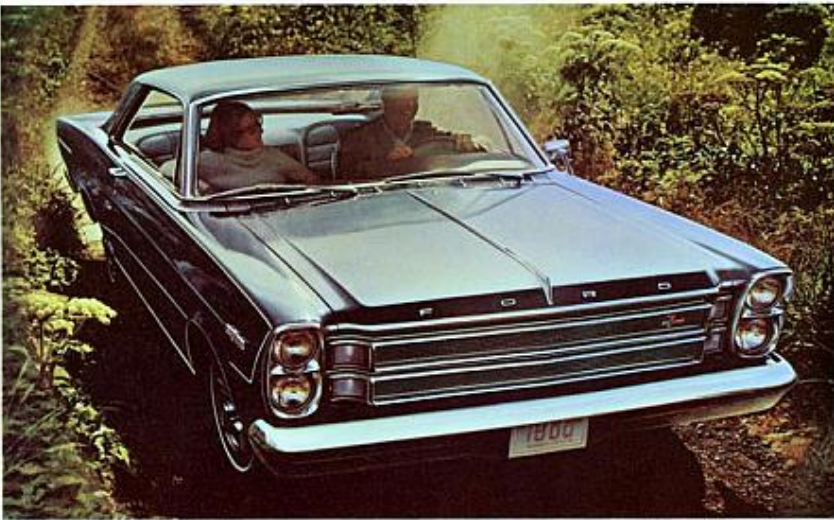
Nouvelle hardtop 7-Litres... excellence générale et grande souplesse.