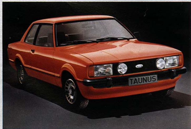
Taunus S: H4-Halogen-Hauptscheinwerfer und zusätzliche Halogen-Weitstrahler.

Ein großer Drehzahlmesser komplettiert die Instrumentierung des Taunus S.