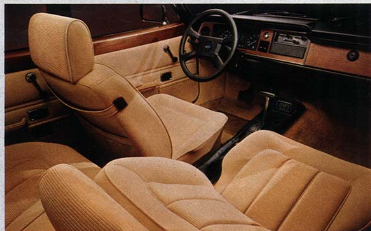
Ghia-Innenraum: Einzelligesitzerverhöhenverstellbaren Kopfstützen.

Ein höchst praktisches Detail ist das Hochdruck-Waschsystem für die H4-Halogen-Hauptscheinwerfer, dessen Düsen in die Stoßstangenhörner verlegt sind. Zu den weiteren nützlichen Annehmlichkeiten gehören auch der von innen verstellbare Außenspiegel, die Handbrems-Kontrolleuchte sowie die automatische Beleuchtung des Kofferraums.