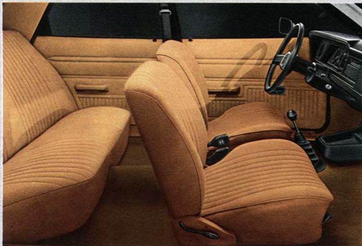
Der großzügige Innenraum des Taunus L.