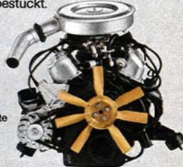
Der berühmte Ford-V6 mit 2 Litern Hubraum.

Von außen erkennt man den GL an den serienmäßigen 5½-Zoll-Sportfelgen und an den Seitenschutzleisten mit Gummieinlage. Die großen Rechteckscheinwerfer sind mit dem intensiveren H4-Halogenlicht bestückt.