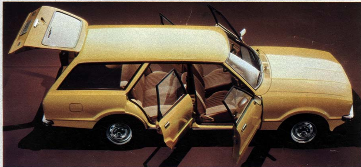
Ford-Werke Aktiengesellschaft, Köln, Werbeabteilung. Technische Angaben und Angaben über Lieferumfang sind unverbindlich. Änderungen bleiben vorbehalten. 1/76. 50472