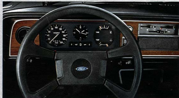
GL-Armaturenfront mit ränderspeichenlenkrad.