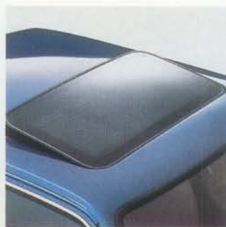
Kurbel-Hubdach aus getöntem Sicherheitsglas serienmäßig

Beheizbare Windschutzscheibe Sonderausstattung, elektrisch einstellbare und beheizbare Außenspiegel serienmäßig ▶ Luxuriöser Innenraum, ausgestattet mit eleganten Stoffen und Mittelarmlehne im Fond, Radio Sonderausstattung ▼