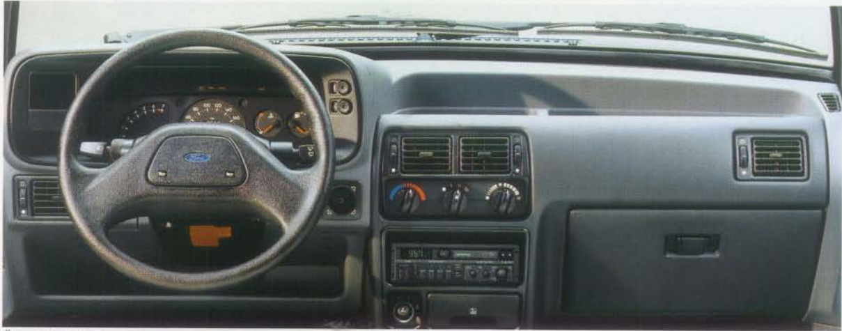
Übersichtliche Instrumente, ergonomisches Design. Inkl. Drehzahlmesser und Stereo-Radio Sound 2004