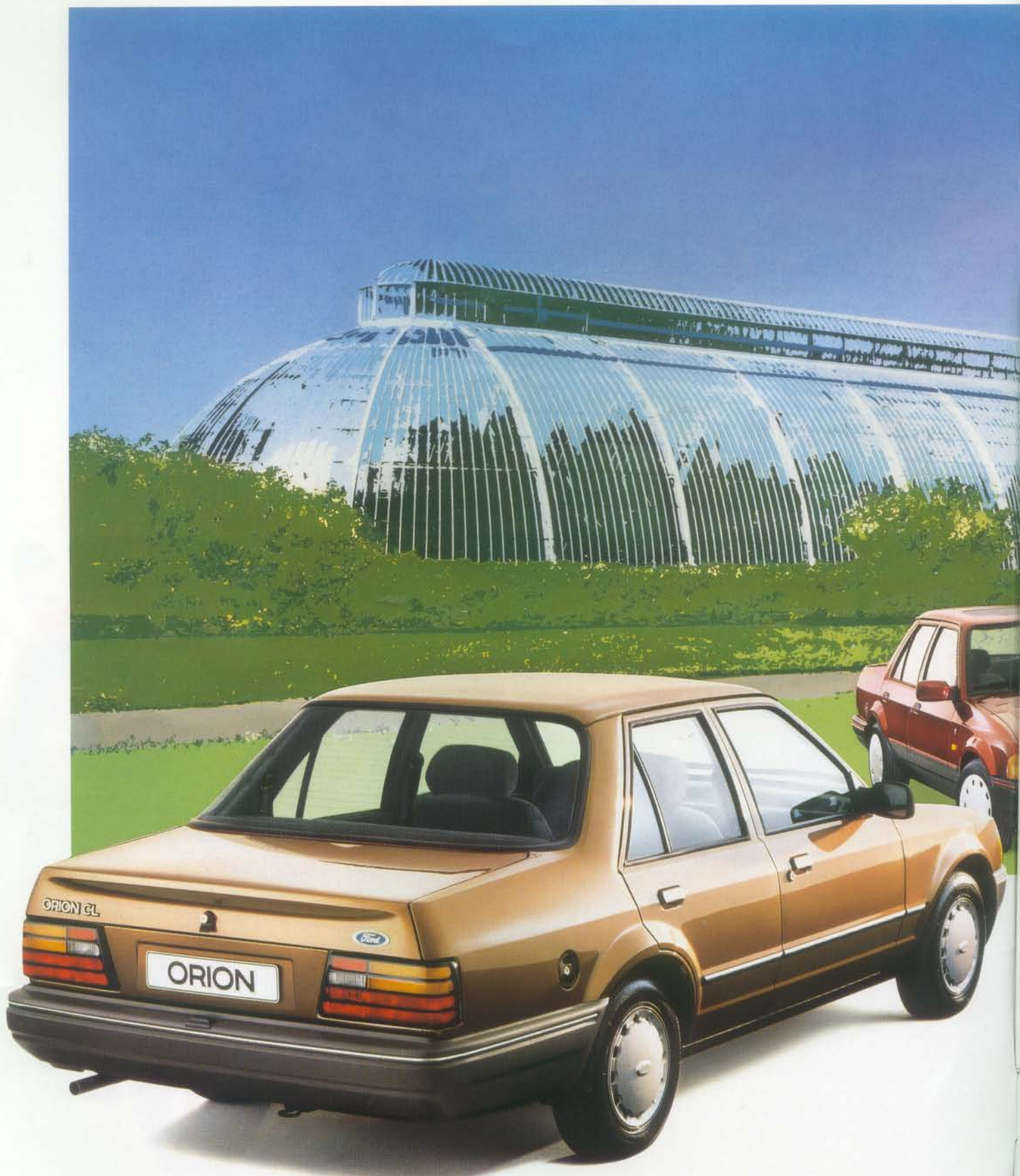
Orion CL, Orion Ghia 1,6i, Orion Ghia