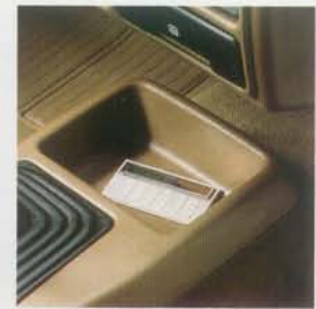
Praktische Ablage in der Mittelkonsole

1,4-l-Euromotor, 1,4-l-i-Kat-, 1,6-l-i-Kat- oder der 1,6-l-Dieselmotor (alle Benzinler befristet steuerbefreit).