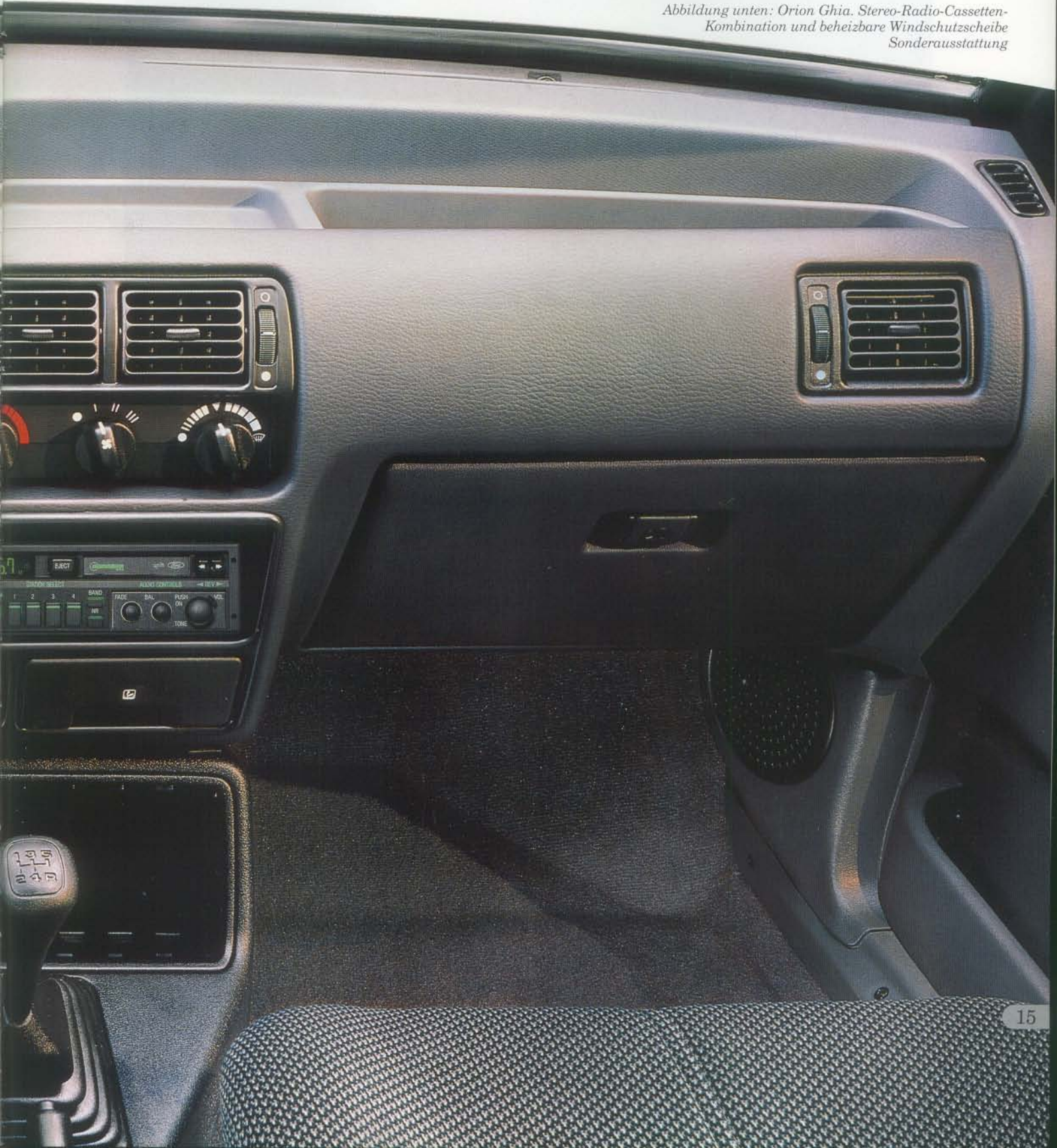
Abbildung unten: Orion Ghia. Stereo-Radio-Cassetten-Kombination und beheizbare Windschutzscheibe Sonderausstattung

Zusätzlich können Orion Ghia und Orion 1,6i Ghia auf Wunsch gegen Mehrpreis mit einer beheizbaren Windschutzscheibe ausgestattet werden – für schnelle Enteisung im Winter (nicht in Verbindung mit 1,3-Liter-Motor – Bravo-Modelle in Verbindung mit beheizbaren, elektrisch einstellbaren Außenspiegeln).