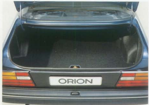
Der geräumige Kofferraum des Orion. Die um 1/3, 2/3 oder ganz umklappbaren Rücksitzlehnenkissen eröffnen Ihnen im Handumdrehen zusätzliche Transportmöglichkeiten

In allen Orion-Modellen steht Ihnen ein Gepäckraumvolumen von 451 Litern (nach VDA) zur Verfügung. Bei Bedarf schaffen Sie sich leicht zusätzlichen Raum durch die zu 1/3, 2/3 oder ganz umklappbaren Rücksitzlehnenkissen. Eröffnen Ihnen im Handumdrehen zusätzliche Transportmöglichkeiten.