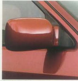
Serienmäßig zwei von innen einstellbare und beheizbare Außenspiegel in Wagenfarbe