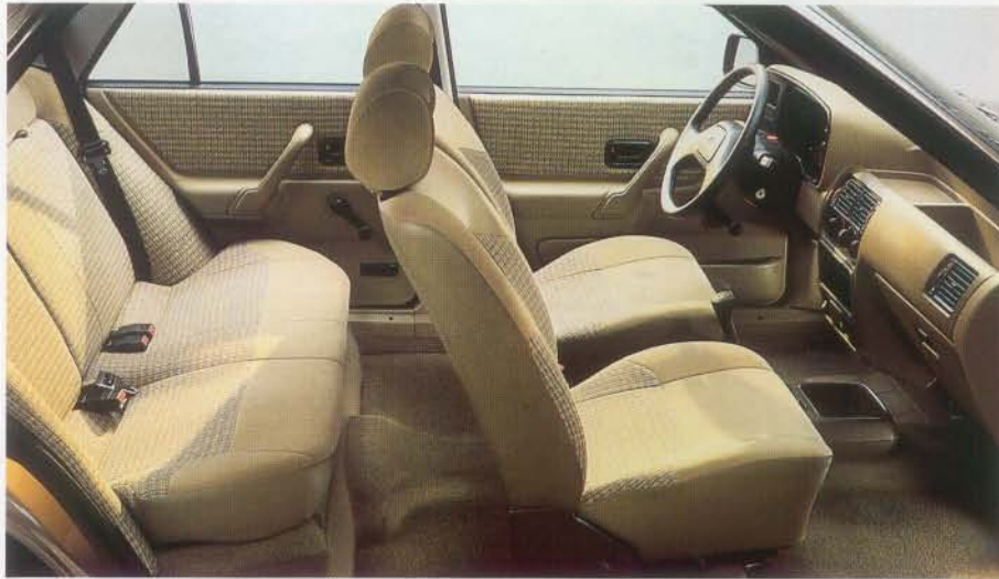
◀ Großzügiger Innenraum