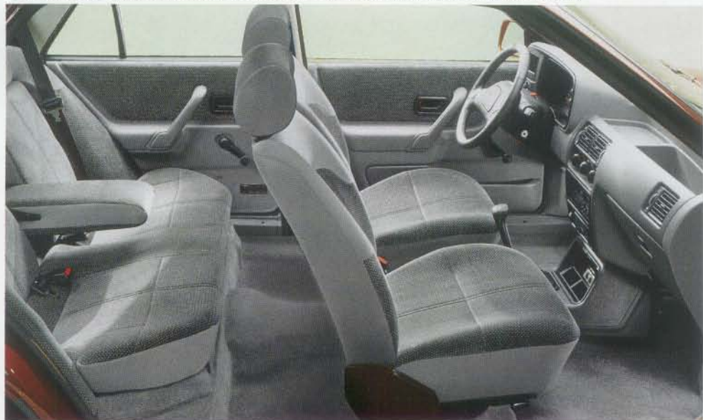
Das Orion-1,6i-Ghia-Interieur: sportlich und komfortabel, Radio Sonderausstattung