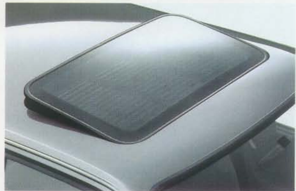
Serienmäßiges Kurbel-Hubdach aus getöntem Sicherheitsglas