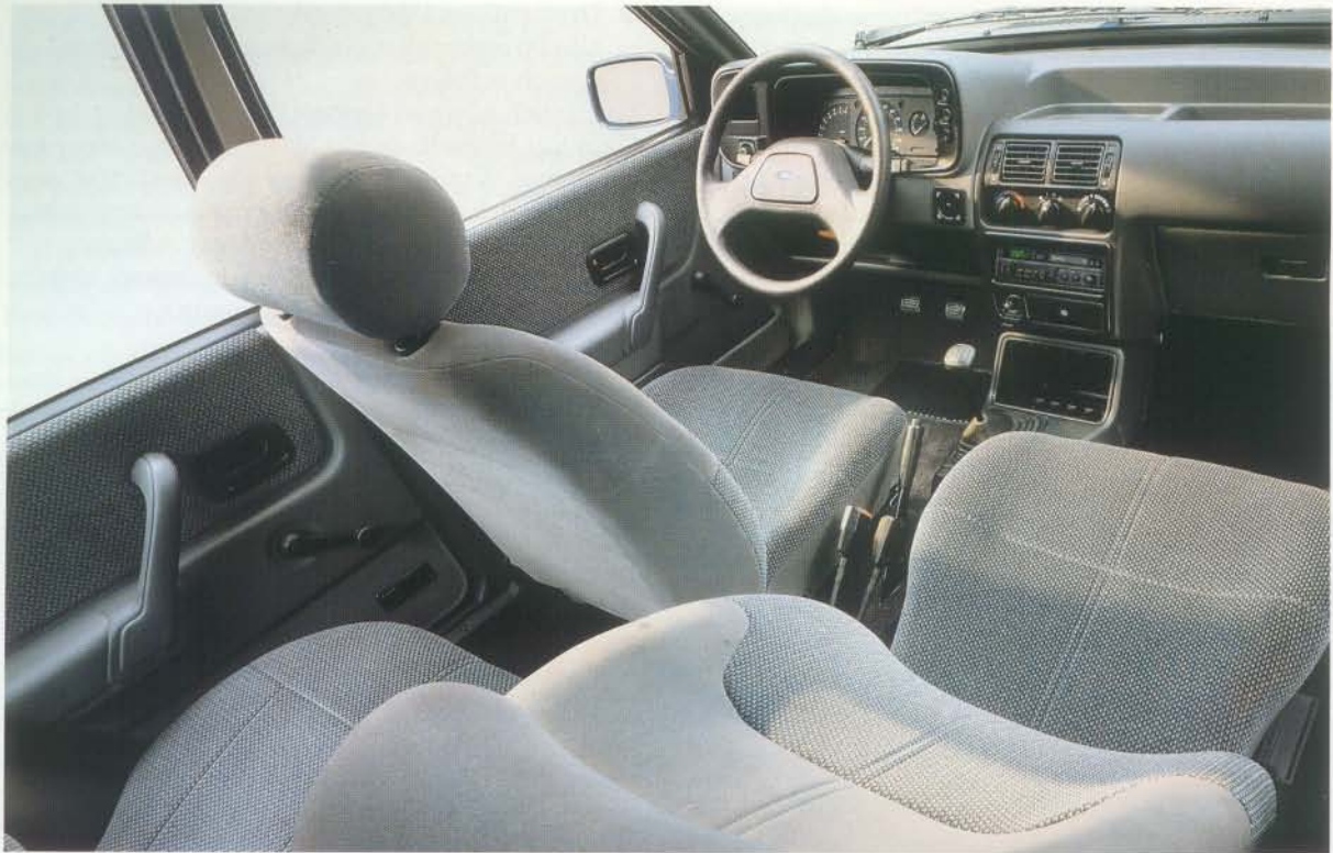
Orion Ghia. Stereo-Radio und beheizbare Windschutzscheibe Sonderausstattung