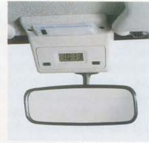
Digitaluhr in der Dachkonsole