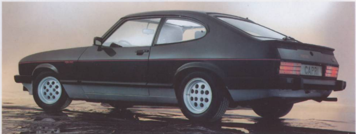
Abb.: Capri 2.8 injection. Zweifarben-Metalliclackierung Sonderausstattung.

Die Aerodynamik der Karosserie und der charakteristische Heckspoiler verbessern die Straßenlage und helfen, Benzin zu sparen.