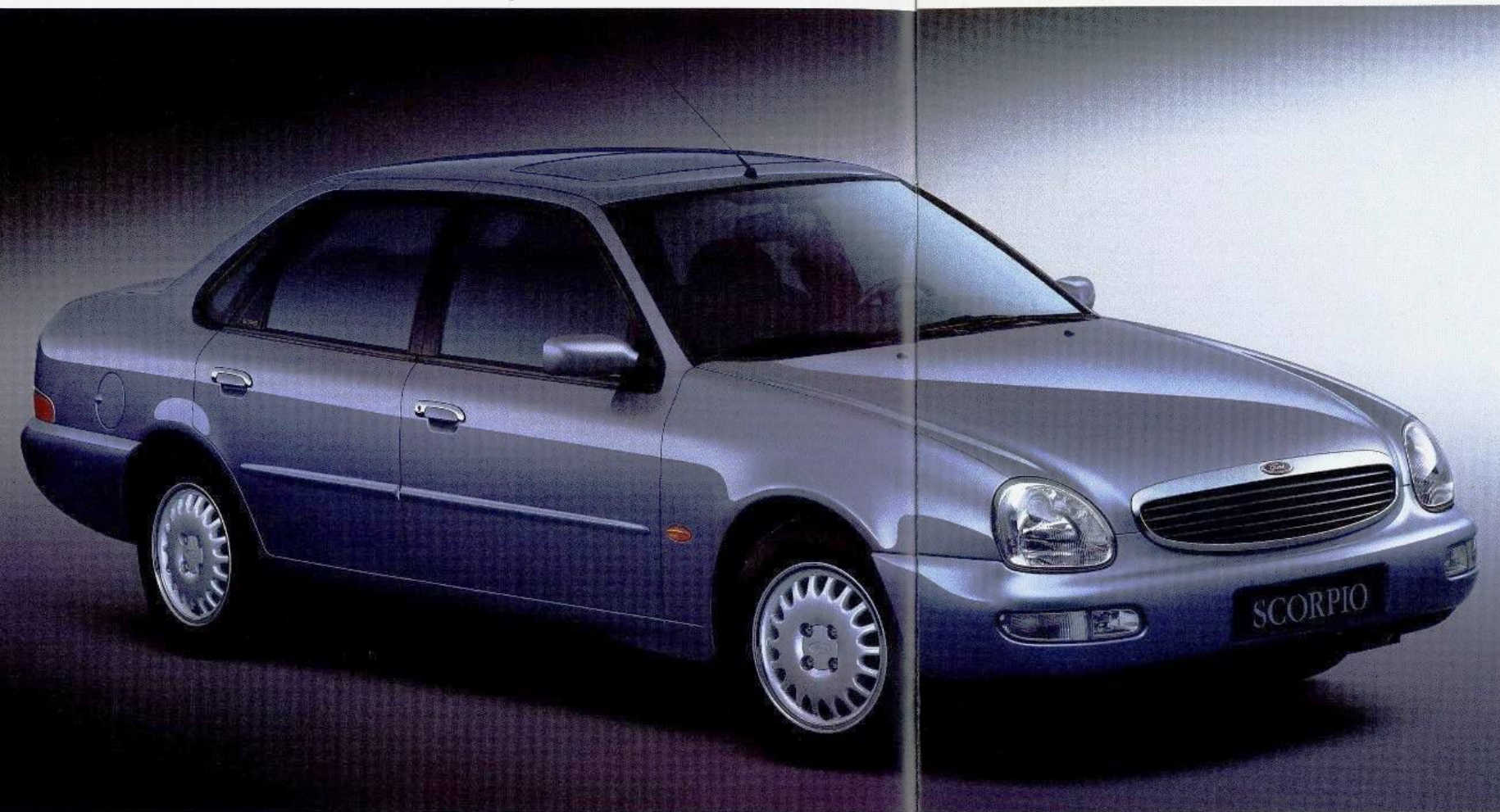
Die Scorpio Style Limousine mit serienmäßiger Metallic-Lackierung und 195 R15-Reifen auf 6Jx15-Leichtmetallrädern. Elektrisches Schiebe-/Hubdach Wunschausstattung.

Mit eigenständigem Design, reicher Ausstattung und hochmoderner Technik zählt der Scorpio zu den attraktivsten Angeboten in seiner Klasse.