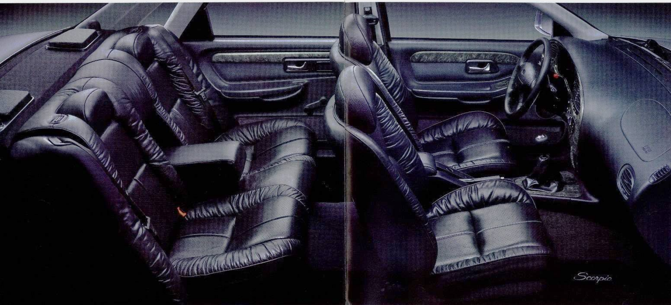
Scorpio Style 24V. Die elegante dunkelgraue Lederausstattung ist als Wunschausstattung lieferbar. Klimaanlage mit automatischer Temperaturregelung und Komfort-Paket-Style Wunschausstattung.

Sie haben zusätzlich die Möglichkeit, „Ihren“ Scorpio Style ganz nach Ihrem persönlichen Wunsch noch individueller (gegen Mehrpreis) auszurüsten: