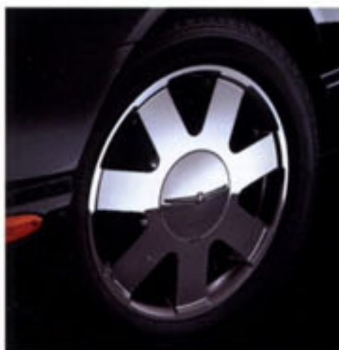
Jante de 17 po à 7 rayons, en aluminium chromé