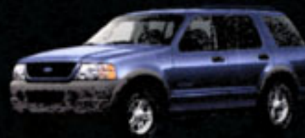
EXPLORER 4 PORTES