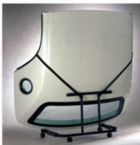
Blanc performance verni