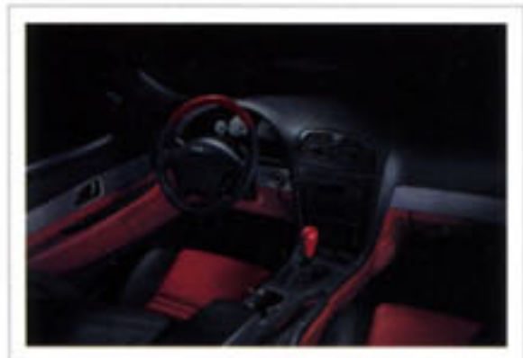
Habitacle représenté avec ensemble garniture intérieure rouge flambeau