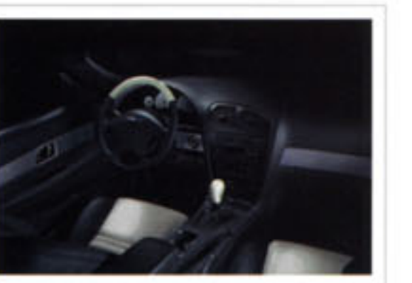
Habitacle représenté avec ensemble garniture intérieure blanc discret