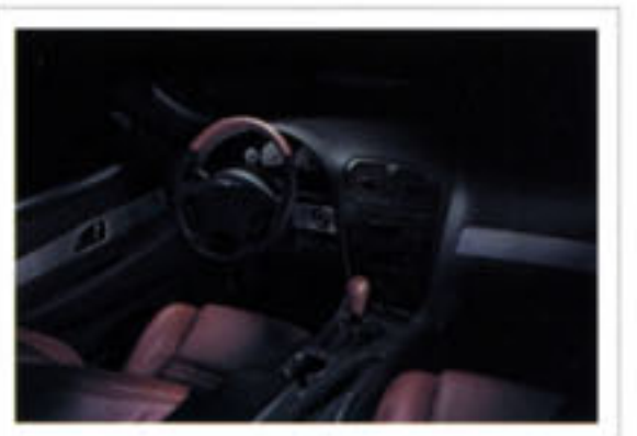
Habitacle représenté avec ensemble garniture intérieure brun sellerie