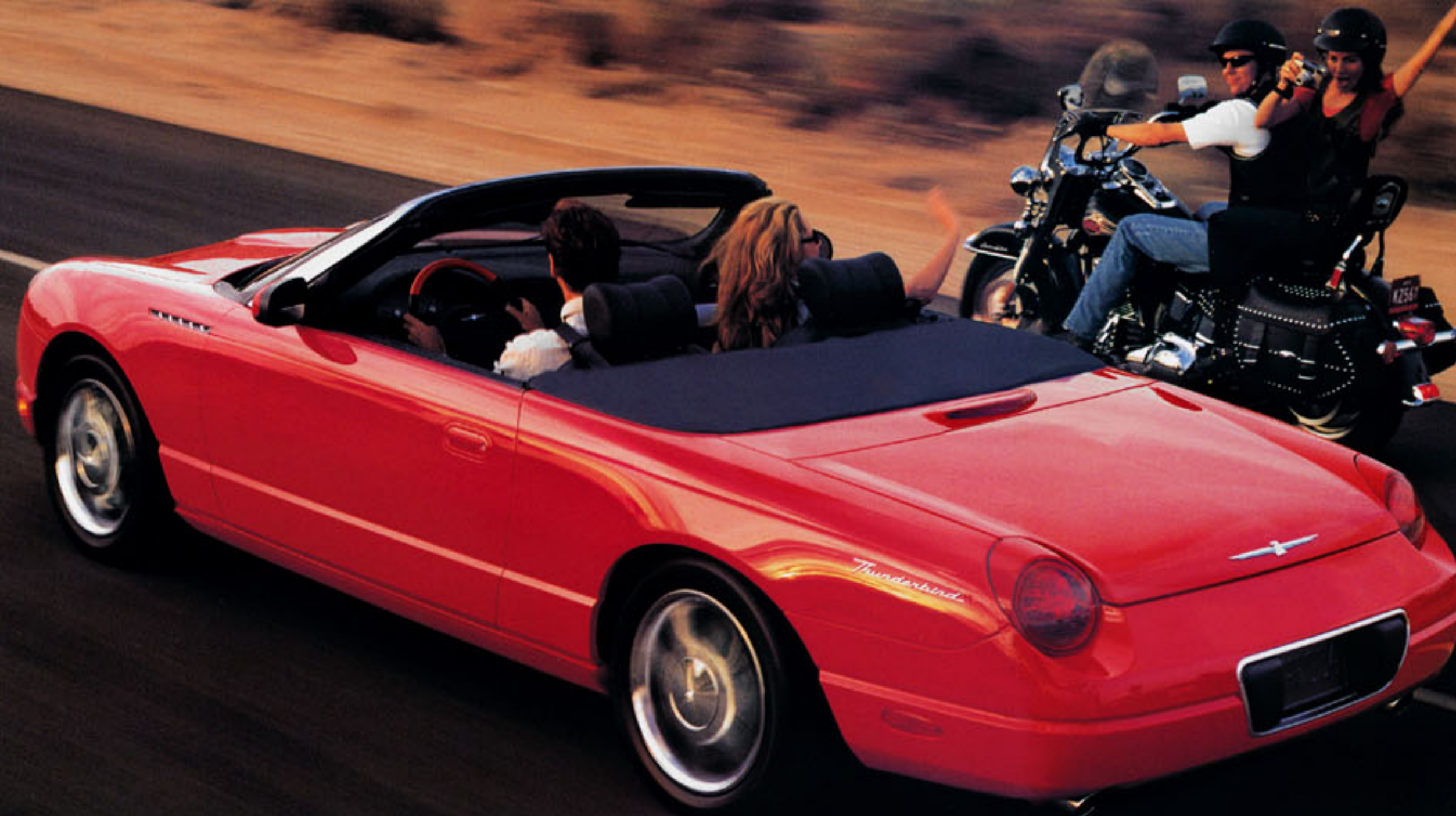
Thunderbird représentée en rouge flambeau