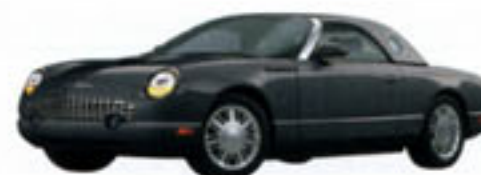
Gris ombre des montagnes