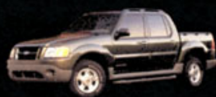
EXPLORER SPORT TRAC