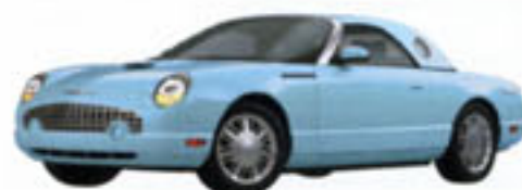
Bleu ciel du désert (Disponibilité limitée)