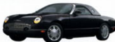
Noir crépuscule verni