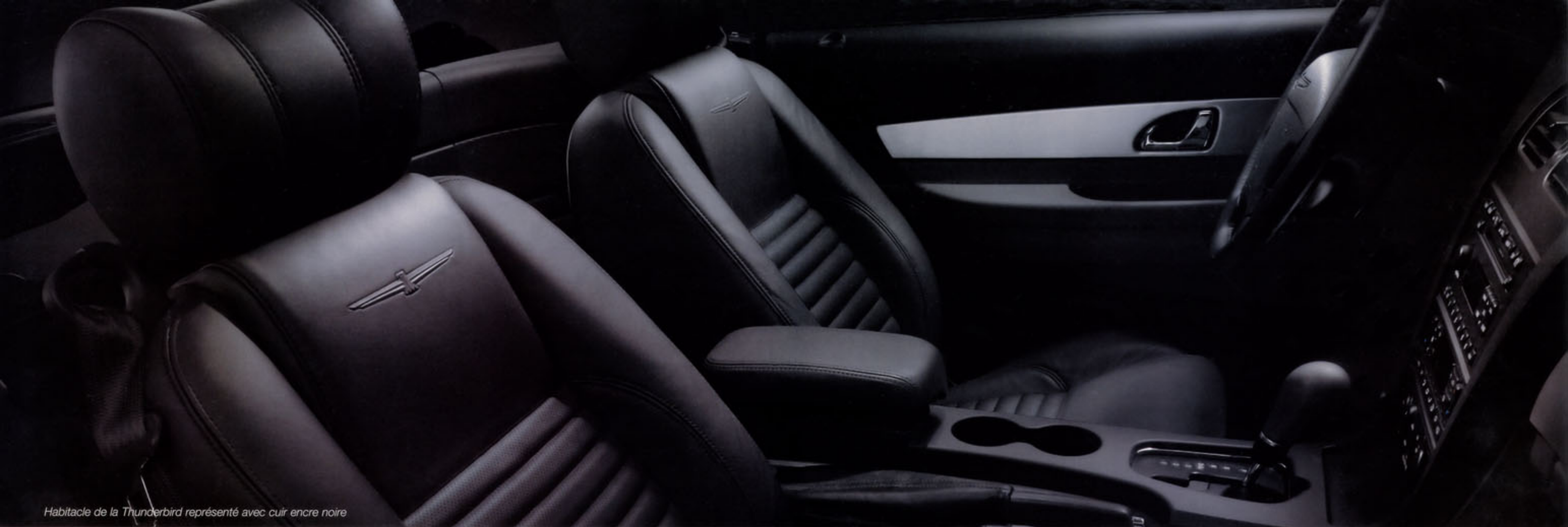
Habitacle de la Thunderbird représenté avec cuir encre noire