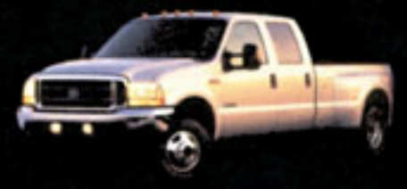
SÉRIE F SUPER DUTY