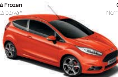
Oranžová Molten Speciální metalická barva*