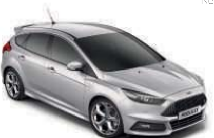
Stříbrná Moondust Metalická barva*