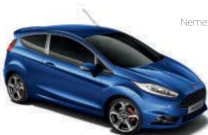
Modrá Spirit Speciální metalická barva*