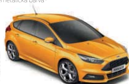
Žlutá Tangerine Scream Speciální metalická barva*