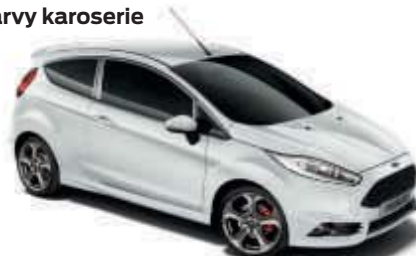
Bílá Frozen Nemetalická barva*