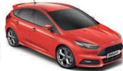
Červená Race Nemetalická barva