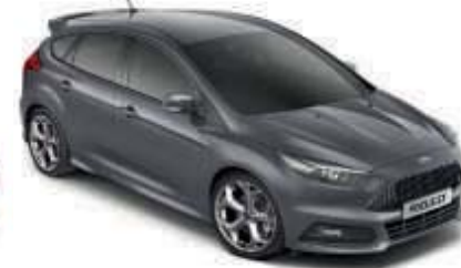
Šedá Stealth Nemetalická barva*