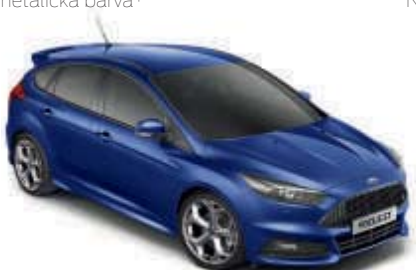
Modrá Deep Impact Metalická barva*