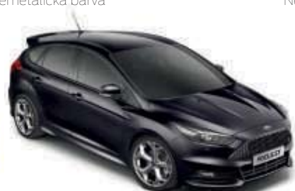
Černá Panther® Metalická barva*