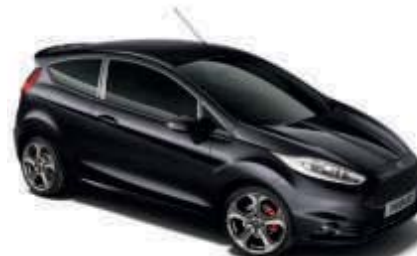
Černá Panther® Metalická barva*