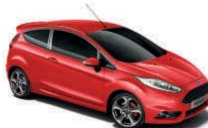
Červená Race Nemetalická barva