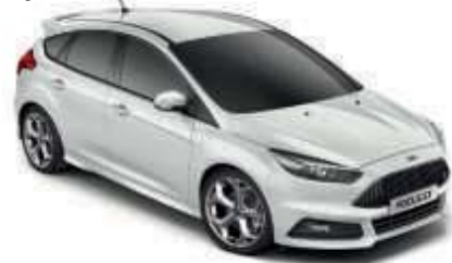
Bílá Frozen Nemetalická barva*