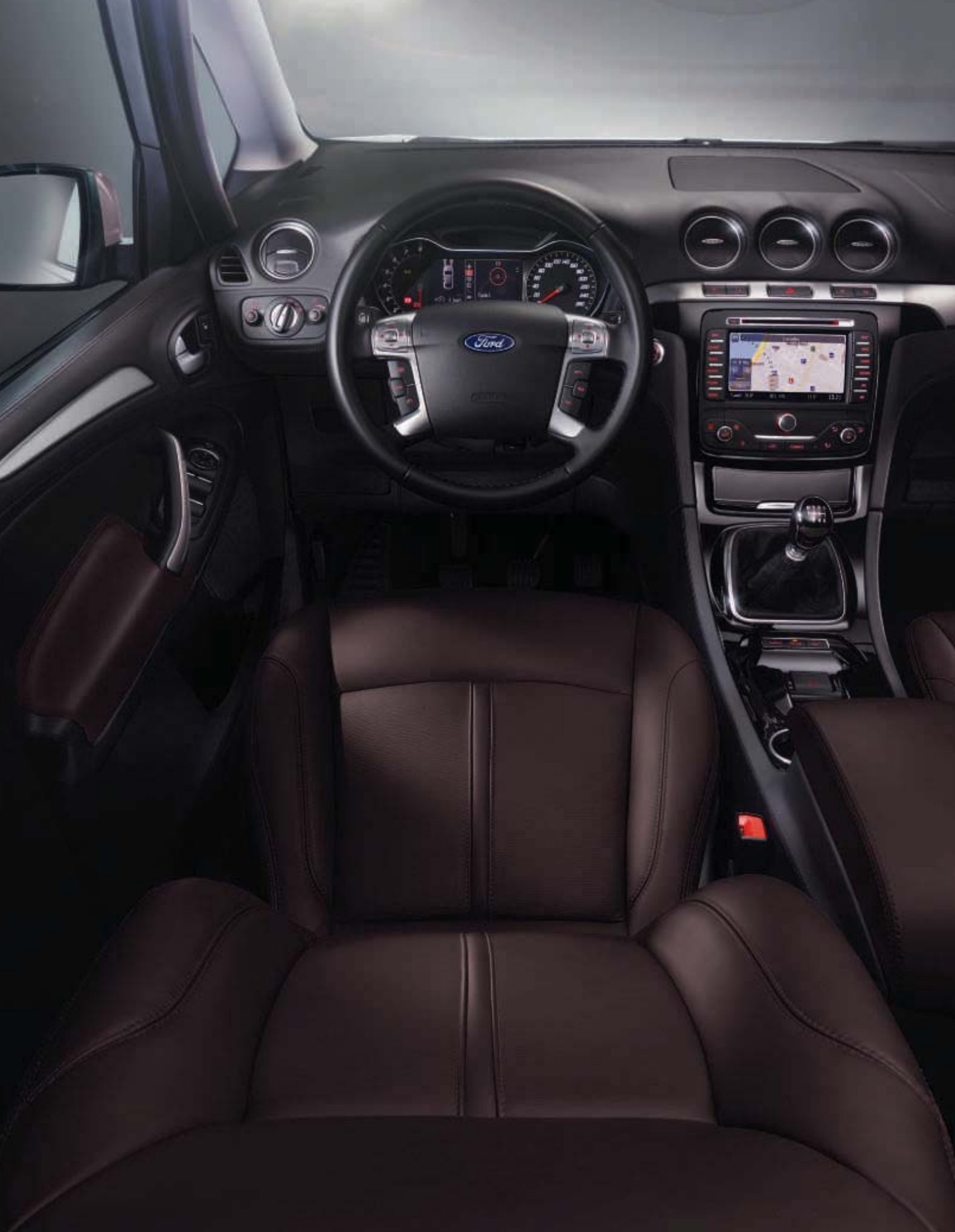
Von Luxus umgeben Der mit viel Liebe zum Detail gestaltete Innenraum ist mit hochwertigem Leder ausgestattet (Abbildung zeigt Lederpolsterung in Braun).

Die exquisiten Capretto-Ledersitze bieten sowohl hohen Komfort als auch Seitenhalt und harmonisieren perfekt mit den hochwertigen Dekorelementen. (Abbildung zeigt Lederpolsterung in Anthrazit)