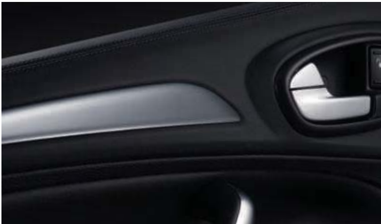
Obere Türeinsätze in Windsor-Leder