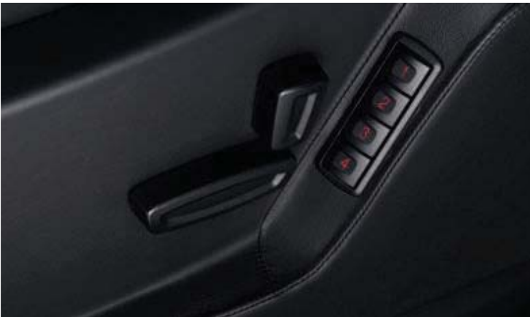
Fahrsitz, 8fach elektrisch einstellbar mit Memory-Funktion (Wunschausstattung)