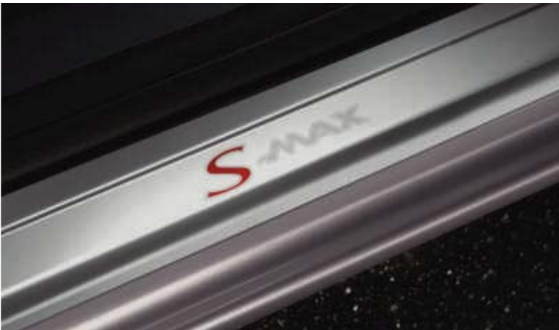
Einstiegszierleisten mit „S-MAX“-Schriftzug vorn und hinten