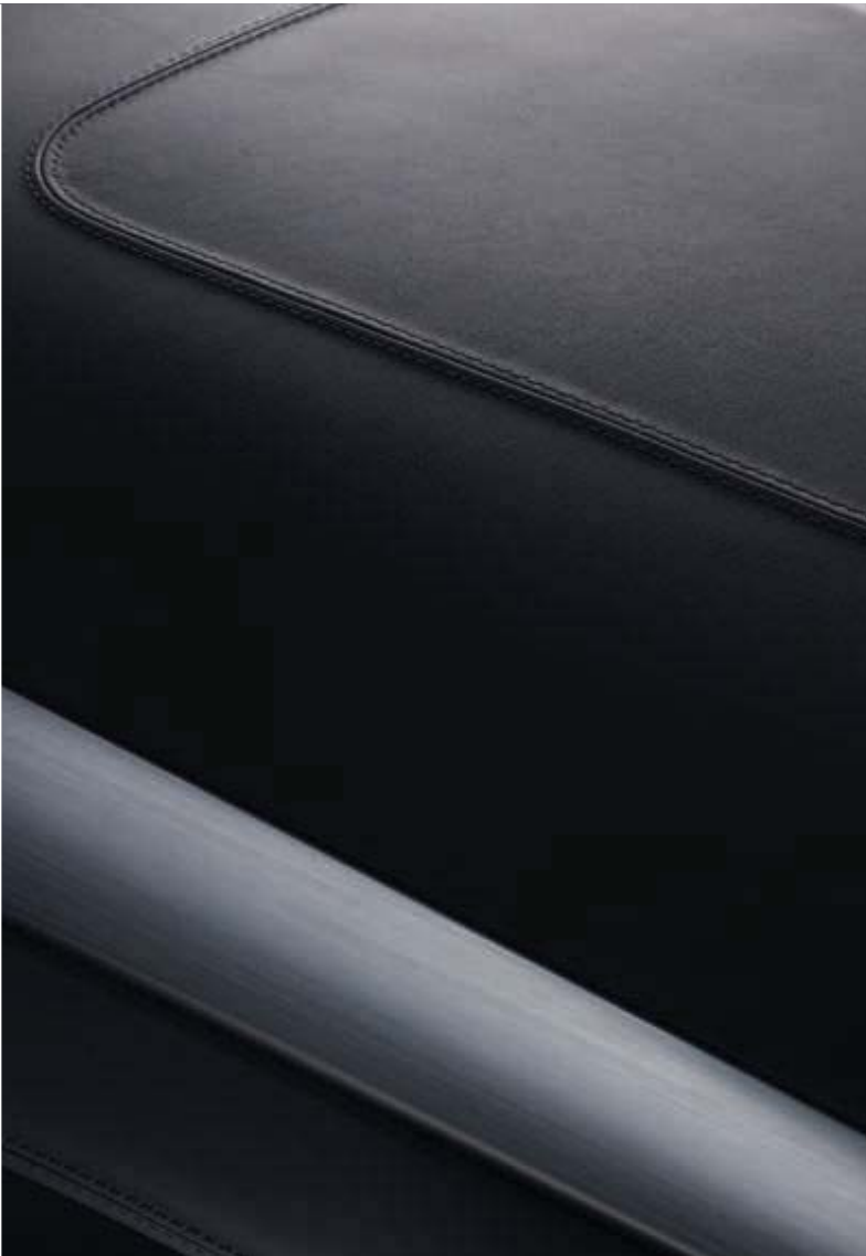
Luxuriöser lederbezogener Armaturenräger Windsor-Leder in Anthrazit mit Styling-Elementen aus gebürstetem Aluminium