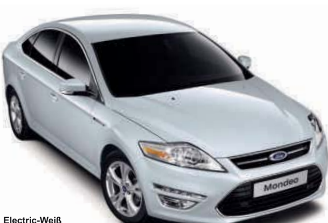
Electric-Weiß Metallic* (spezielle Metallic-Lackierung)