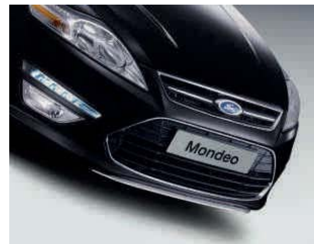
Abbildung rechts zeigt Stoßfängeraufsatz „Style“ vorn (auch für hinten erhältlich) in Kontrastfarbe (Zubehör)

Alle Ausstattungsmerkmale mit Ausnahme der Nebelscheinwerfer und der LED-Tagfahrleuchten sind auch als Zubehör erhältlich.