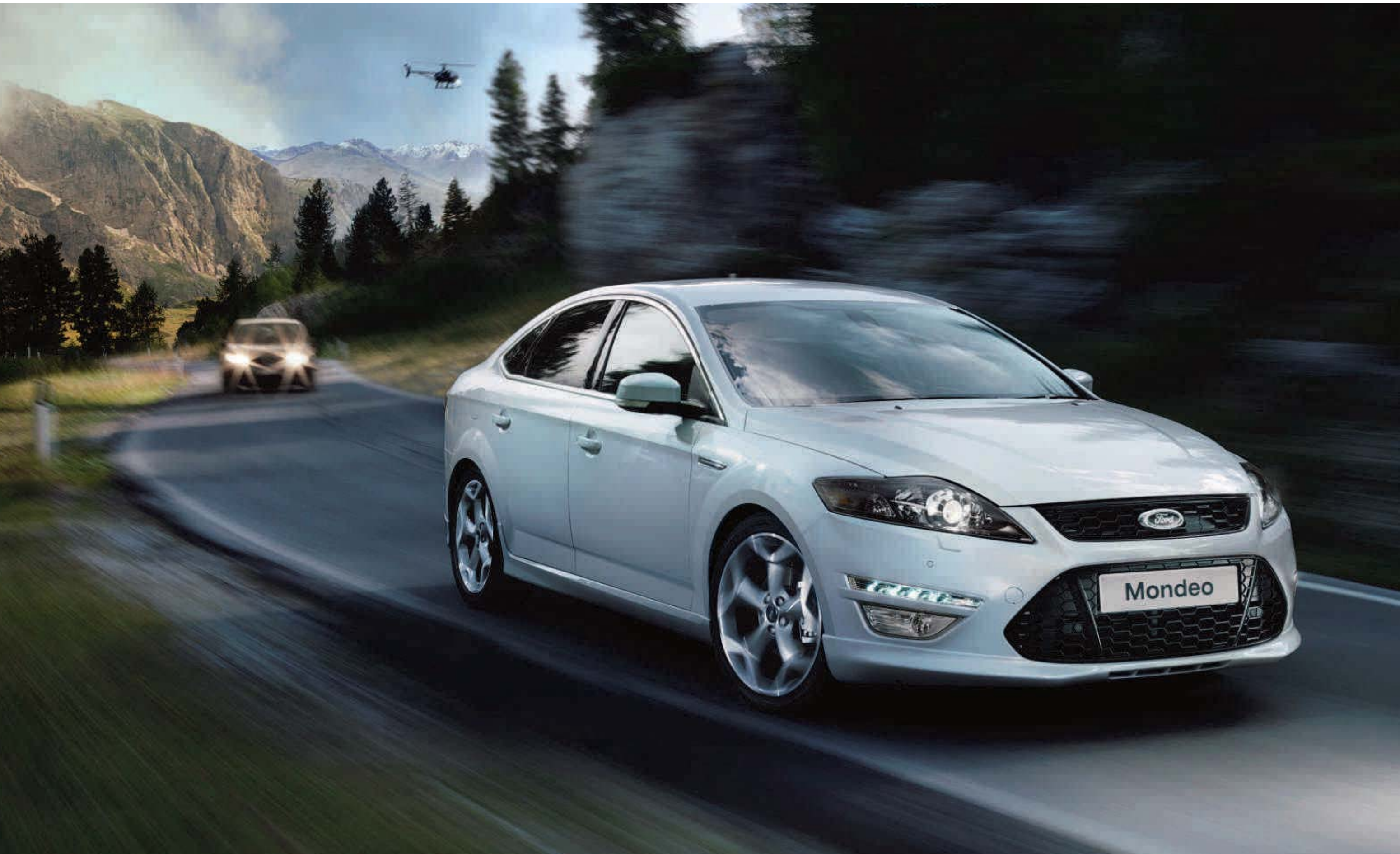
Abbildung zeigt Ford Mondeo Titanium S in Electric-Weiß Metallic (Wunschausstattung) mit 19"-Leichtmetallrädern im 5-Speichen-Y-Design (Wunschausstattung und Zubehör) sowie Ford Mondeo Individual-Styling-Paket (optional für Trend, serienmäßig für Titanium S).

Mit der richtigen Ausrüstung hält man seine Verfolger immer auf Distanz.