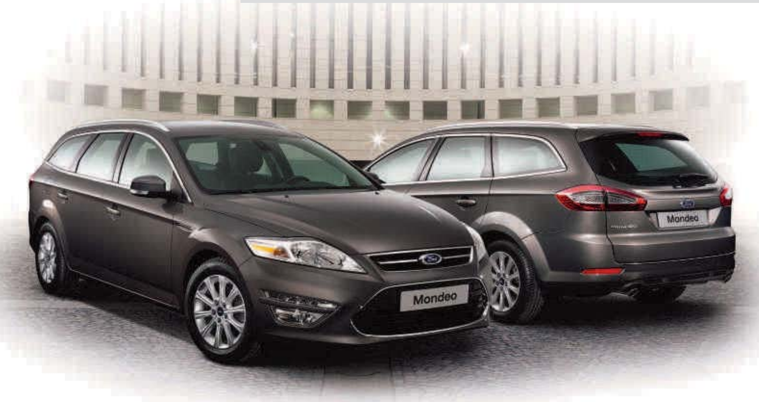
Abbildung oben zeigt Ford Mondeo Trend in Brisbane-Braun Metallic (Wunschausstattung)