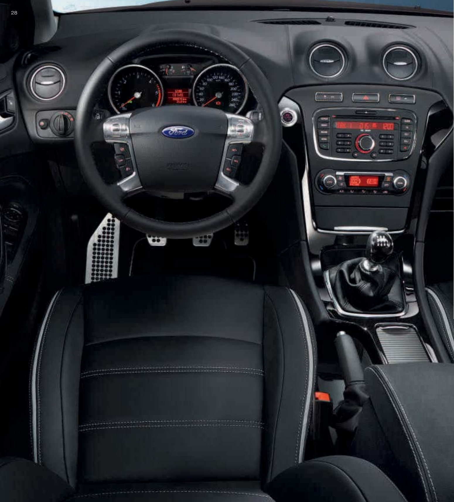
Abbildung oben zeigt Ford Mondeo Titanium in Brisbane-Braun Metallic (Wunschausstattung). Abbildung links zeigt Innenraum des Ford Mondeo Titanium mit Wunschausstattung.