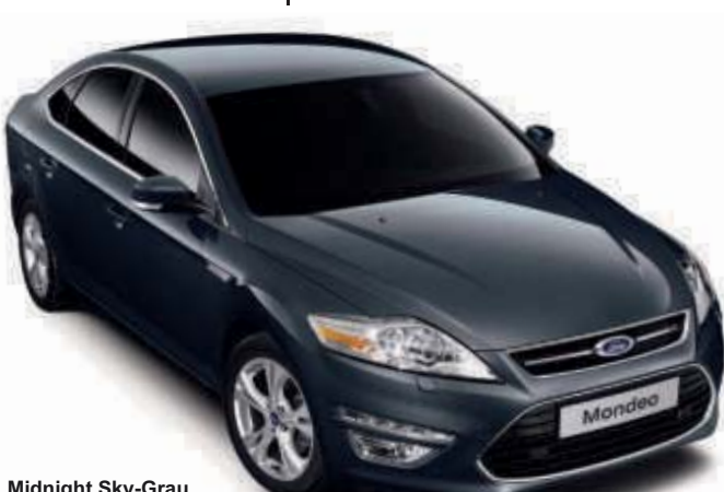
Midnight Sky-Grau Metallic*