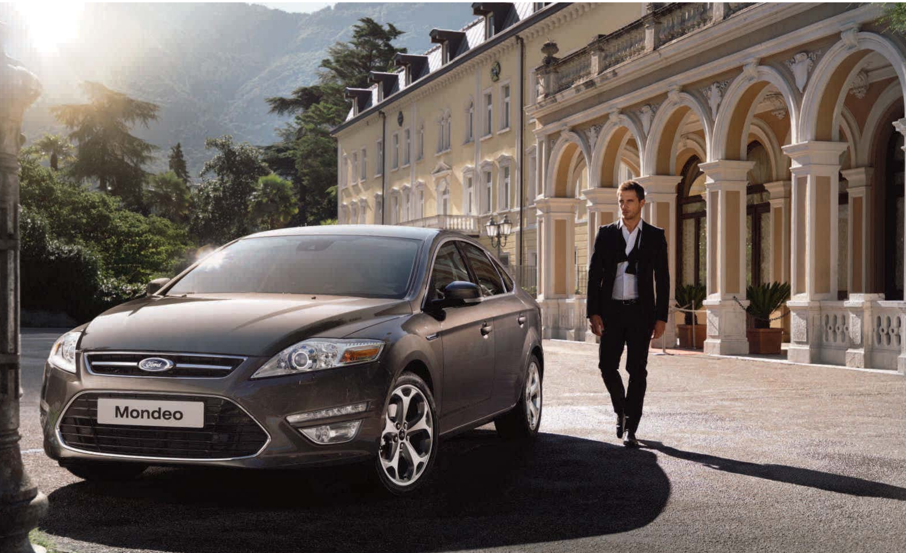
Abbildung zeigt Ford Mondeo Trend (5-Türer) in Brisbane-Braun Metallic (Wunschausstattung) mit 18"-Leichtmetallrädern im 5-Speichen-Y-Design (Wunschausstattung und Zubehör), LED-Tagfahrlicht, Chrom-Dekor, Umrandung der Seitenscheiben sowie Außenspiegeln mit integrierten Blinkleuchten und weiterer Wunschausstattung.

Ich bevorzuge Luxus, Komfort und Sportlichkeit. Genau dies spiegelt sich auch in meiner Fahrzeugwahl wider.