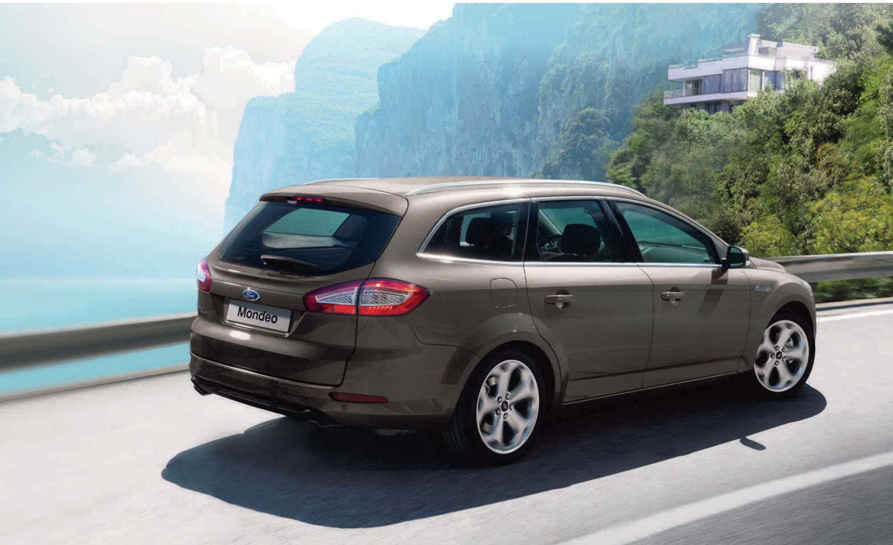
Abbildung zeigt Ford Mondeo Trend Turnier in Brisbane-Braun Metallic (Wunschausstattung) mit 18"-Leichtmetallrädern im 5-Speichen-Y-Design (Wunschausstattung und Zubehör), Dachreling im „Aluminium-Look“, Chrom-Dekor-Umrandung der Seitenscheiben, LED-Rückleuchten und Diversity-Antenne (integriert in die Seitenscheiben)

Das Schönste für einen Gipfelstürmer ist das Bewusstsein, dass schon der nächste Berg auf ihn wartet.