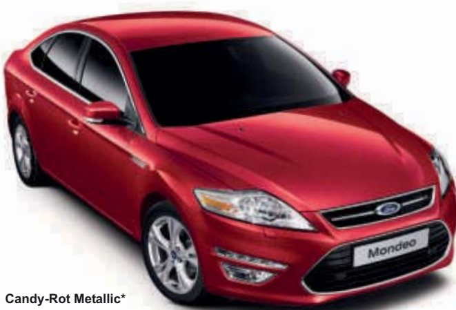
Candy-Rot Metallic* (spezielle Metallic-Lackierung)