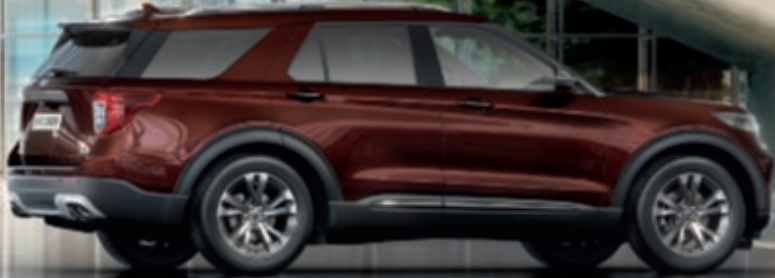
Explorer Platinum en color de la carrocería Bronce Copper metalizado con barniz tintado (opción) con llantas de 20" y 5x2 radios con acabado mecanizado y huecos en Dark Tarnish (de serie).

Escanea los códigos QR para acceder al contenido adicional