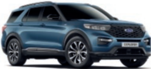
Azul Metallic Color metalizado de la carrocería*