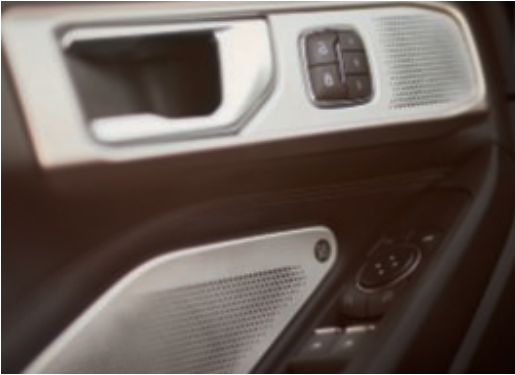
Sistema de sonido B&O con 12 altavoces y 1 altavoz de graves.