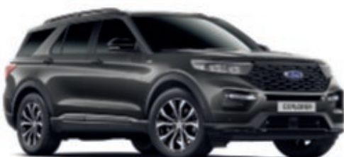
Gris Magnetic Color metalizado de la carrocería*