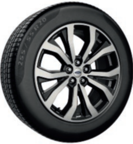
20" Llantas de 5x2 radios con acabado mecanizado y huecos en negro de alto brillo (De serie en ST-Line)

Nada complementa mejor el estilo impresionante del nuevo Explorer híbrido enchufable que el bonito diseño de sus llantas de aleación.