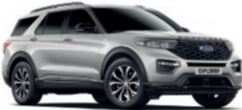
Plata Iconic Color metalizado de la carrocería*