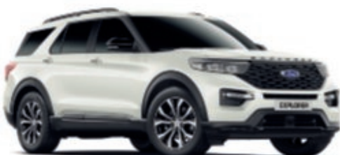
Blanca Star Color metalizado tricapa*