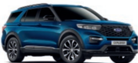
Azul Atlas Color metalizado de la carrocería*