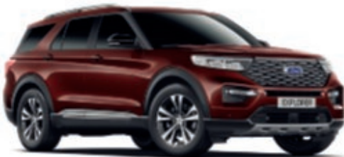
Bronce Copper (No disponible) Color metalizado con revestimiento transparente*