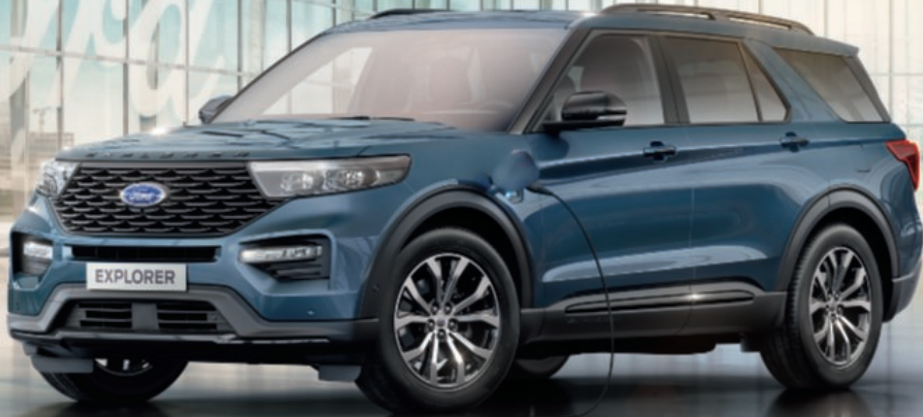
Explorer ST-Line en color de la carrocería Azul Chrome metalizado (opción) con llantas de 20" y 5x2 radios con acabado mecanizado y huecos negros de alto brillo (de serie).