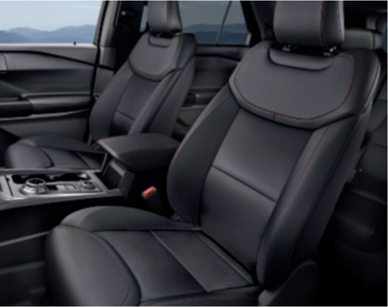
Cuero Salerno en Ebony con microperforaciones perfeccionadas y costuras con detalles en rojo (De serie en ST-Line)

La sofisticación y la artesanía se aúnan maravillosamente en el nuevo Ford Explorer. El aspecto y el tacto de los materiales de primera calidad te harán valorar más su interior de amplias proporciones, tanto si viajas de pasajero como de conductor.