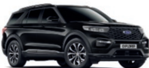
Negro Agate Color metalizado de la carrocería*