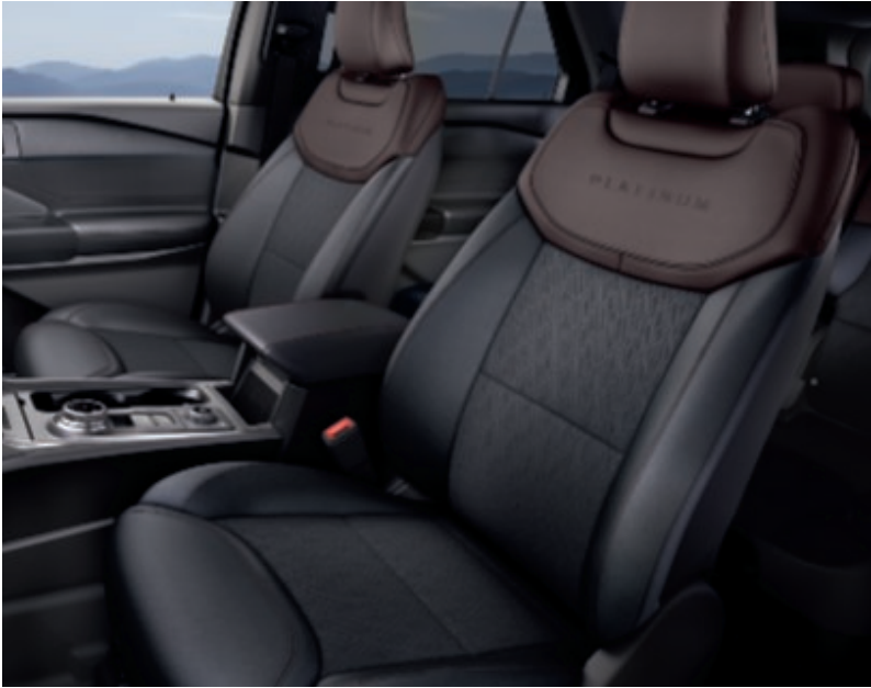
Cuero Geneva en Ebony, con perforaciones en Triangle Diamond y partes superiores en Brunello (No disponible) (De serie en Platinum)