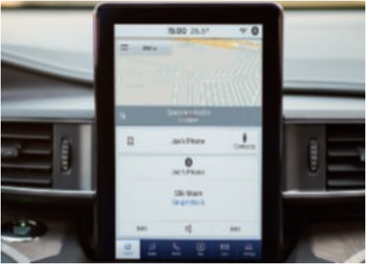
Pantalla táctil TFT LCD de 12,3", estilo vertical.