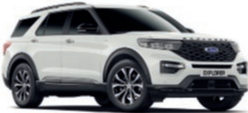
Blanco Oxford † Color sólido de la carrocería