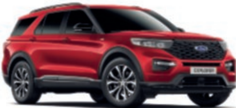
Rojo Lucid Color metalizado con revestimiento transparente*