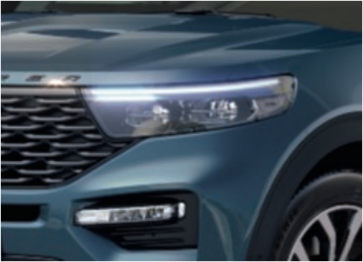
Faros LED con tratamiento de camuflaje deportivo.