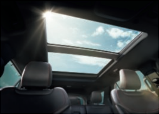
Techo panorámico eléctrico de dos paneles.