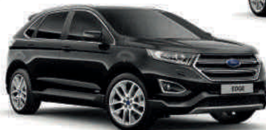
Černá Shadow Mica lak karoserie* Td T ST V