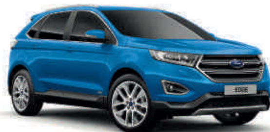
Modrá Lightning Metalický lak karoserie* Td T ST

Zvolili jsme barvu modrá Metallic. Pro jakou se rozhodnete vy?