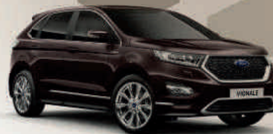
Fialová Ametista* Unikátní metalický lak karoserie* V