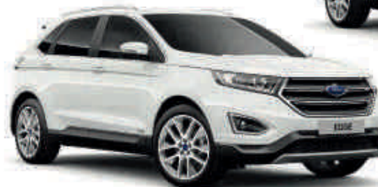
Bílá Oxford Nemetalický lak karoserie Td T ST