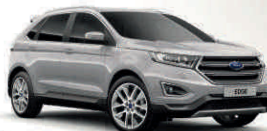
Stříbrná Ingot Metalický lak karoserie* Td T ST