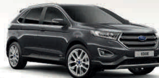
Šedá Magnetic Metalický lak karoserie* Td T V