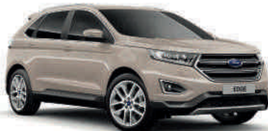
Bílá Gold Metalický lak karoserie* Td T