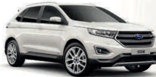
Bílá Platinum Unikátní metalický lak karoserie* Td T ST V

Td Trend T Titanium ST ST-Line V Vignale Standardní výbava Výbava na přání,