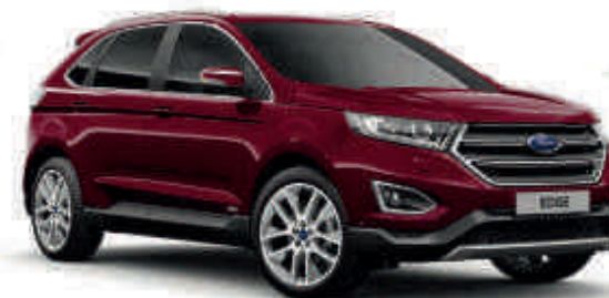
Červená Burgundy Speciální metalický lak karoserie (3vrstvý)* Td T ST

Nové vozy Ford Edge vděčí za svůj oslnivý a odolný zevnějšek speciálnímu několikafázovému procesu lakování. Díky vstřikování vosku do ocelových částí karoserie či ochranné horní vrstvě nátěru, novým materiálům a postupům aplikace bude váš Ford Edge vypadat perfektně i za mnoho let.