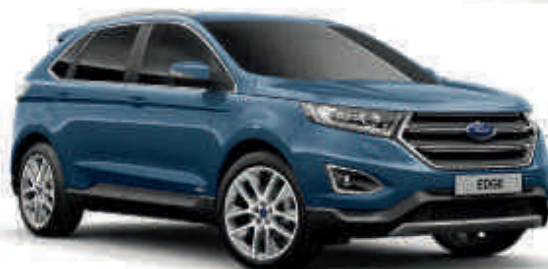
Blue Metallic Metalický lak karoserie* Td T ST