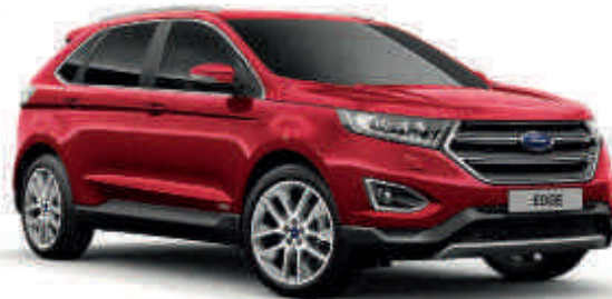
Červená Ruby Speciální metalický lak karoserie (3vrstvý)* Td T ST