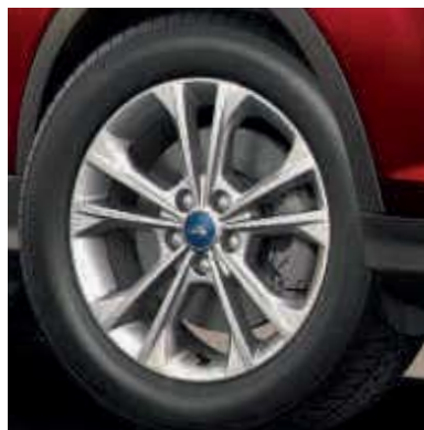
● Llantas de aleación de 17".