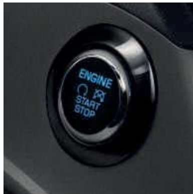
● Arranque sin llave.