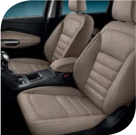
Tapicería de cuero en Cuero Beige