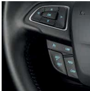
● Sistema de control de velocidad con limitador de velocidad ajustable.