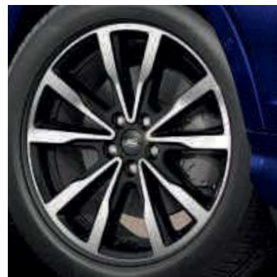
● Llantas de aleación exclusivas de 18".