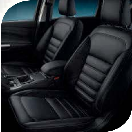
Tapicería de cuero en Negro Charcoal