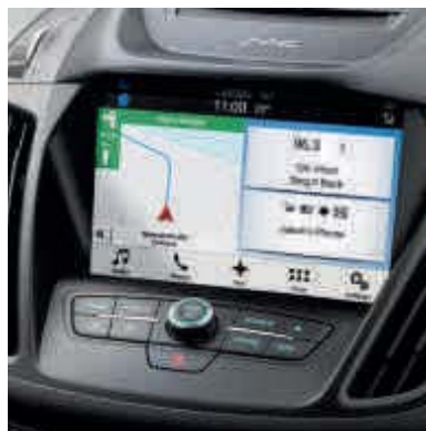
● Ford SYNC 3 con control por voz y pantalla táctil de 8".