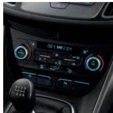
● Climatizador bizona.