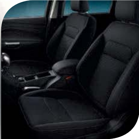
Tapicería de tela en Negro Charcoal