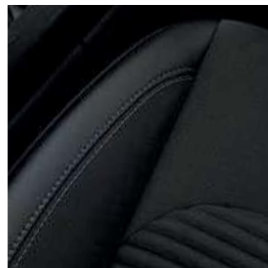
● Asientos parcialmente en cuero.