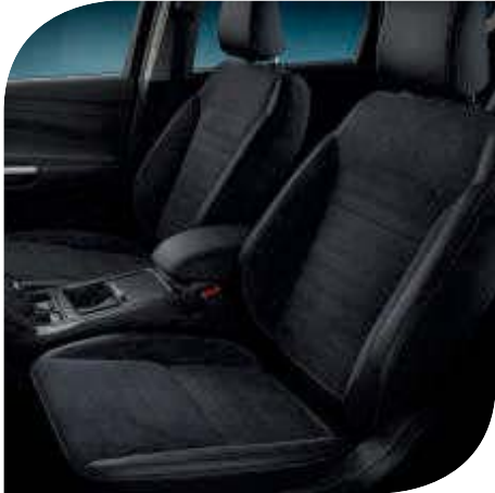
Tapicería de cuero parcial con Alcántara en Ebony y Negro Charcoal