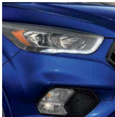
● Embellecedores de faros en black.