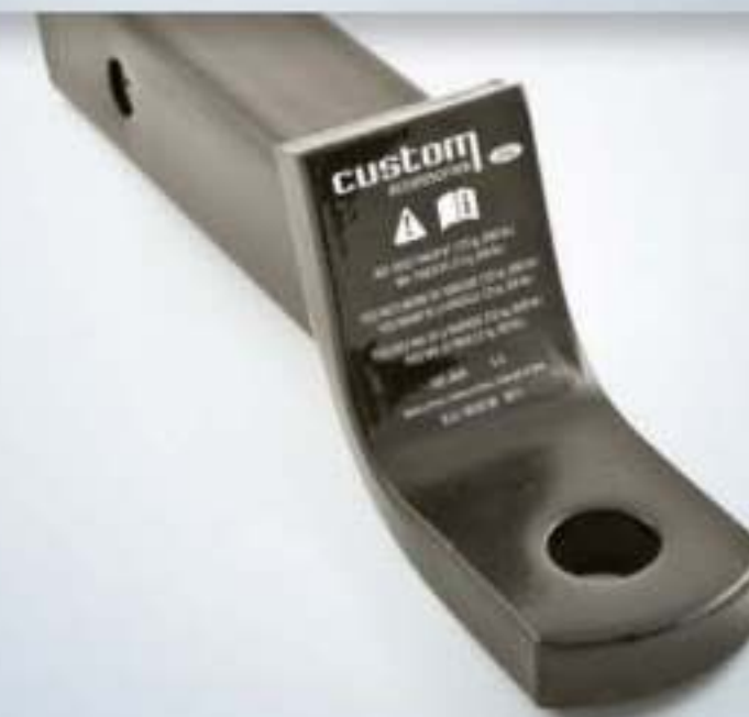
BARRA DE ARRASTRE

Las imágenes son meramente ilustrativas. Los accesorios mostrados en el presente catálogo pueden tener cambios posteriores a su publicación en: especificaciones técnicas, descripciones, números de parte, incorporación de opciones, requerimientos de ordenamiento o pudieran existir limitaciones de disponibilidad. Ford Motor Company se reserva el derecho de modificar en sus productos opciones de equipamiento y combinaciones de accesorios en cualquier momento, sin incurrir en responsabilidad alguna. Consulte a su Distribuidor Ford más cercano para obtener información actualizada.