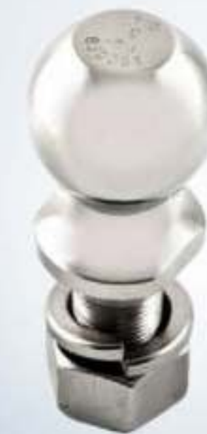
BOLA DE ARRASTRE