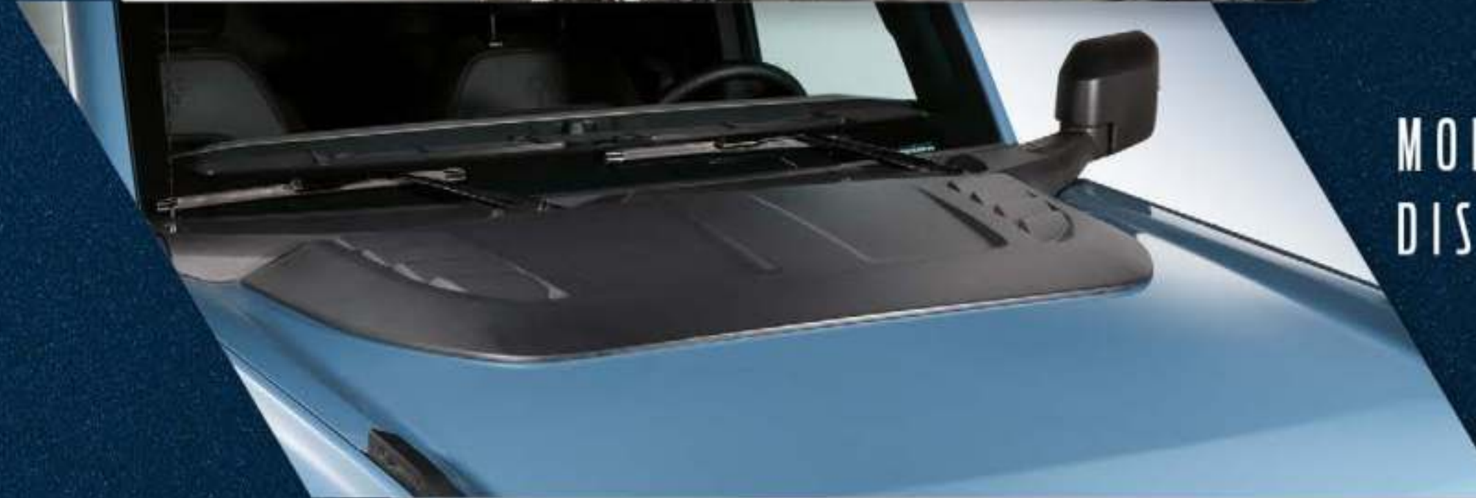
MOLDURA DECORATIVA CON DISEÑO DE TOMA DE AIRE