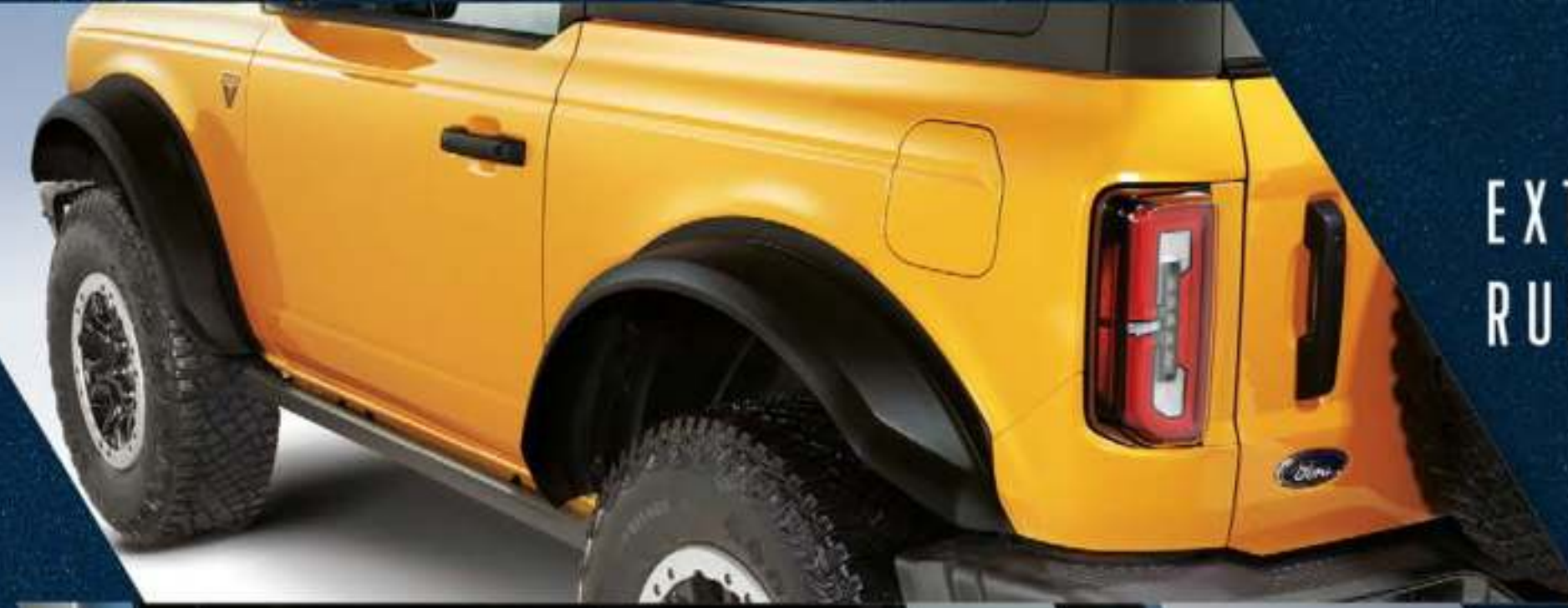
EXTENSIONES DE ARCOS DE RUEDA (FENDER FLARES)