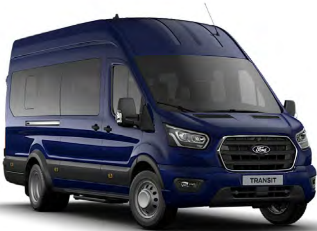
Bleu Abyssse Peinture non métallisée