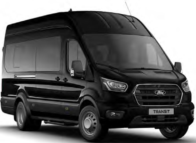
Noir Agate Peinture métallisée*