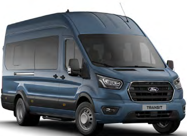
Bleu Azur Peinture métallisée*