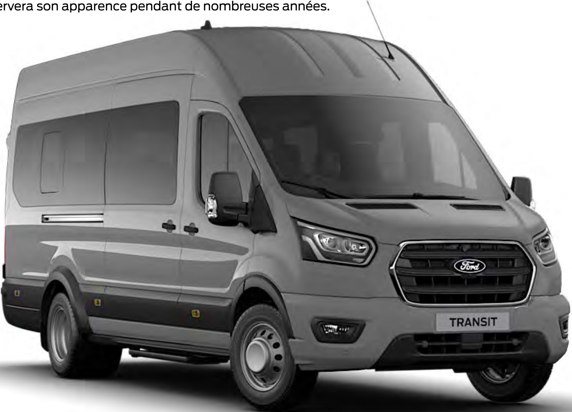
Gris Matter Peinture spéciale non métallisée*

Le Ford Transit Minicar doit la durabilité de sa peinture à un processus en plusieurs étapes, contribuant à garantir que votre nouveau véhicule conservera son apparence pendant de nombreuses années.