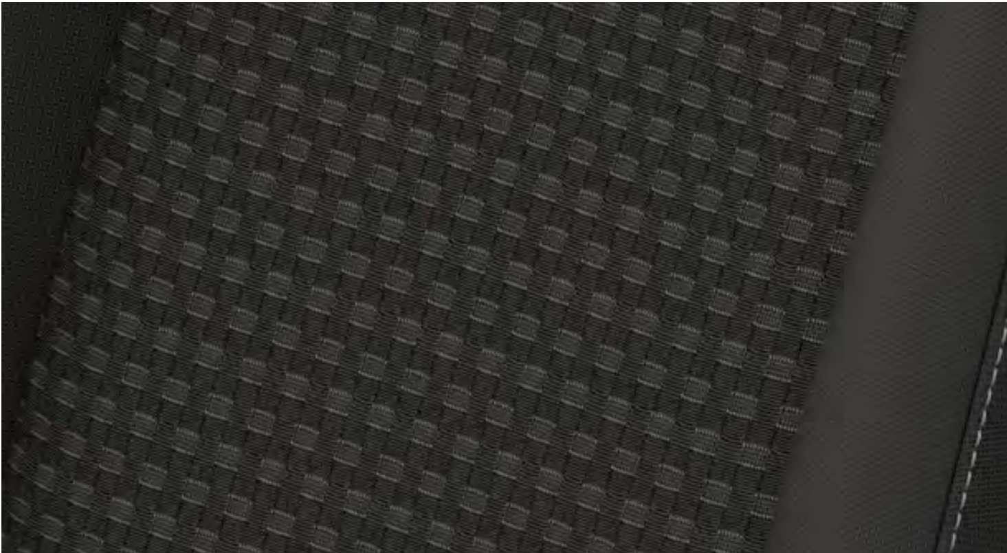
Assise de siège en tissu Capitol, coloris Ebony et rembourrage latéral en tissu City, coloris Ebony De série sur Trend/Limited