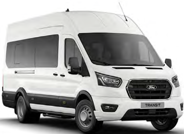
Blanc Glacier Peinture non métallisée