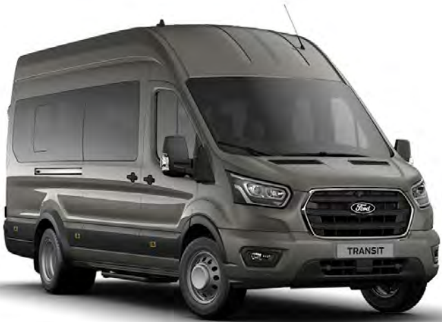
Gris Magnetic Peinture métallisée*