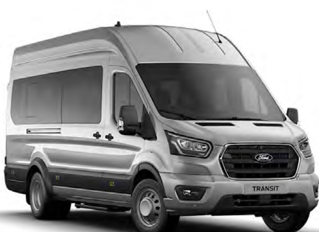
Gris Lunaire Peinture métallisée*