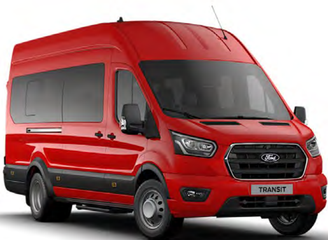
Rouge Racing Peinture non métallisée

Remarque : Les images utilisées visent à illustrer les teintes de carrosserie et peuvent ne pas être représentatives du véhicule décrit. Les peintures et garnissages reproduits dans cette brochure peuvent être différents des couleurs réelles du fait des limitations des processus d'impression utilisés.