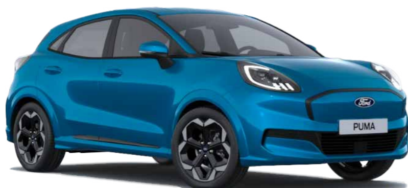
Digital Aqua Blue