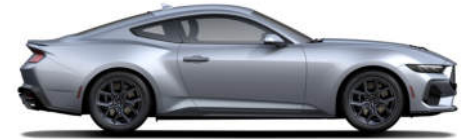
4 Iconic Silver Metallic