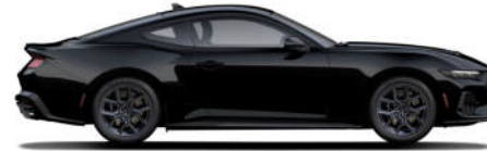
3 Shadow Black