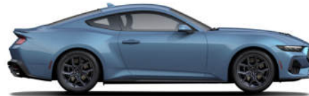
6 Vapor Blue Metallic