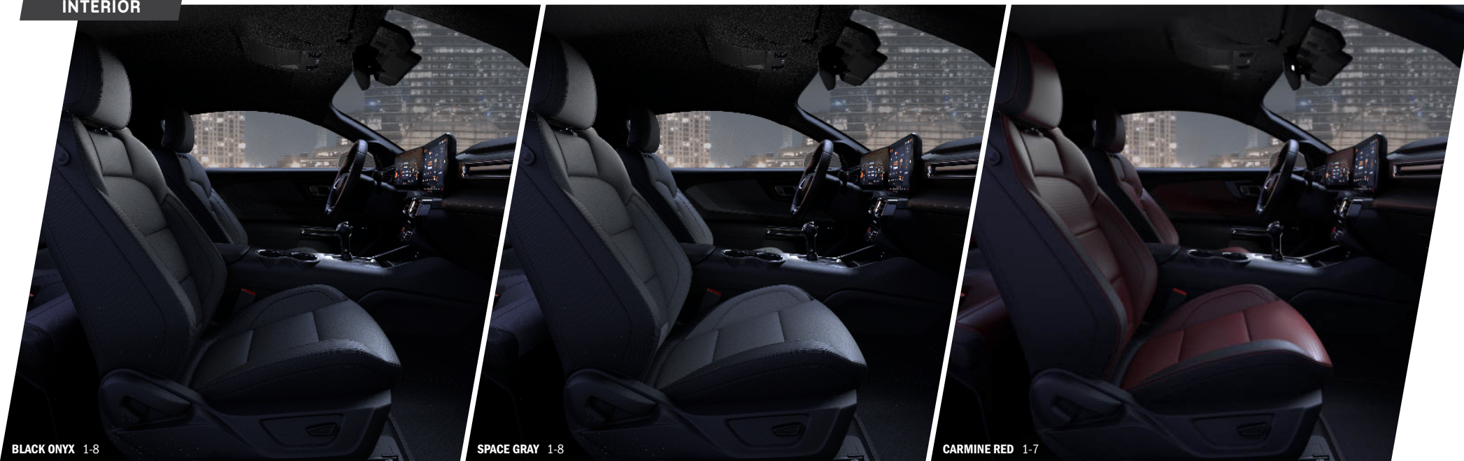
BLACK ONYX 1-8