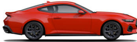
2 Race Red