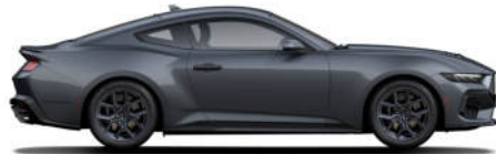
5 Carbonized Gray Metallic