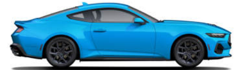
8 Grabber Blue Metallic

상기 외장 컬러는 참고용이며 선택 가능한 색상은 표기된 바와 다를 수 있습니다. 일부 색상은 공급이 제한될 수 있습니다. 본 카탈로그의 사진이나 사양 관련 정보는 국내 판매 모델과 다를 수 있습니다. 정확한 정보는 가까운 딜러를 통해 확인하시기 바랍니다.