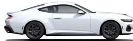
7 Oxford White