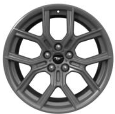
19인치 알루미늄 휠 EcoBoost Premium wheel

Mustang EcoBoost® Premium은 2.3L EcoBoost® 엔진과 10단 변속기가 잘 조화를 이루어 일반 주행은 물론 고속 주행에서도 Mustang 특유의 드라이빙 경험을 제공해 드립니다.