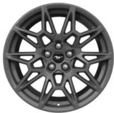
19인치 알루미늄 휠 GT Premium wheel

2025 Mustang GT Premium에 장착된 5.0L Ti-VCT V8 엔진에서 뿜어내는 고성능 퍼포먼스를 체험해 보십시오. Mustang GT Premium에는 Magneride® Damping system 등 고성능 주행에 최적화된 장치들이 포함되어 있습니다.