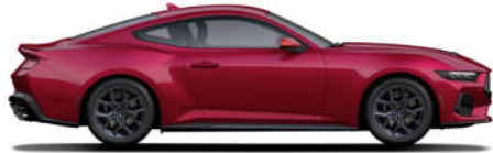
1 Molten Magenta Metallic Tri-Coat