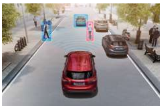
PCA 前向碰撞預警系統 (附 AEB 全速域輔助煞停系統)