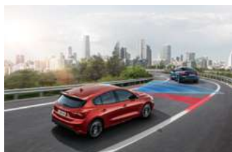
iACC 智慧型定速巡航調節系統 (附低速跟車)

NEW FORD FOCUS ST 採用最新升級的 Ford Co-Pilot360™ 全方位智駕科技輔助系統，整合多項傲視同級的駕駛輔助科技，打造前向、側邊、後向全方位智能安全。全新導入的進階駕駛輔助科技，替已臻頂尖的主動安全，強上加強，打造最稱心的行駛路程，和最雄心的熱血里程。