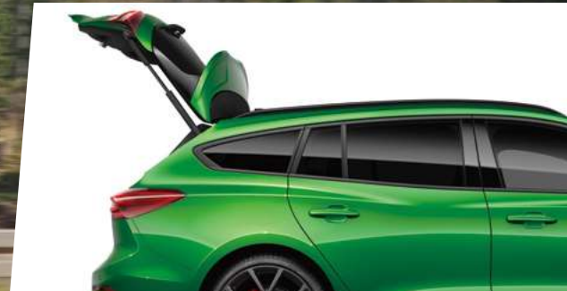
Hands-Free 足踢感應式電動尾門