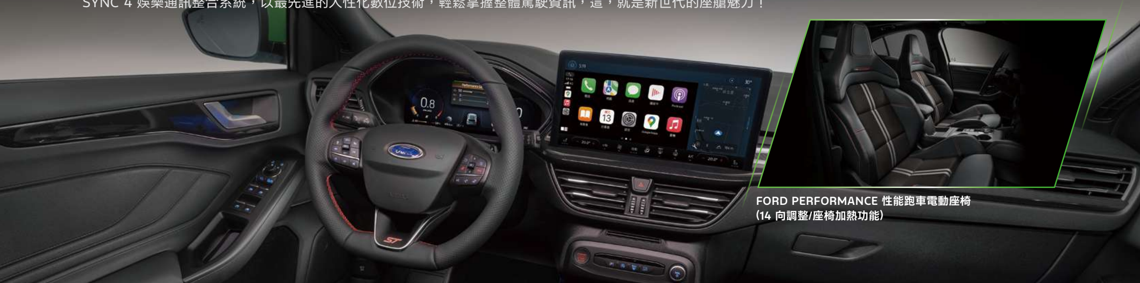
FORD PERFORMANCE 性能跑車電動座椅 (14 向調整/座椅加熱功能)

全新世代科技性能座艙設計，搭載 FORD PERFORMANCE 性能跑車電動座椅，榮獲德國背脊健康組織 (AGR) 認證，在享受性能駕馭的同時，也能擁有細膩舒適的乘坐感受。座艙科技升級搭載全新世代無線連接技術 13.2 吋 SYNC®4 娛樂通訊整合系統，以最先進的人性化數位技術，輕鬆掌握整體駕駛資訊，這，就是新世代的座艙魅力！