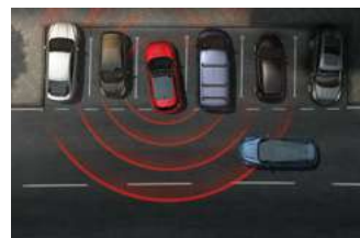
CTA 倒車警示與輔助煞停系統

* SYNC®4 娛樂通訊整合系統功能所提供的各項內容，可能依你使用的手機型號、作業系統版本及所在的國家 / 地區不同而受限，詳細說明請參閱各項功能手冊。* 原廠中文衛星導航系統為 SYNC®4 所內建導航系統，詳情請參見車主手冊。* Android Auto™ 與大部分搭載 Android 5.0 以上之裝置相容，建議至 Google Play 下載 Android Auto™ 最新版本。* Apple CarPlay™ 需搭載 iOS 7.1 以上之 iPhone 機型。建議更新至最新 iOS 版本。Apple CarPlay™ 為 Apple Inc. 的商標。* Apple CarPlay™ 和 Android Auto™ 啟動時，會停用部分 SYNC®4 娛樂通訊整合系統功能。* Ford Co-Pilot360™ 全方位智駕科技輔助系統 (Level 2 駕駛輔助系統)：為輔助駕駛科技，非全自動駕駛科技，各項功能均有作動條件限制，請勿仰賴此系統取代駕駛判斷。該系統可能在繁忙行車、彎道、山路、隧道之一般道路、行車速度緩慢、與前方車距過短，或是天候異對雷達造成干擾 (如下雨、陽光過強) 等狀況下，皆有可能影響系統運作狀態，詳細限制請參見車主手冊。iACC 智慧型定速巡航調節系統係 ACC Stop & Go 結合 TSR 道路標誌識別輔助系統與導航圖資之系統 (手排車型無 Stop & Go 功能)；系統功能均有作動條件限制，亦有可能出現判斷落差，請勿仰賴此系統取代駕駛判斷，其限制請參見車主手冊。Level 2 駕駛輔助系統係依據 SAE International 所發布的標準而定，其符合標準功能包含 ACC Stop & Go 全速域定速巡航調節系統 (附低速跟車) 結合 LCA 車道導正輔助功能。* ACC Stop & Go 全速域定速巡航調節系統及 LCA 車道導正輔助系統：透過系統輔助控制車輪油門、轉向和煞車，並依據前車動態狀況調節駕駛跟車狀態，並使車輛在特定的狀況下保持於車道中線。請勿於包括但不限於以下情境使用：上下高速公路、十字路口、過度彎曲道路、上下坡或濕滑路面等複雜路段或能見度不良時使用該系統，駕駛仍有責任依據實際路況採取不同的駕駛反應。* ACC Stop & Go 於作動速域內輔助駕駛定速並跟隨前向動態車流跟車至停 (Stop) 及停車再開 (Go)，其跟車至停功能並非 AEB 功能，駕駛務必根據需求踩下煞車。LCA 輔助功能必須啟動 ACC Stop & Go 功能後才可開啟。LCA 輔助功能於無道路標線 / 過度彎曲道路 / 陡坡 / 過寬或過窄的道路等特殊路況下，將會影響其作動狀態，駕駛仍有責任依據實際路況採取不同的駕駛反應。* AEB 於偵測速域範圍內輔助煞車力道減緩碰撞傷害，並非完全避免所有碰撞，複雜路段、胎圈型式、急加速、速差等變因將影響煞車力道。駕駛仍須與前車車尾保持適當距離與車速，切勿依賴系統取代人為判斷。* 手排車型無搭載 Stop & Go 功能，其定速巡航系統需於時速 30km/h 以上啟用且檔位不得置於一檔。當系統判斷需升降檔時，將會透過檔位指示燈提示駕駛者。* 此為展示車型，外觀樣式及內裝配備與實際上市車型有所差異，請以實際販售之車型及規格配備表為準。