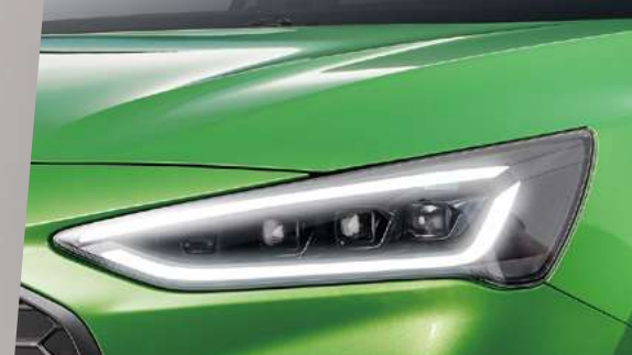
FORD MATRIX LED 矩陣式智能動態照明系統

FORD PERFORMANCE 性能團隊全新力作，NEW FORD FOCUS ST 全車系熱血進化。搭載 2.3L EcoBoost® 雙渦流渦輪增壓引擎，坐擁 280ps 強悍動力，0-100 km/h 加速僅需 5.7 秒的極速快感，打造絕對性能駕馭樂趣；並導入全新標誌性外觀設計，為純正的熱血基底，添上更順暢的座艙操控體驗。