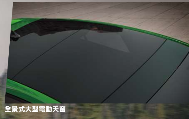
全景式大型電動天窗