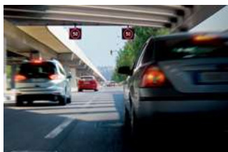
ISA 智慧型速限輔助系統 TSR 道路標誌識別輔助系統