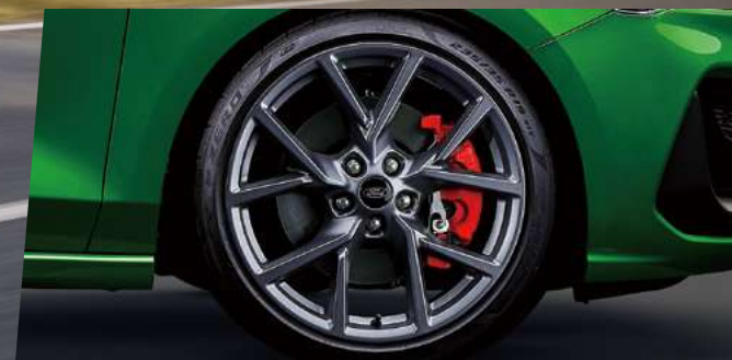
19 吋 Pirelli P ZERO™ 高性能跑胎