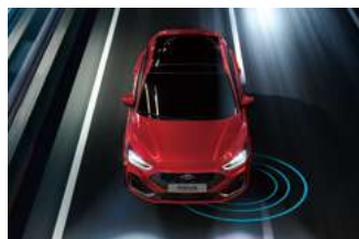
BSA 視覺盲點偵測與輔助系統