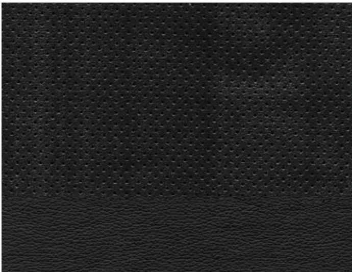
Black Onyx Leather Trim Platinum®