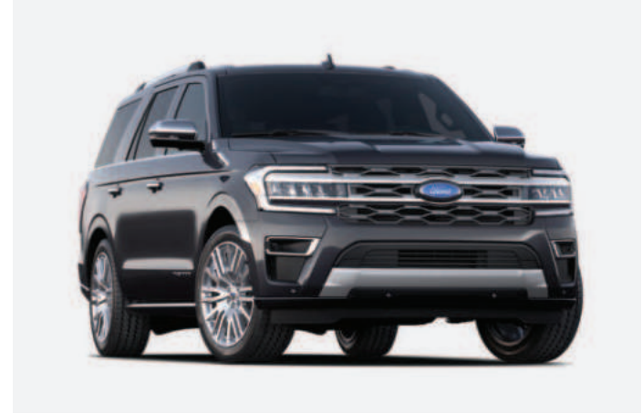
3 Dark Matter Gray Metallic