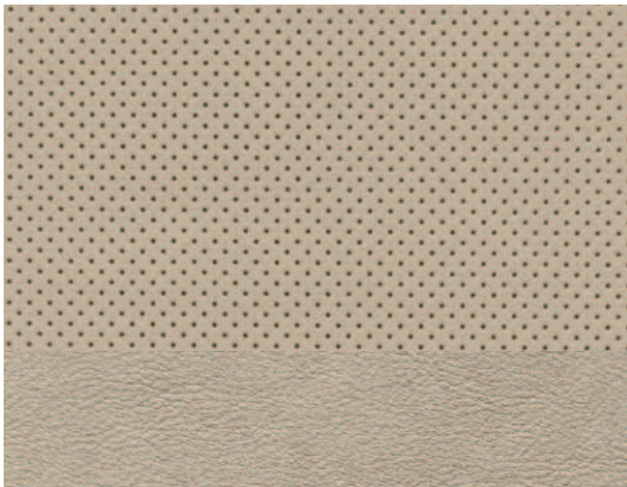
Light Sandstone Leather Trim Platinum