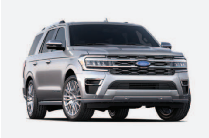
1 Iconic Silver Metallic