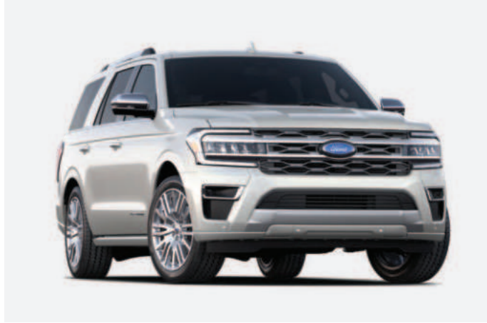
2 Star White Tri-Coat