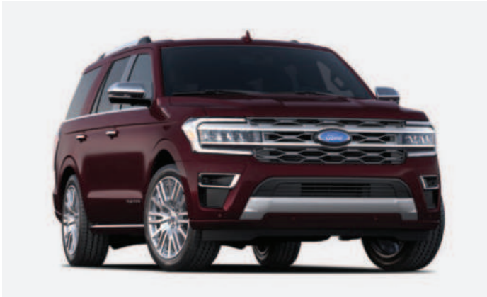
4 Jewel Red Metallic Tinted Clearcoat