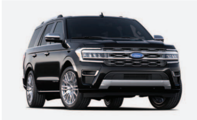
5 Agata Black Metallic

상기 외장 컬러는 참고용이며 선택 가능한 색상은 표기된 바와 다를 수 있습니다. 일부 색상은 공급이 제한될 수 있습니다. 본 카탈로그의 사진이나 사양 관련 정보는 국내 판매 모델과 다를 수 있습니다. 정확한 정보는 가까운 딜러를 통해 확인하시기 바랍니다.