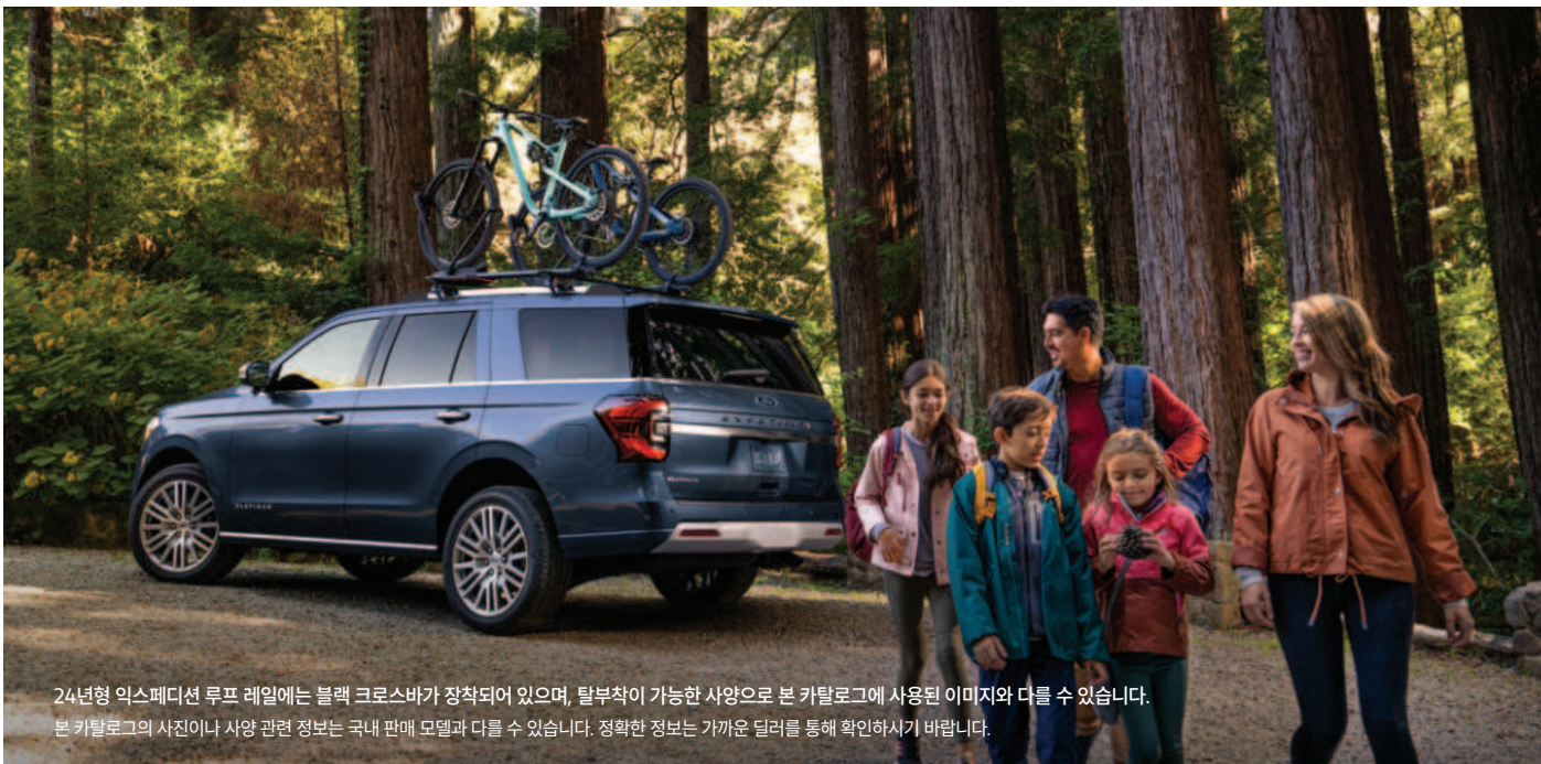
24년형 익스페디션 루프 레일에는 블랙 크로스바가 장착되어 있으며, 탈부착이 가능한 사양으로 본 카탈로그에 사용된 이미지와 다를 수 있습니다. 본 카탈로그의 사진이나 사양 관련 정보는 국내 판매 모델과 다를 수 있습니다. 정확한 정보는 가까운 딜러를 통해 확인하시기 바랍니다.