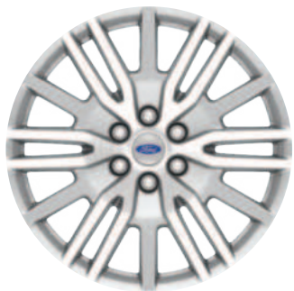
22" Polished Aluminum Wheel