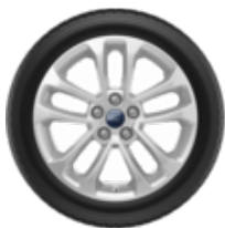
Leichtmetall-Winterkomplett 17" 5 x 2-Speichen-Design, Shadow Silver 7J x 17 ET 50, Dunlop WINTER SPORT 5 SUV, 225/65 R17 106H XL, Kennzeichnung für Reifeneigenschaften nach EU-Verordnung Nr. 2020/740 – Mit Reifendruckkontrollsensoren. Schneekettenfähig, die Kettenfähigkeit kann von den Felgenabmessungen abhängig sein.