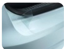
Heckstoßfängerschutz - Ladekantenschutz, Folie transparent Sehr dünne und zugleich äußerst widerstandsfähige Folie, die den Heckstoßfänger und die Ladekante Ihres Fahrzeugs vor Kratzern beim Be- und Entladen schützt. Fügt sich dank der modellspezifischen, passgenauen Form, der hohen Transparenz und geringen Dicke nahtlos und nahezu unsichtbar in das Heck-Design des Fahrzeugs ein. Langlebig, keine Gelbfärbung. Bedeckt für noch besseren Schutz auch die Ladekante. Folie kann ohne Rückstände und ohne Auswirkung auf die Lackierung entfernt werden. Dicke: ca. 160,0µm, Temperaturbeständigkeit: -40°C bis +110°C. Selbstklebend und schnell und einfach anzubringen. – Titanium, Active und Active X