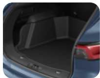
Gepäckraumwanne mit extra hohen Rändern Maximaler Schutz für Ihre Gepäckraumverkleidung. Die robuste Kunststoffwanne ist ideal für den Transport von feuchten und verschmutzten Gegenständen.