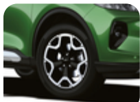
Leichtmetallrad 18" 5-Speichen-Y-Design, Machined Absolute Black 7,5 J x 18", ET 50, für Reifengröße 225/60 R18