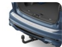
Heckstoßfängerschutz in Passform, Edelstahlblech Schützt den Heckstoßfänger und die Stoßfängerladekante Ihres Fahrzeugs beim Be- und Entladen. Die modellspezifische, perfekt sitzende Form fügt sich perfekt in das Fahrzeug-Design ein. Die Leiste bietet maximalen Lackschutz und lässt sich mittels der integrierten Klebefläche schnell und einfach anbringen. Bohren ist nicht erforderlich. Aus widerstandsfähigem Material. – ST-Line und ST-Line X