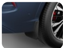
Schmutzfänger hinten, in Passform Satz 2-teilig, für Fahrzeuge mit Body-Styling-Kit – Für ST-Line und ST-Line X