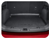
Gepäckraumwanne Mit Kuga Logo.