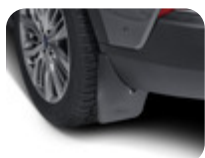
Schmutzfänger hinten, in Passform Satz 2-teilig, nicht in Verbindung mit Karosserie-Styling-Paket – Außer ST-Line und ST-Line X