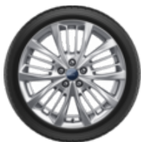
Leichtmetall-Winterkomplett 18" 5 x 4-Speichen-Design, Luster Nickel 7,5J x 18 ET 50, Semperit Speed-Grip 5, 225/60 R18 104V XL, Kennzeichnung für Reifeneigenschaften nach EU-Verordnung Nr. 2020/740 – Mit Reifendruckkontrollsensoren. Schneekettenfähig, die Kettenfähigkeit kann von den Felgenabmessungen abhängig sein.