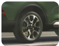
Leichtmetallrad 19" 5 x 2-Speichen-Design, Machined Absolute Black 7,5 J x 19", ET 50, für Reifengröße 225/55 R19