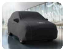
Premium Schutzabdeckung schwarz, mit weißen Nähten und weißem Ford-Emblem Maßgefertigte FORD Original-Stoffgarage für Ihr Fahrzeug, hergestellt aus modernsten Materialien. Für wirksamen Schutz gegen Staub und Schmutz, wenn Sie Ihr Fahrzeug nicht täglich im Gebrauch haben. So behält es seinen Glanz auch, wenn es in der Garage steht.