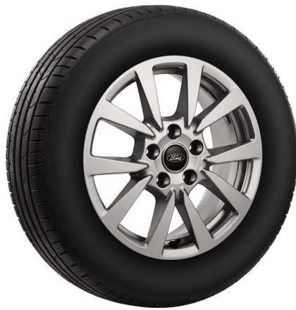
玩樂版 16 吋鋁圈