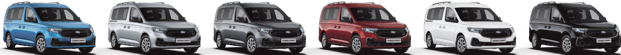
湖光藍 (4L) Boundless Blue