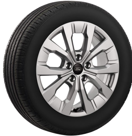
玩咖版 17 吋鋁圈