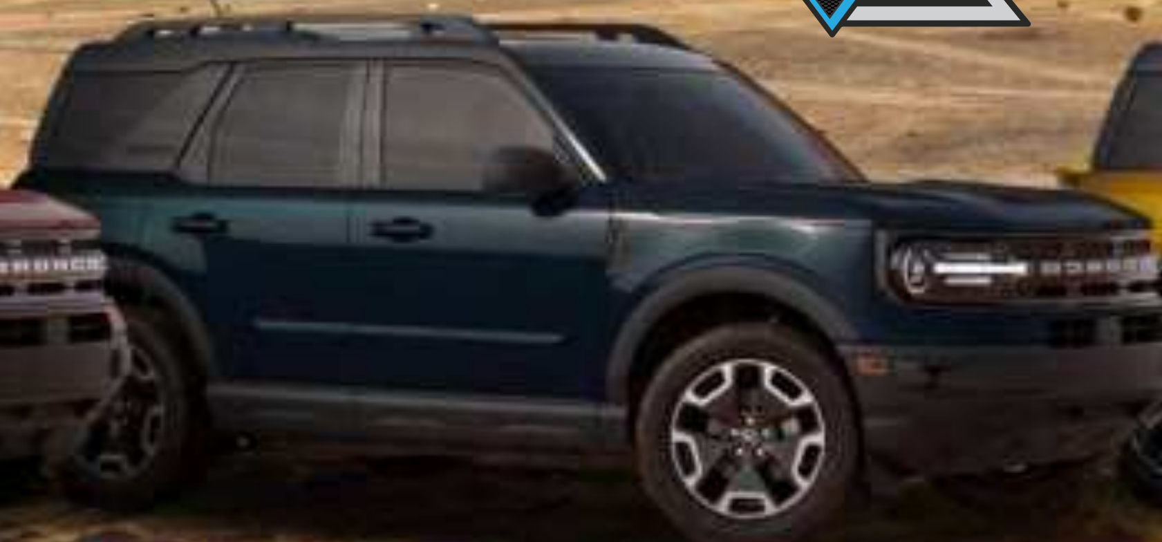
BLACK DIAMOND 4X4