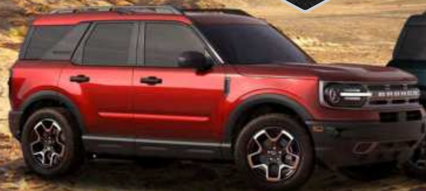
BIG BEND 4X4