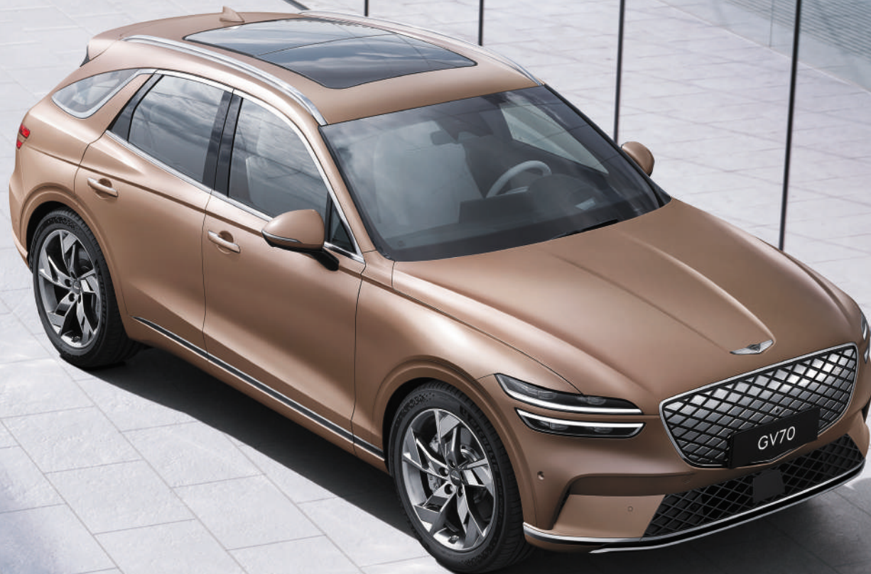
GENESIS ELECTRIFIED GV70