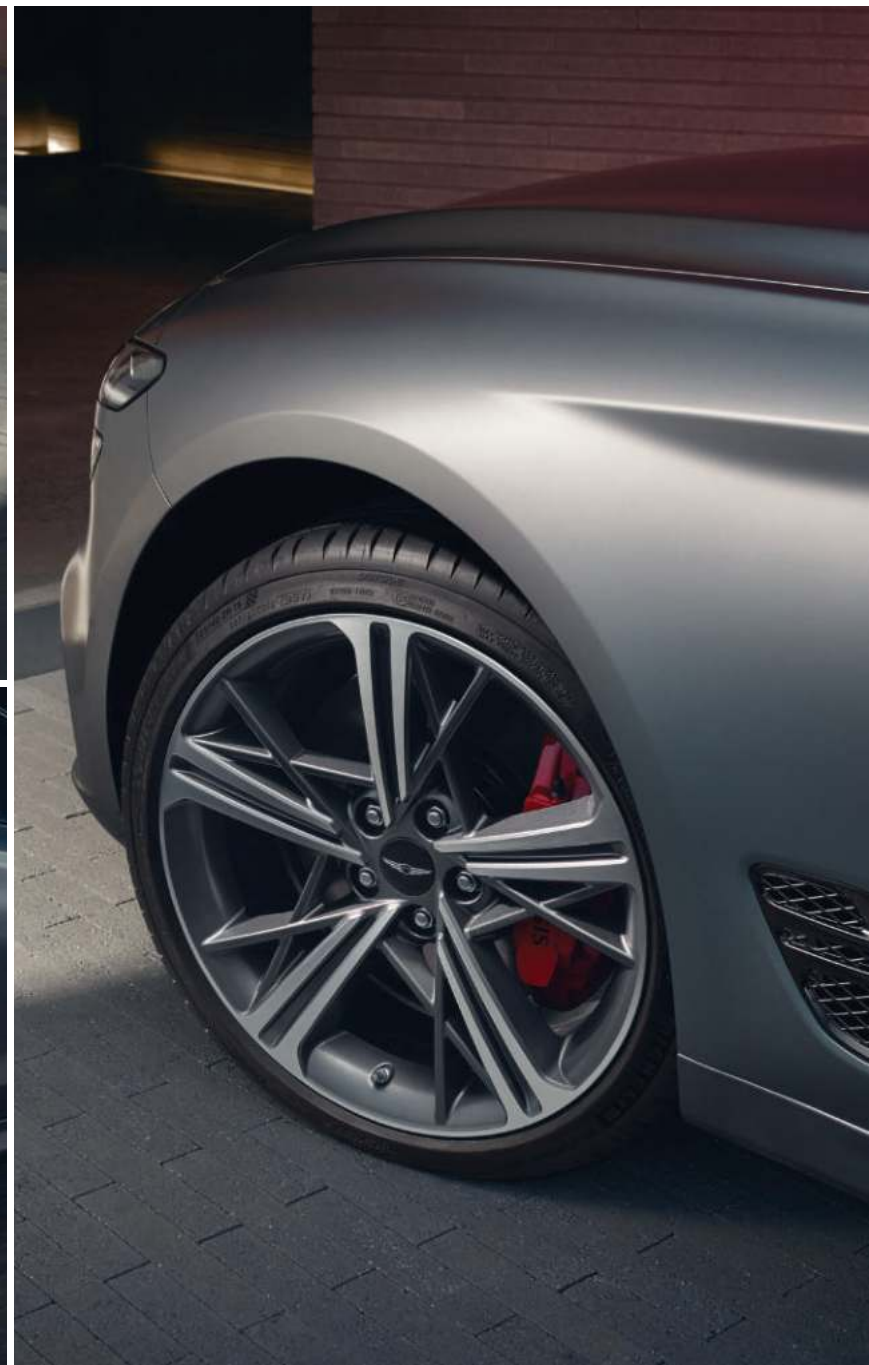
捷尼赛思 G70 运动套件