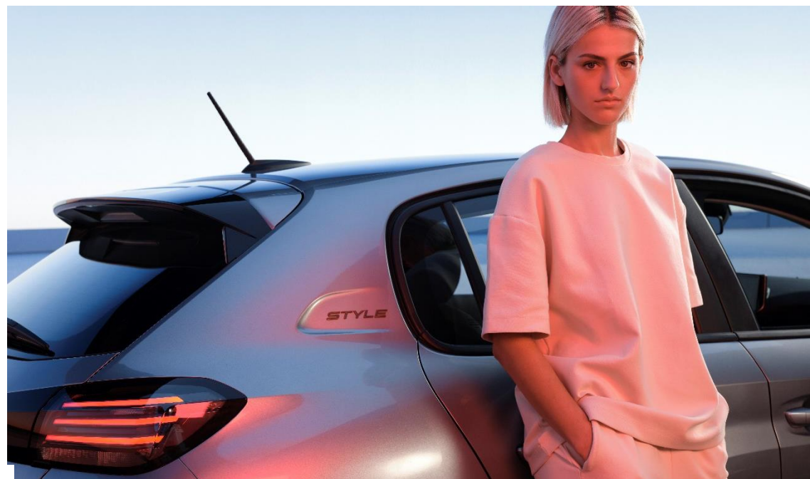
Abbildungen zeigen (teilweise versionsabhängige) Sonderausstattungen