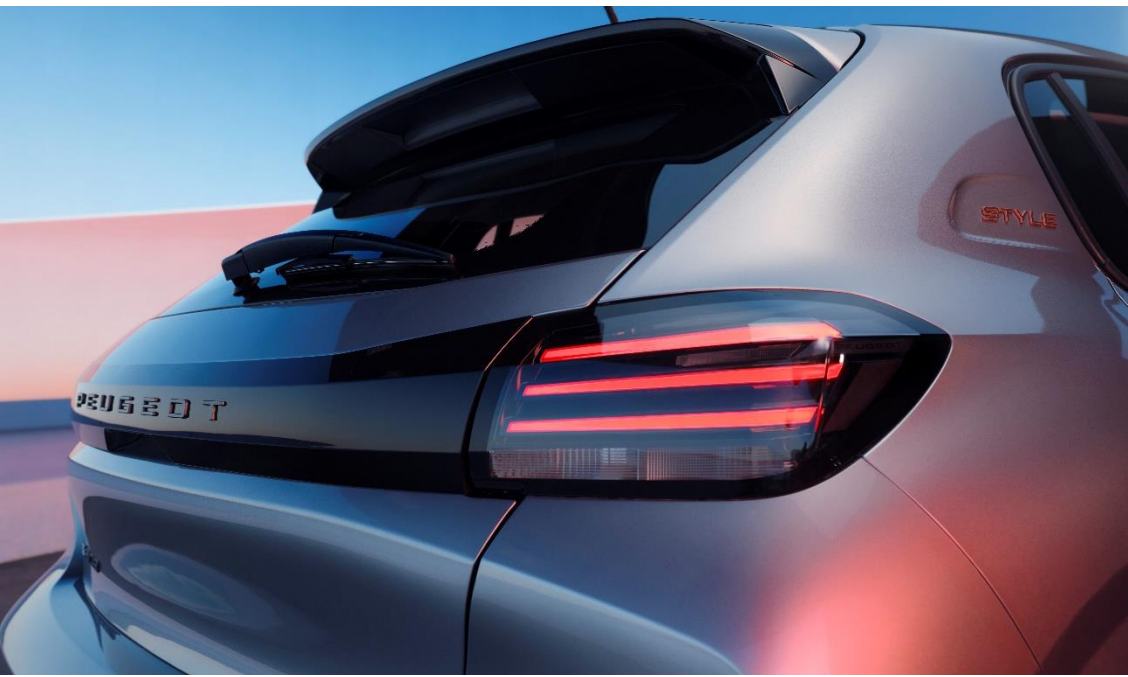
Abbildungen zeigen (teilweise versionsabhängige) Sonderausstattungen