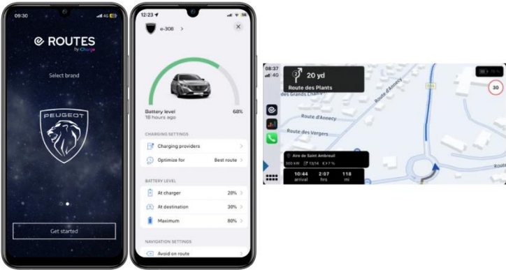
E-ROUTES durch F2M Charge

Beim E-208 berechnet und aktualisiert das in das Navigationssystem integrierte EV Routing die beste Route, indem es den Ladebedarf und die Ladezeiten anhand verschiedener Kriterien analysiert (Entfernung, Ladezustand der Batterie, Stromverbrauch usw.). Es ermöglicht die Anzeige von Lade-POIs und liefert eine Route unter Berücksichtigung der effizientesten Stopps, um die Ladezeit zu minimieren. Der Trip Planner von MyPeugeot App ermöglicht es Ihnen auch, eine Reise zu planen und sie Over The Air an das bordspezifische Navigationssystem zu senden.