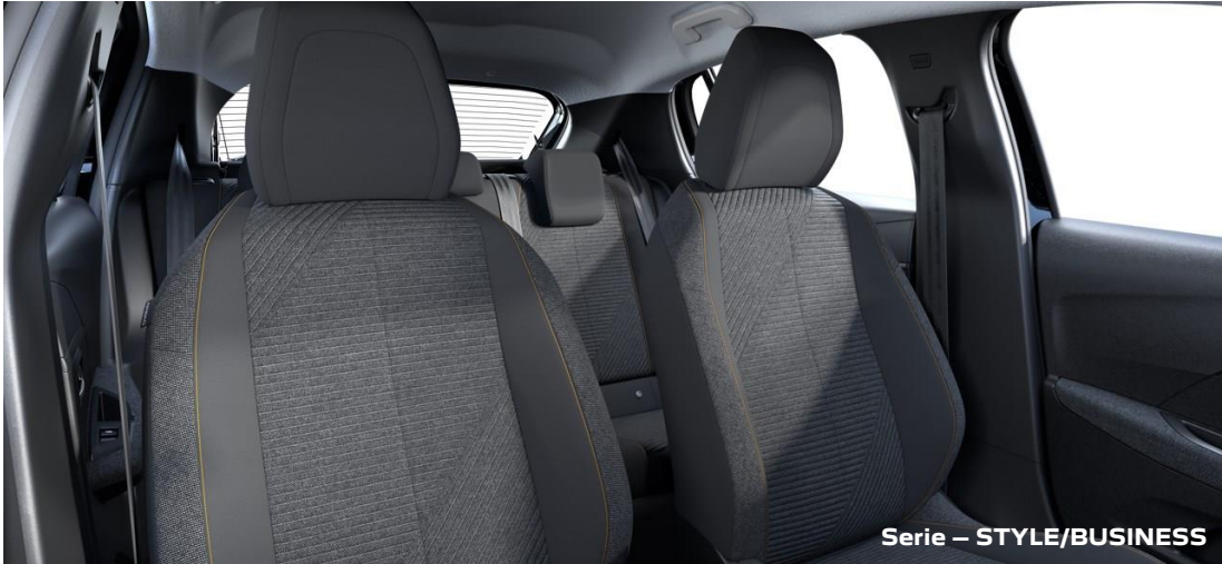
Stoff „Renzo“ in Schwarz mit Ziernähten in Orange Sunrise G9FX