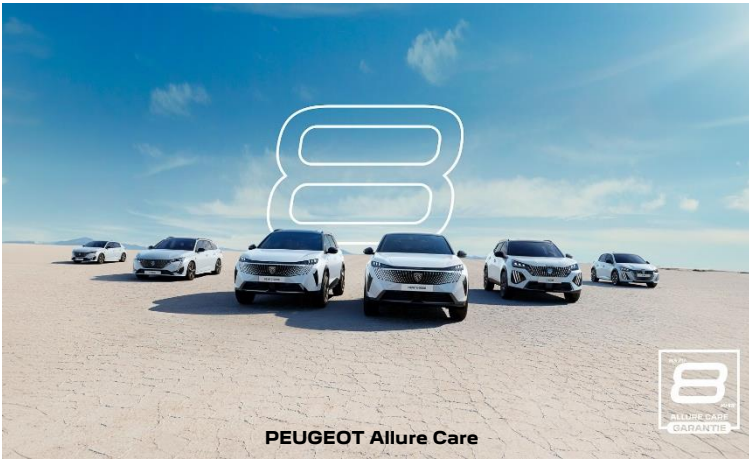
PEUGEOT Allure Care

Link: https://accessories.peugeot.com/de-DE/peugeot