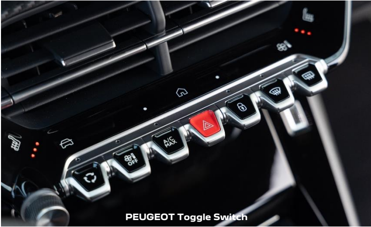
PEUGEOT Toggle Switch

PEUGEOT i-Connect® Advanced bietet ein umfassendes technologisches Erlebnis mit der vernetzten Navigation von TomTom®. Für eine optimale Lesbarkeit kann die Karte auf dem gesamten 10-Zoll-HD-Touchscreen angezeigt und „live“ (einmal im Monat) aktualisiert werden. Es ist außerdem vollständig und einfach mit Widgets anpassbar. „OK PEUGEOT“, eine Spracherkennungssteuerung in natürlicher Sprache, verbessert die Sicherheit und den Komfort des Benutzers und ermöglicht den Zugriff auf alle Funktionen. PEUGEOT i-Connect® Advanced bietet Ihnen zusätzlich eingebettete Dokumentation und Tutorials.