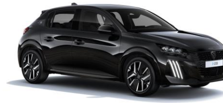
Perla Nera Schwarz