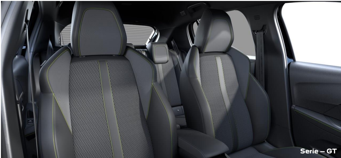
Stoff/Kunstleder „Belomka“ in Schwarz mit Ziernähten in Grün ATFX