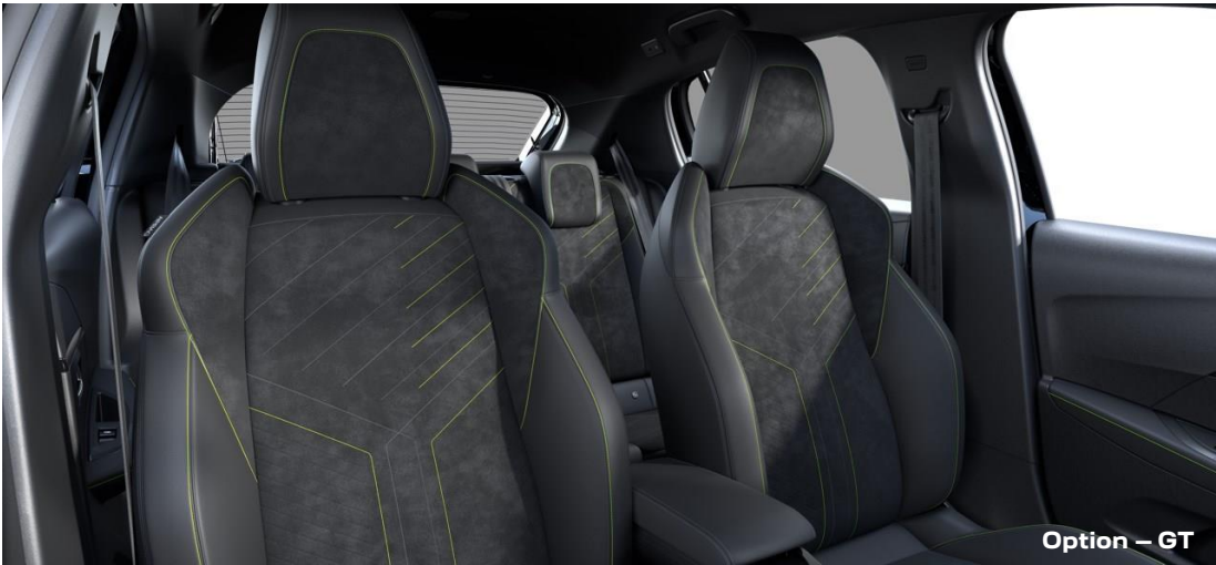
Alcantara/Kunstleder „Iconium“ in Schwarz mit Ziernähten in Grün und Grau WNFX