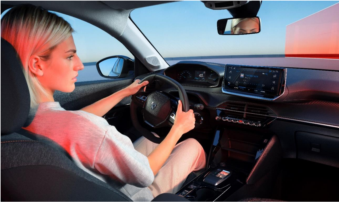
Abbildungen zeigen (teilweise versionsabhängige) Sonderausstattungen