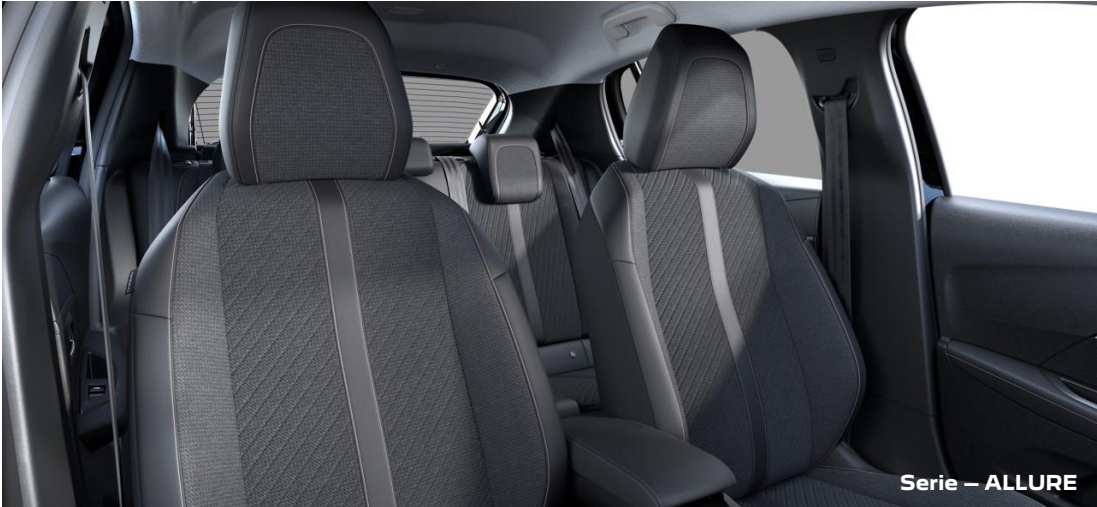
Stoff/Kunstleder „Lomsa“ in Schwarz mit Ziernähten in Rosa APFX