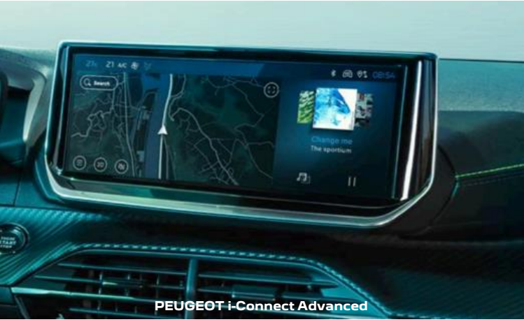
PEUGEOT i-Connect Advanced

PEUGEOT i-Connect® Advanced bietet ein umfassendes technologisches Erlebnis mit der vernetzten Navigation von TomTom®. Für eine optimale Lesbarkeit kann die Karte auf dem gesamten 10-Zoll-HD-Touchscreen angezeigt und „live“ (einmal im Monat) aktualisiert werden. Es ist außerdem vollständig und einfach mit Widgets anpassbar. „OK PEUGEOT“, eine Spracherkennungssteuerung in natürlicher Sprache, verbessert die Sicherheit und den Komfort des Benutzers und ermöglicht den Zugriff auf alle Funktionen. PEUGEOT i-Connect® Advanced bietet Ihnen zusätzlich eingebettete Dokumentation und Tutorials.