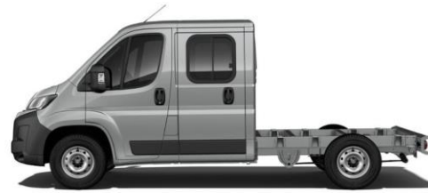
STAHL (ARTENSE) GRAU M0F4 700,00 (833,00)