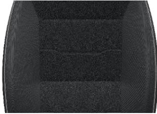
CREPE BLACK MIT RÜCKENLEHNENMUSTER