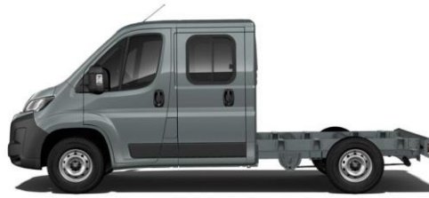
THUNDER GRAU P02B 350,00 (416,50)