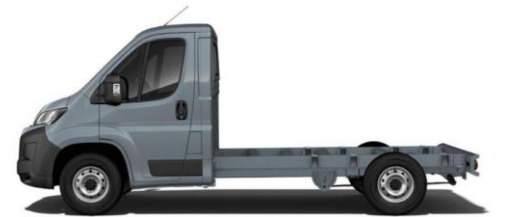
EISEN GRAU M0ZW 700,00 (833,00)