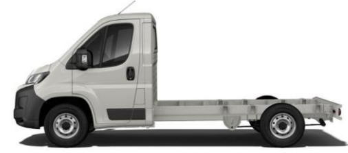
EXPEDITION GRAU P04K 350,00 (416,50)