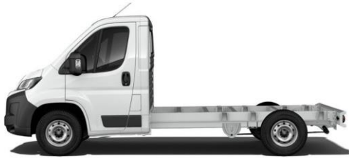
WEISS POPR 0,00 (0,00)