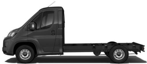
GRAPHIT GRAU M0E9 700,00 (833,00)