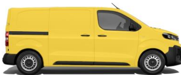
Verkehrsgelb, RAL 1023