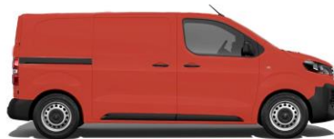
Feuer-Rot, RAL 3000