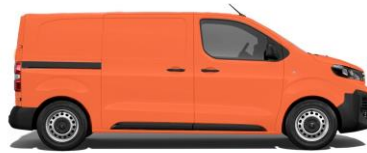
Kommunalorange, RAL 2011