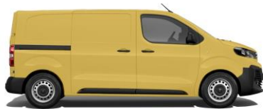
Ginster-Gelb, RAL 1032