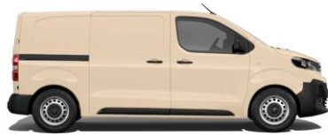
Hellelfenbein, RAL 1015