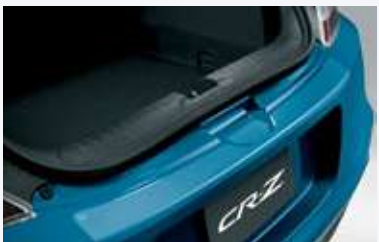
Cinta protectora de defensa trasera