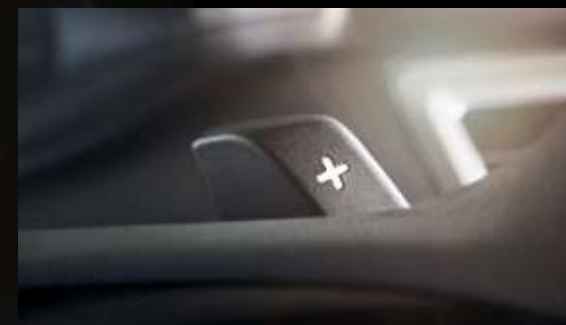
Transmisión de velocidad Continuamente Variable (CVT) y paletas de cambios en el volante (Paddle Shifters).