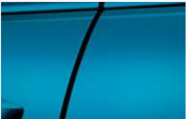
Cinta protectora de orilla de puerta

Con los accesorios originales Honda te ofrecemos hasta 3 años o 60,000 kilómetros de garantía, si los adquieres e instalas al momento de la compra de tu auto nuevo, en las concesionarias autorizadas Honda; de un año si la compra y la instalación se realizan en las concesionarias autorizadas Honda, después de haber adquirido tu vehículo, o de 60 días, si los accesorios son instalados fuera de alguna concesionaria.