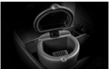
Cenicero tipo vaso

Las especificaciones, equipamiento e ilustraciones que aquí se presentan están basadas en la última información disponible al momento de publicar este documento, Honda de México se reserva el derecho de realizar cambios en cualquier momento sin previo aviso en colores, especificaciones, materiales y modelos.