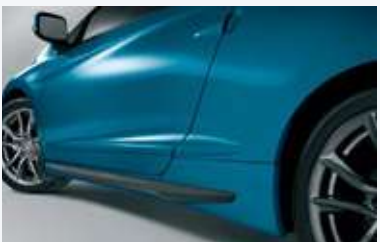
Molduras protectoras laterales