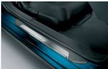
Adorno de piso para puerta