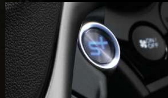
Botón de respuesta instantánea Sport Plus.