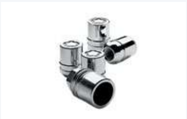
Birlos de seguridad