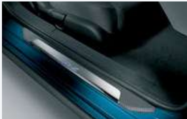
Adorno de piso para puerta con luz