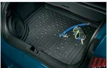
Bandeja de carga