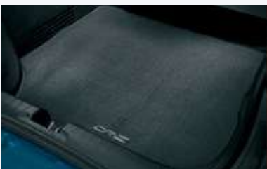
Tapete de alfombra para área carga