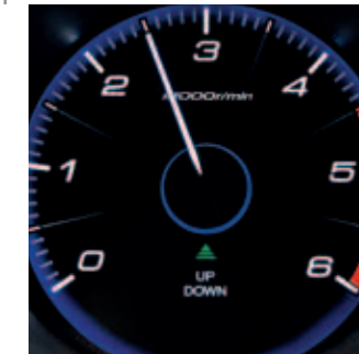
Indicador luminoso cambio de velocidad