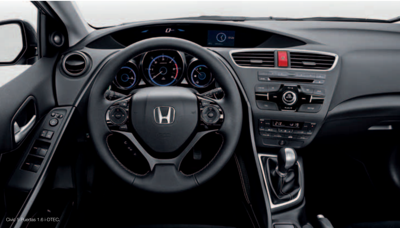
Civic 5 Puertas 1.6 i-DTEC.