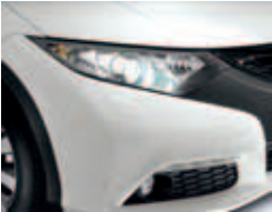
Luces de xenón duales