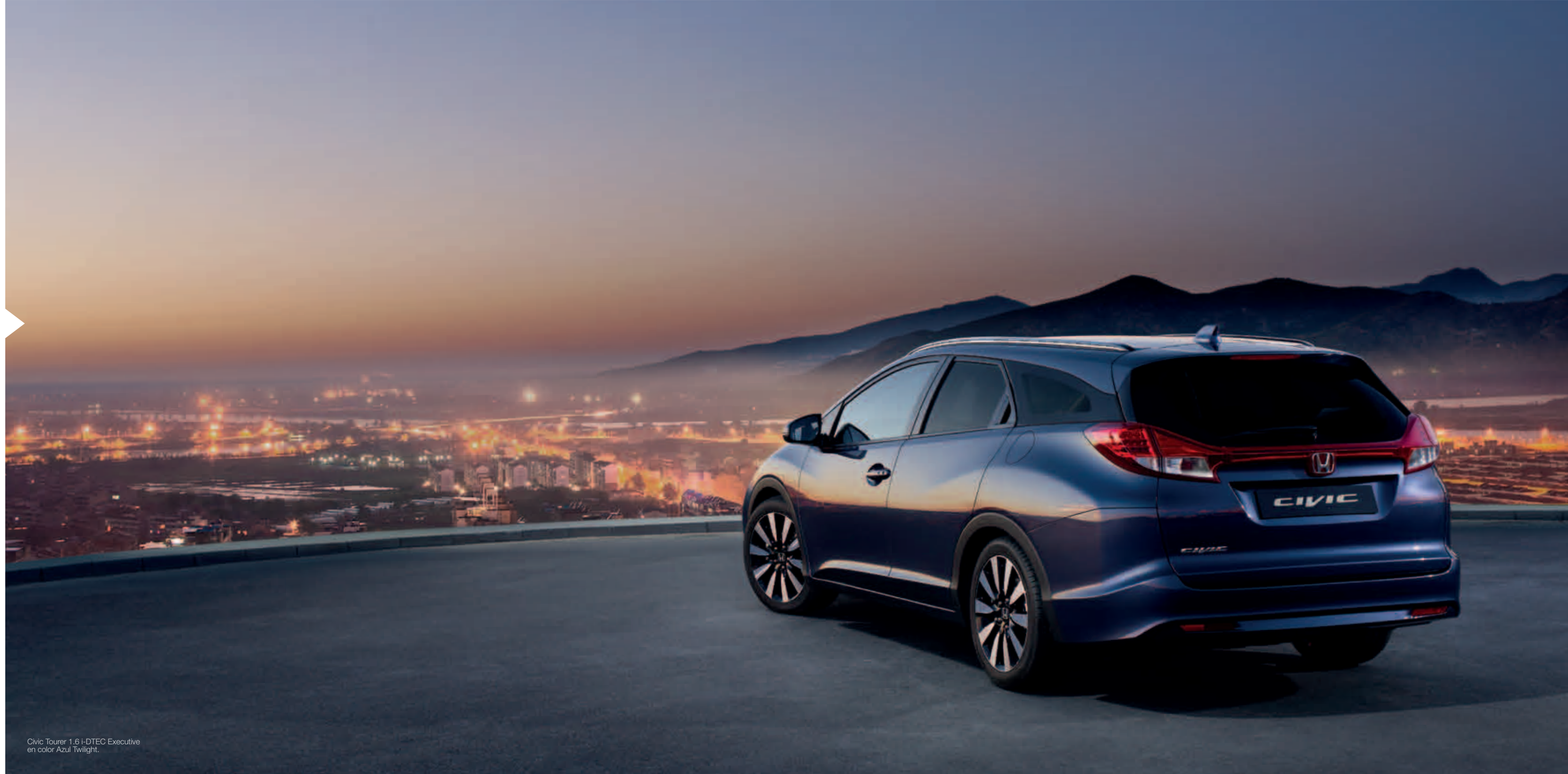
Civic Tourer 1.6 i-DTEC Executive en color Azul Twilight.

Un coche familiar aerodinámico con un perfil totalmente único, pensado para no renunciar ni al estilo ni al espacio.