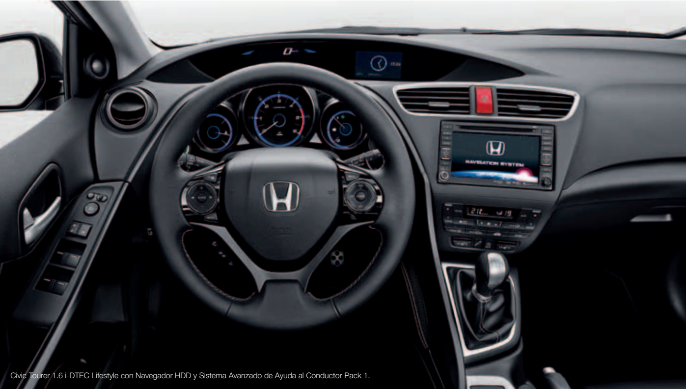
Civic Tourer 1.6 i-DTEC Lifestyle con Navegador HDD y Sistema Avanzado de Ayuda al Conductor Pack 1.

Navegador HDD con Sistema Avanzado de Ayuda al Conductor Pack 1