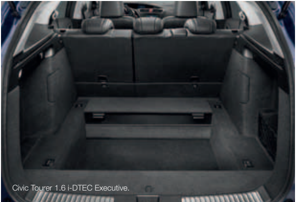
Civic Tourer 1.6 i-DTEC Executive.