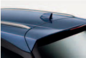
Barras de techo (Tourer)

Sistema de Suspensión Adaptativa Barras de techo en acabado gris metalizado Red separadora de carga Bandeja cubre maletero retráctil de un solo toque Anclajes en maletero para sujeción de carga Embellecedor metálico de la zona de carga