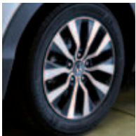
Llanta de 16" aero para 1.6 i-DTEC