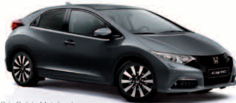
Gris Pulido Metalizado