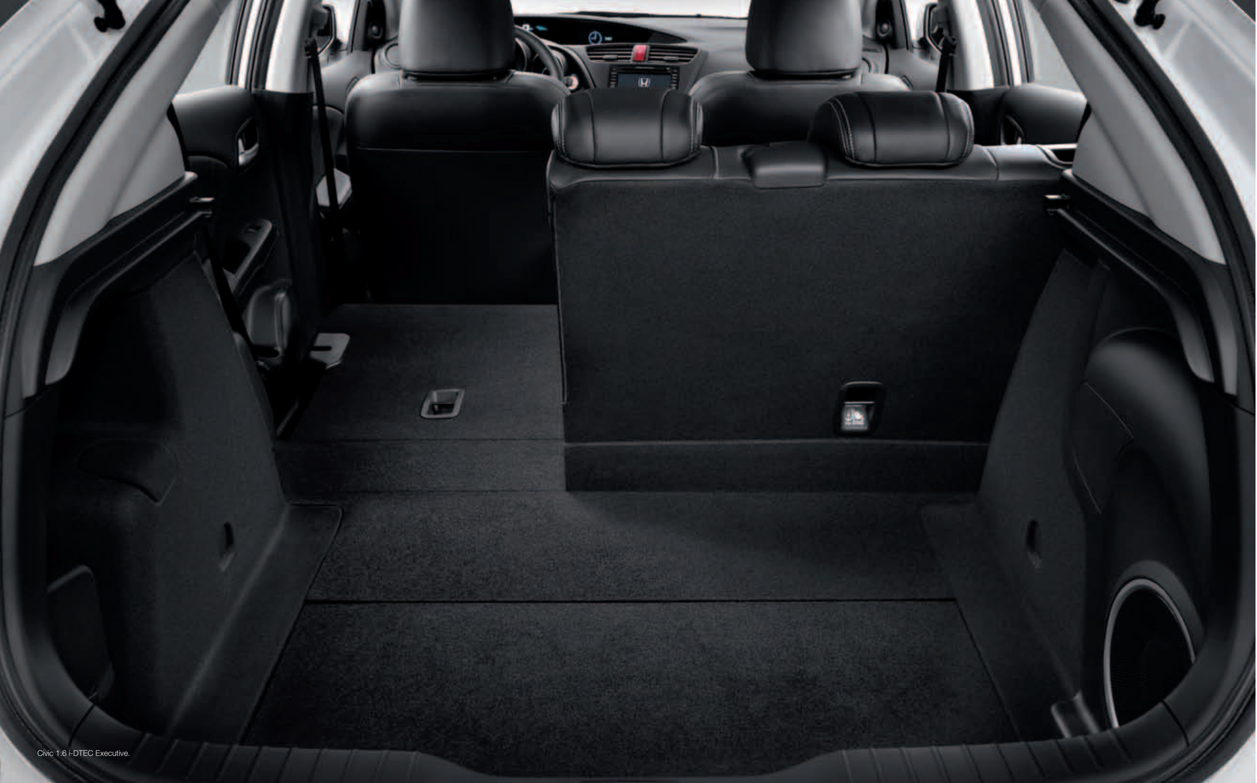
Civic 1.6 i-DTEC Executive.