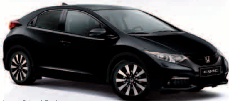
Negro Cristal Perlado