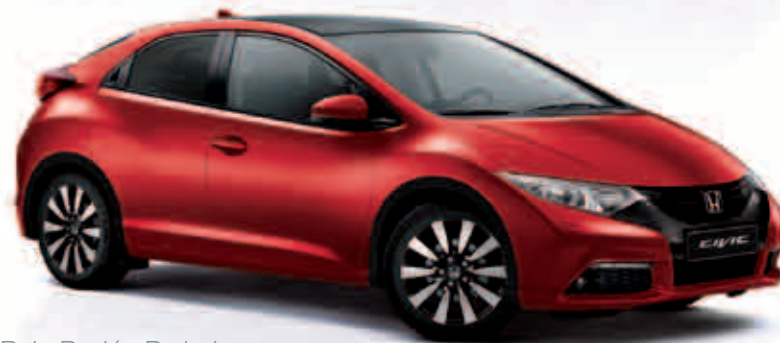
Rojo Pasión Perlado