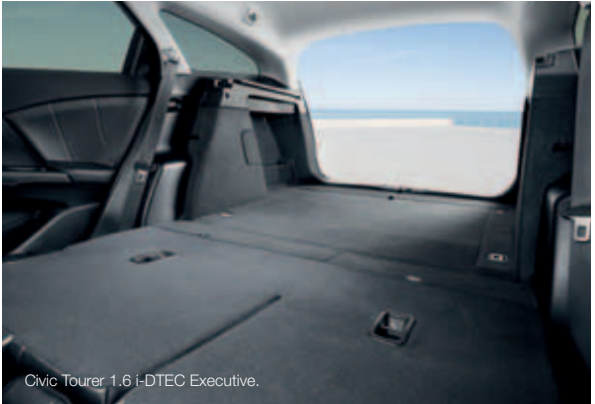
Civic Tourer 1.6 i-DTEC Executive.