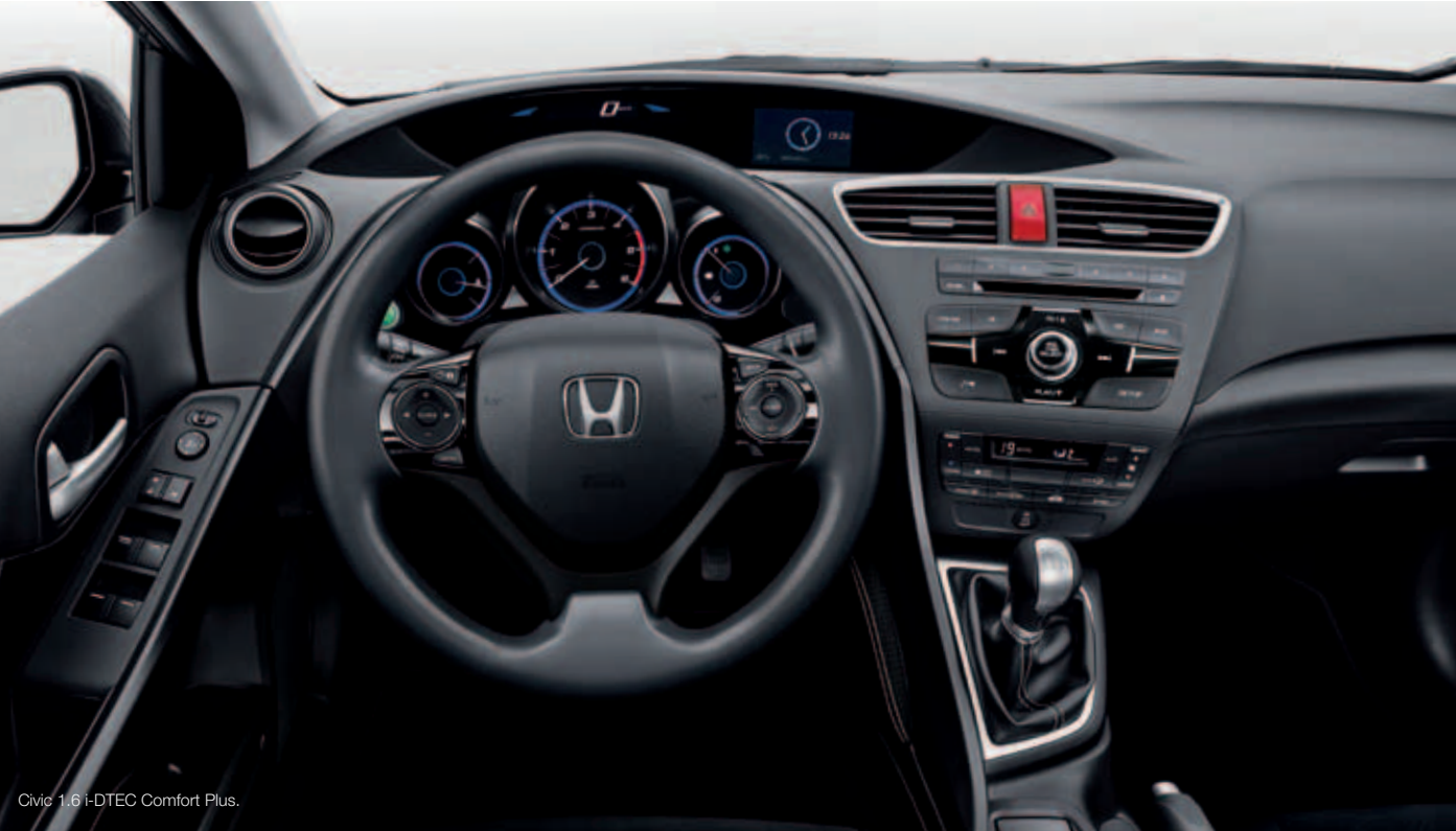
Civic 1.6 i-DTEC Comfort Plus.