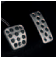
Pedales deportivos metálicos

Bandeja cubre maletero retráctil de un solo toque