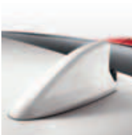
Antena tipo aleta de tiburón