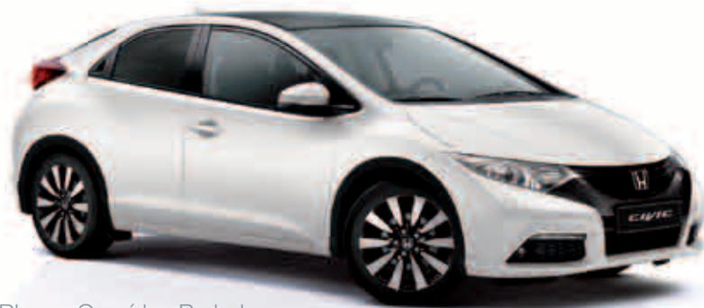
Blanco Orquídea Perlado