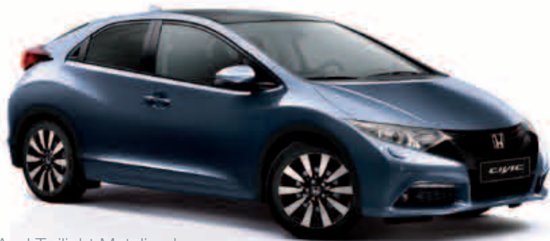
Azul Twilight Metalizado

¿Eres rojo o plata, blanco o azul? Con esta amplia variedad de colores siempre encontrarás uno que encaje con tu estilo y personalidad.