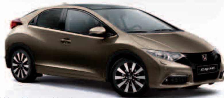
Urban Titanium Metalizado