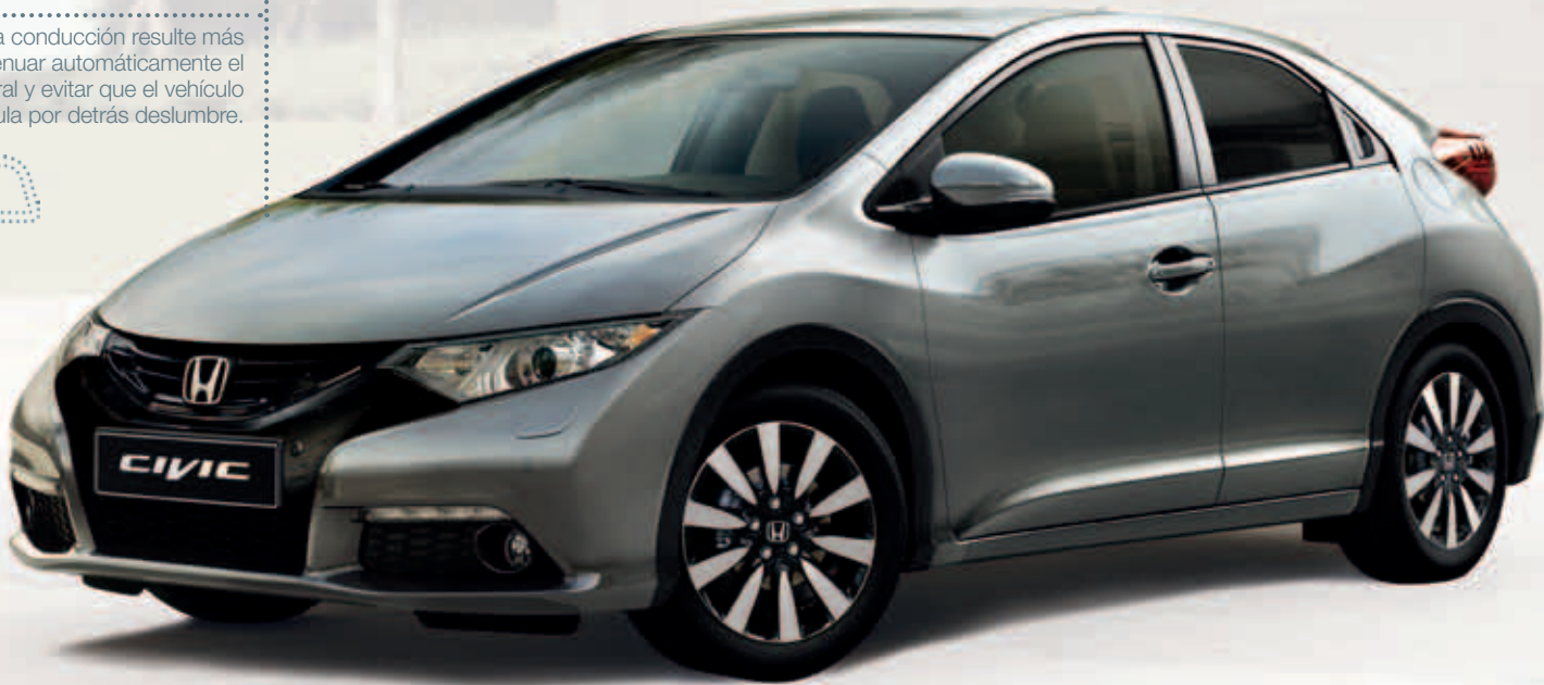
Civic 1.6 i-DTEC Lifestyle en color Gris Pulido Metalizado.

Unidos a la cámara de visión trasera, facilitará aún más la maniobra.