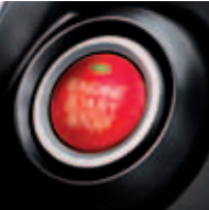
Entrada y arranque inteligente sin llave (Smart Keyless Entry)