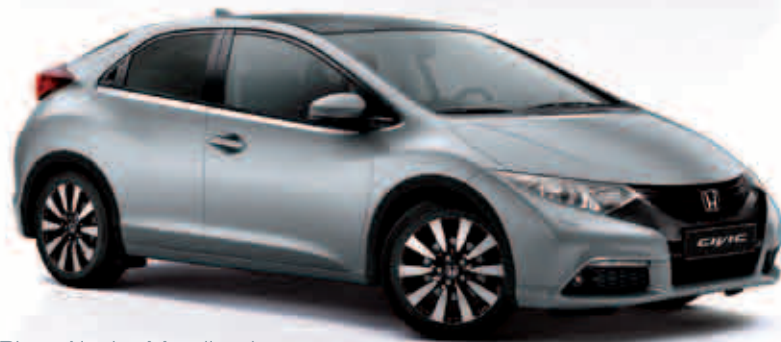
Plata Alaska Metalizado