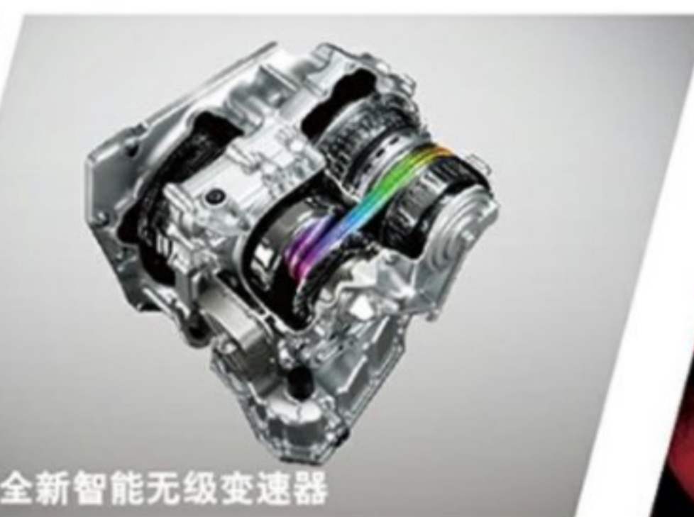
日产全新智能无级变速器