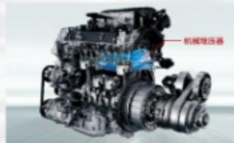
机械增压HEV混动系统