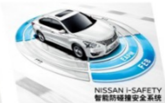
NISSAN I-SAFETY 智能防撞安全系统