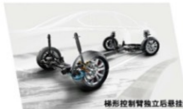
梯形控制臂独立后悬挂