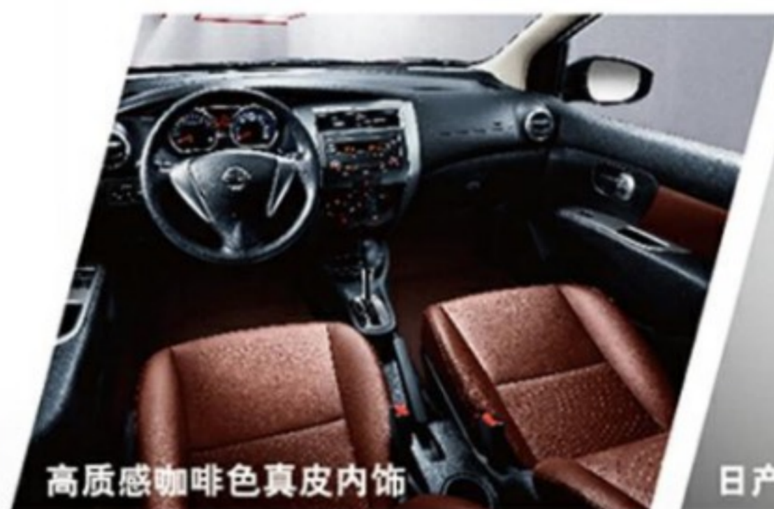
高质感咖啡色真皮内饰

■ 空间 长至2600mm的轴距 ■ 油耗 低至6.1L/的百公里油耗 ■ 动力 91kw强劲动力 ■ 活力 动感V-SHARP设计概念