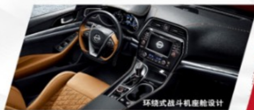
环绕式战斗机座舱设计